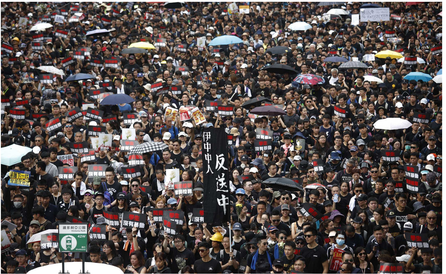
2019年6月16日，香港民阵发起第四次反对《逃犯条例》修订大游行，有200万人参与。