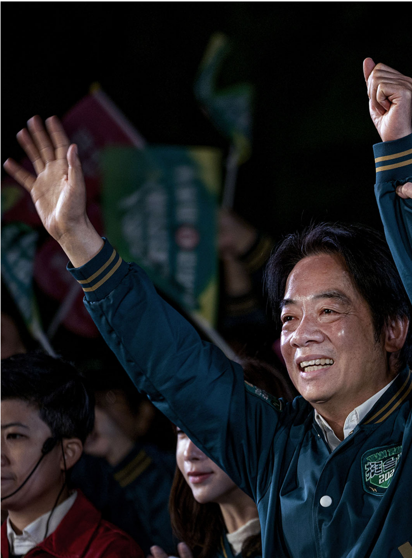
2024年1月11日，台北凱達格蘭大道，民進黨在總統府前舉行造勢晚會，總統蔡英文在台上發言。

我們看到了稱呼自己從「中華民族」、「海峽兩岸中國人」（李登輝）到「台灣人民」（陳水扁）的轉變，台灣總統對海峽彼岸的國家／政權則是從中共（李登輝）、中華人民共和國（陳水扁）、大陸（馬英九）到中國（蔡英文）。綠營的稱呼，從「中華人民共和國」到僅僅是「中國」仍是一相不小的轉變，前者著重政治上的分野，後者則是同時包括文化與政治的雙重角度區分台灣與中國。同樣地，國民黨內本土派者如李登輝強調的「中共」同樣屬於黨派與政權的觀念，而馬英九這一位所謂的外省權貴集團出身者所指稱的「大陸」則具有文化的與政治的雙重面向，連結起兩岸的情感與認同面。