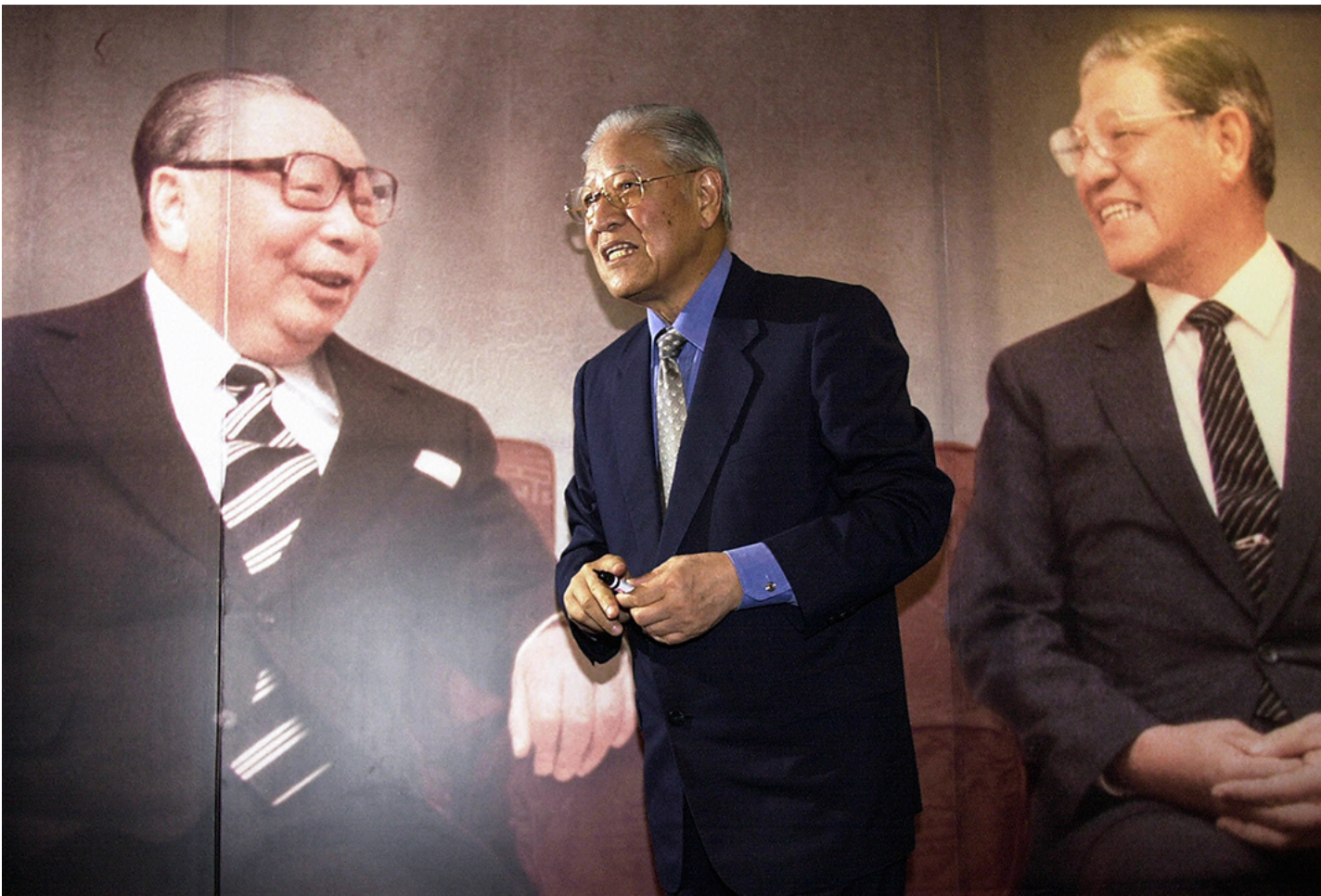
2004年5月16日，台灣前總統李登輝在台北舉行的新聞發布會上，李登輝介紹他的新書，該書闡明了他與前總統蔣經國的關係。