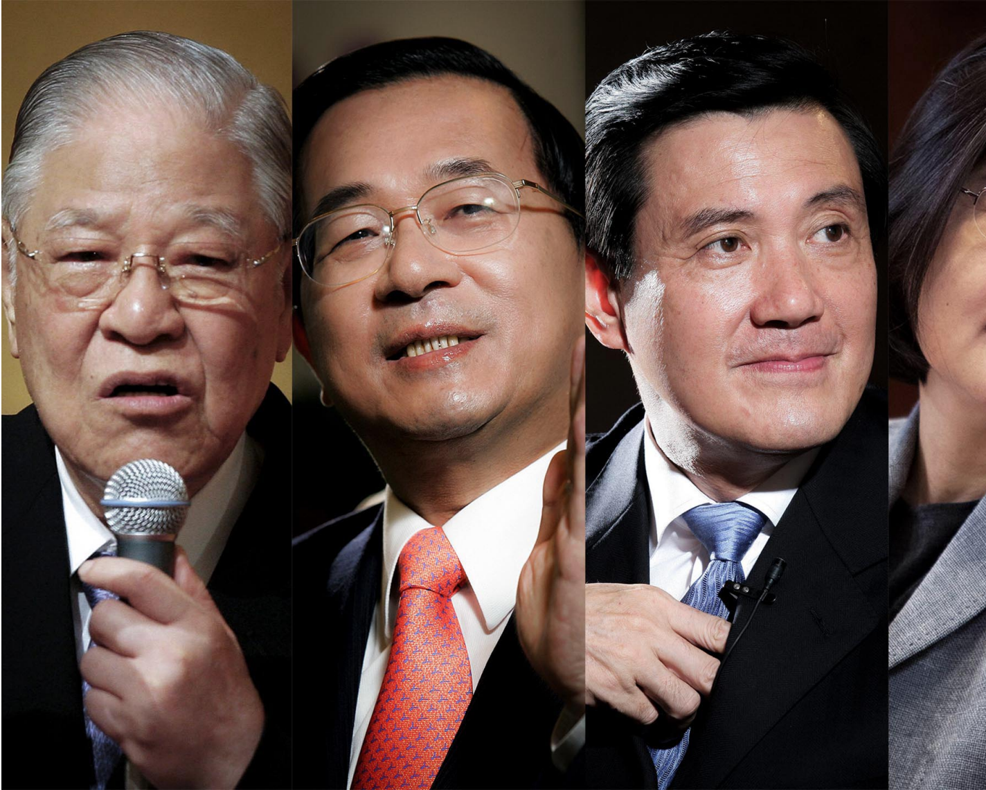
台灣前總統李登輝、台灣前總統陳水扁、台灣前總統馬英九及台灣總統蔡英文。