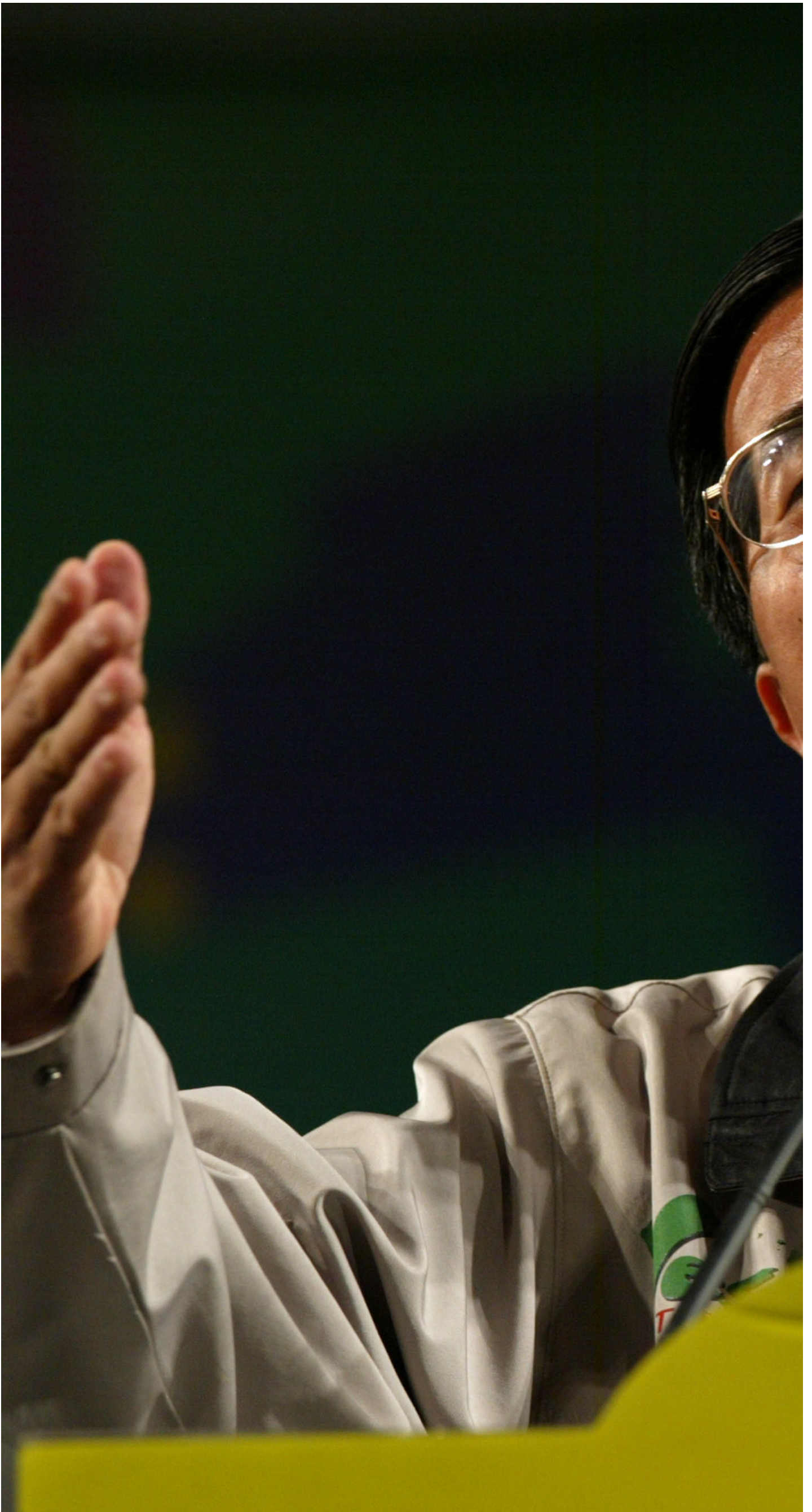
2004年3月12日，台北，台灣總統陳水扁在競選集會上向支持者發表演說。

2000年以相對多數上台的民進黨籍總統陳水扁，是台灣自1945年國民黨統治後首次非國民黨籍的總統，完成二戰後首次政黨輪替。其時也適逢小布希（George W. Bush）當選美國總統，小布希原先欲扭轉克林頓期間極度友中的政策而改採遏制的策略，但2001年911恐攻爆發後，華府需要北京共同進行國際反恐，華府在策略上又轉向與中國友好，因此對陳水扁施加很多壓力，擔心陳水扁大動作將造成美中兩國更大摩擦。