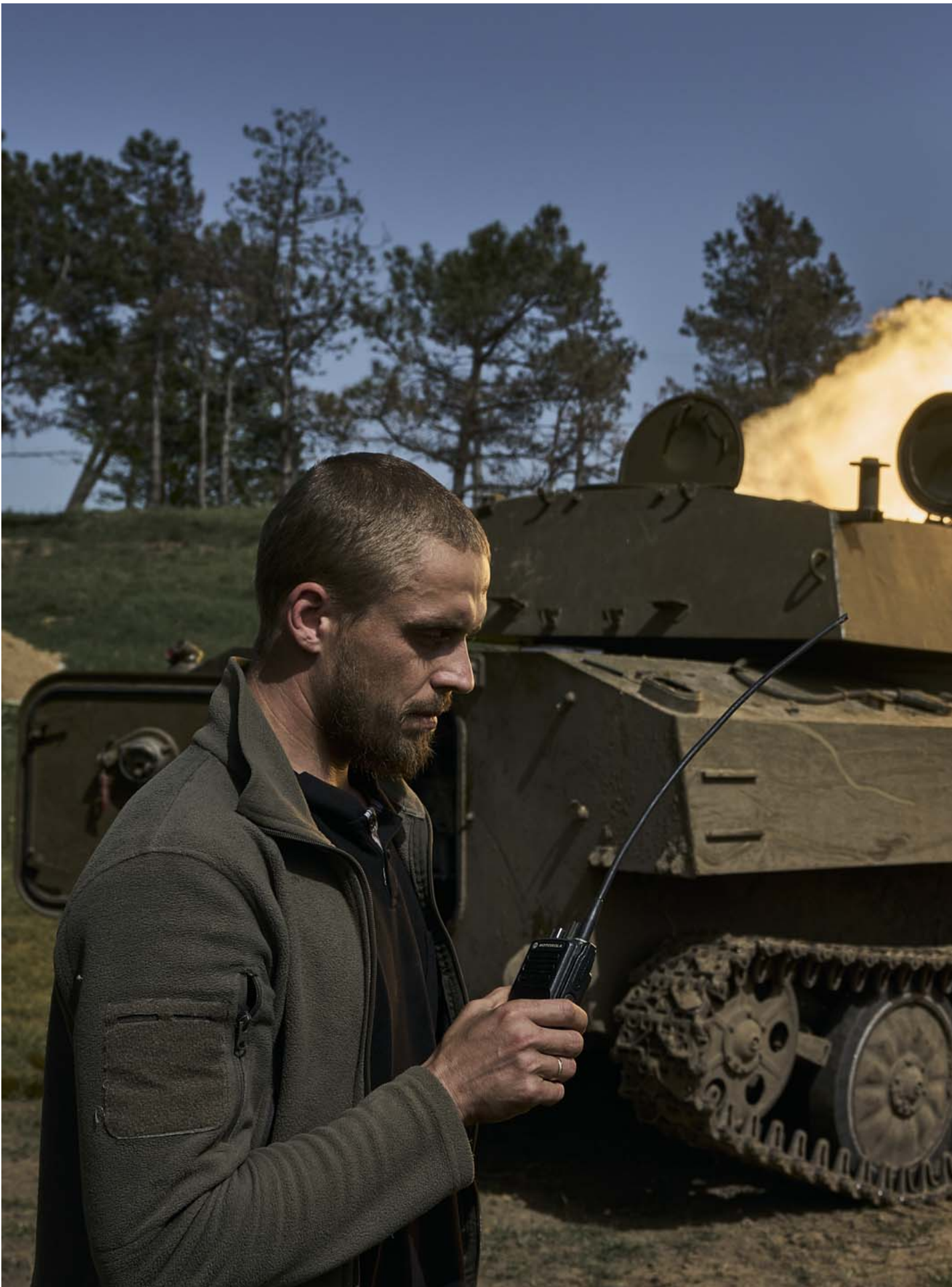
2024年4月27日，乌克兰赫尔松，海军陆战队第 37 独立旅执行支援第聂伯河左岸步兵的战斗任务，士兵操作 2S1 Gvozdika 自行榴弹炮。

第二个原因是动员的迟缓导致乌军士兵极为短缺。乌军前线官兵在访谈中普遍抱怨人员匮乏。例如在 阿夫季伊夫卡以西 ，俄军投入了12个旅，而乌军只剩下5个残缺不全的旅，因此，当乌军115旅被指临阵脱逃导致防线崩溃，随后 回应称 俄军数量是自己的10-15倍时，他们可能并不完全是在为自己开脱。 这两者一起又形成了一个恶性循环——西方盟友见乌克兰没有动员意愿，就更不愿提供武器；武器迟迟不到，即使有了新兵也无法武装，上战场的风险就更高，民众也就更抵触动员，因而政府也就更不愿动员。（延伸阅读：《 专访联合国难民署驻乌克兰代表比林：乌克兰人最深的恐惧是被世人遗忘 》） 第三个原因是乌军并没有在长期经营的第一道防线和要塞化城镇之后大规模挖掘第二、第三道防线，因而当第一道防线被俄军攻破，后续就很难立足于稳固的新防线中，只能不断撤退。这一点在阿夫季伊夫卡失守后尤为明显。