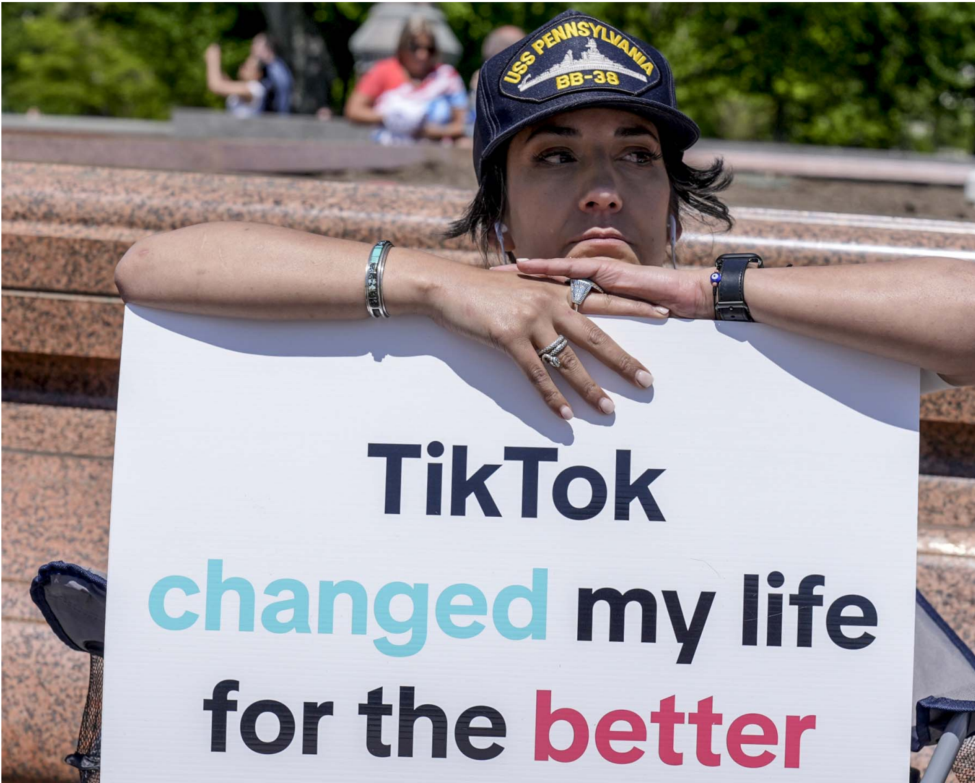
2024年4月23日，美国华盛顿，一名 TikTok 创作者坐在国会大厦外请愿。

现在订阅端传媒会员，立享春季限时优惠： 畅读月费会员9折 | 畅读年费会员8折 | 尊享年费会员7折 。在端，打开一扇观察社会的窗。