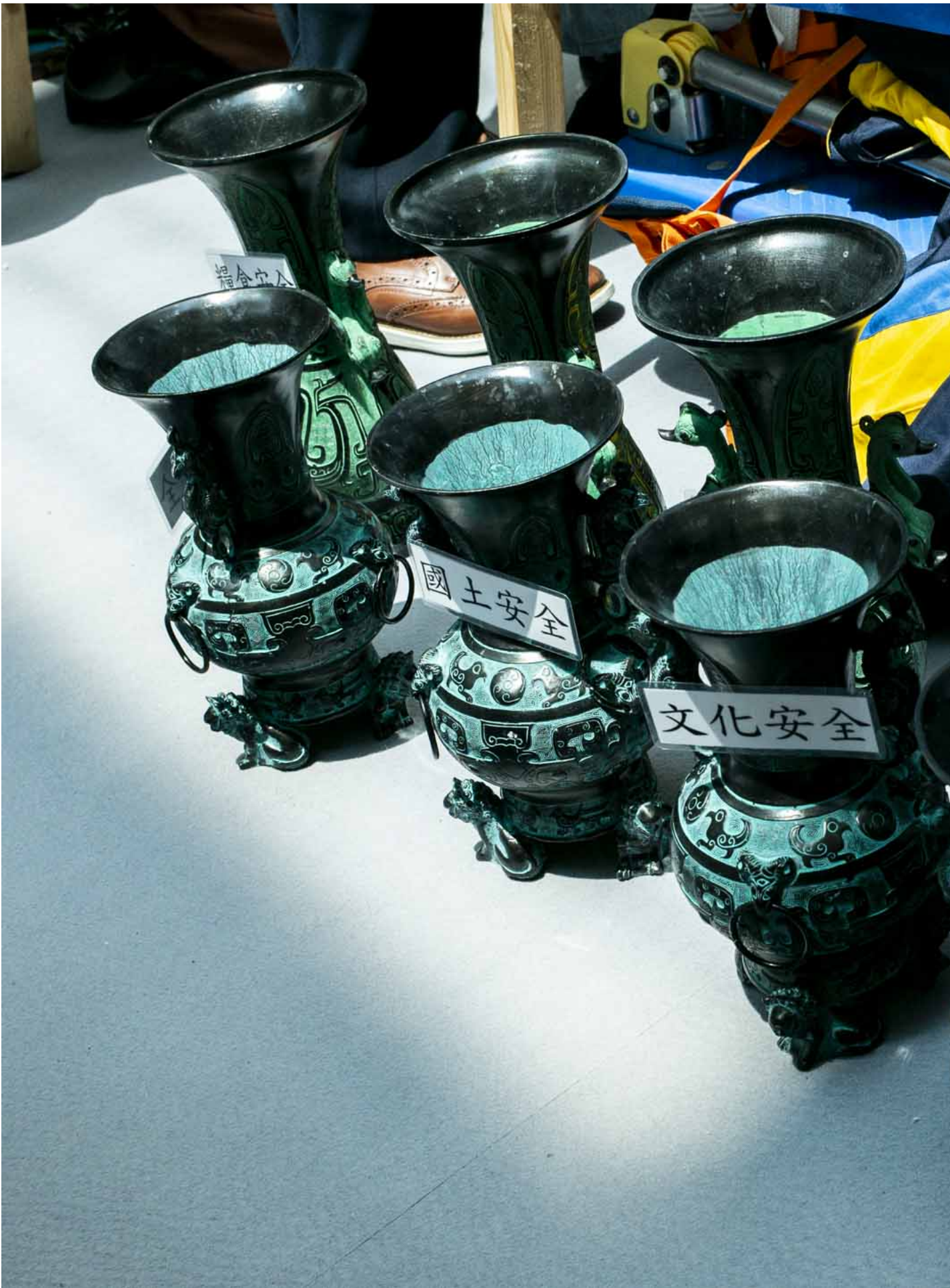
2024年4月13日，“国安•保良•将军澳”活动在将军澳新都城中心举行，有展览，摊位游戏和综艺表演。