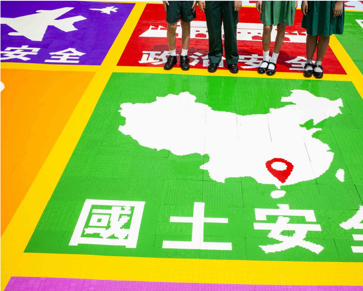
2024年4月14日，黄大仙广场举办“国家安全由我做起 - 巨型积木马赛克2024”活动。

夏宝龙指，香港由治及兴是全社会的共同事业。参与市民说，每个公民都有责任维护香港的安全，但“安全的内容，我未参透”。