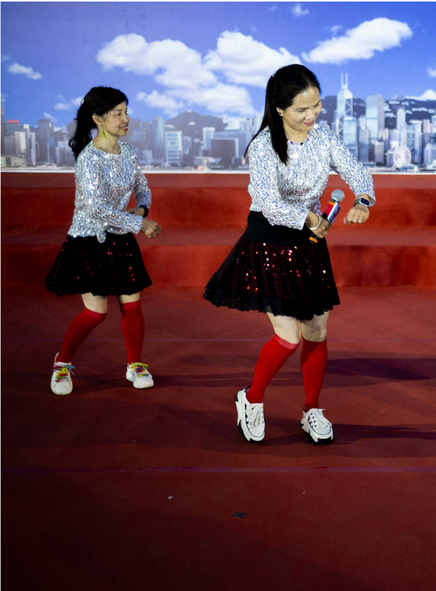
2024年4月15日，全民国家安全教育日嘉年华在维园举行，当中有舞蹈唱歌的演出。