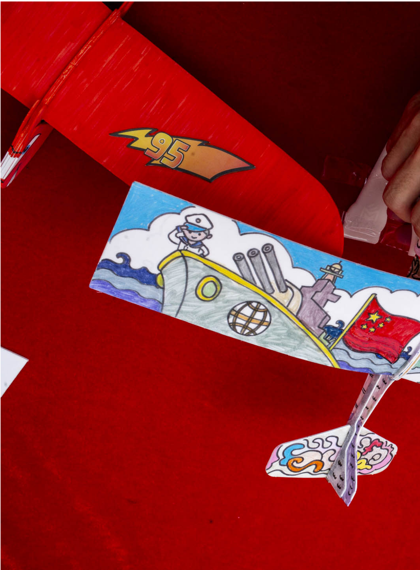
2024年4月14日，黄大仙广场举办“国家安全由我做起 - 巨型积木马赛克2024”活动。

除了轻松的嘉年华活动，也有地区举办国安研讨会。在中西区，便举办了一场由行政会议成员、资深大律师汤家骅主讲的讲座。在社区会堂坐满近三百名听众，有中学生、穿著橙红色背心的关爱队与许多中老年街坊等。中学生在问答环节积极发问的同时，有老人几乎全程低头闭目养神。 在这场长达一小时的演讲中，汤家骅对比英美国安法律，称香港的国安法条是“现代化”的法律；他还分析国际人权公约、《中英联合声明》、强调国安法至今未曾被滥用——这些都是外国社会、政要、报章常批评香港国安时代的内容。 有听众提及关于行政长官和立法会普选的《基本法》45条和68条。汤家骅说自己完全同意对于普选的追求，称23条立法后，希望在“可见得将来、在生之年”可以见到普选。但他多次强调，要获得中央的信任，在香港行使普选不会影响到国家安全，“不要只是说我们要什么，我们都要想，中央作为香港社会最重要持份者，你可不可以令他安心？”