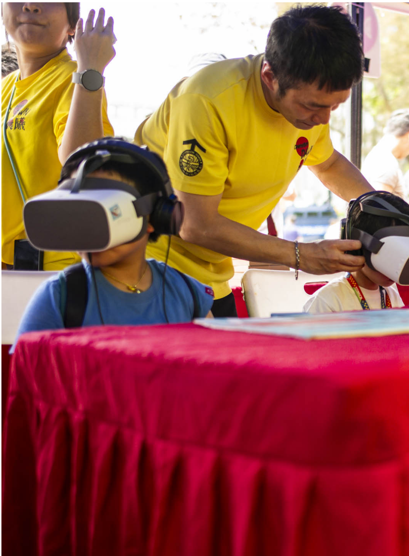
2024年4月14日，观塘区国家安全嘉年华在香港辅警总部举行，包括步操汇演、摊位游戏、表演及展览等活动。