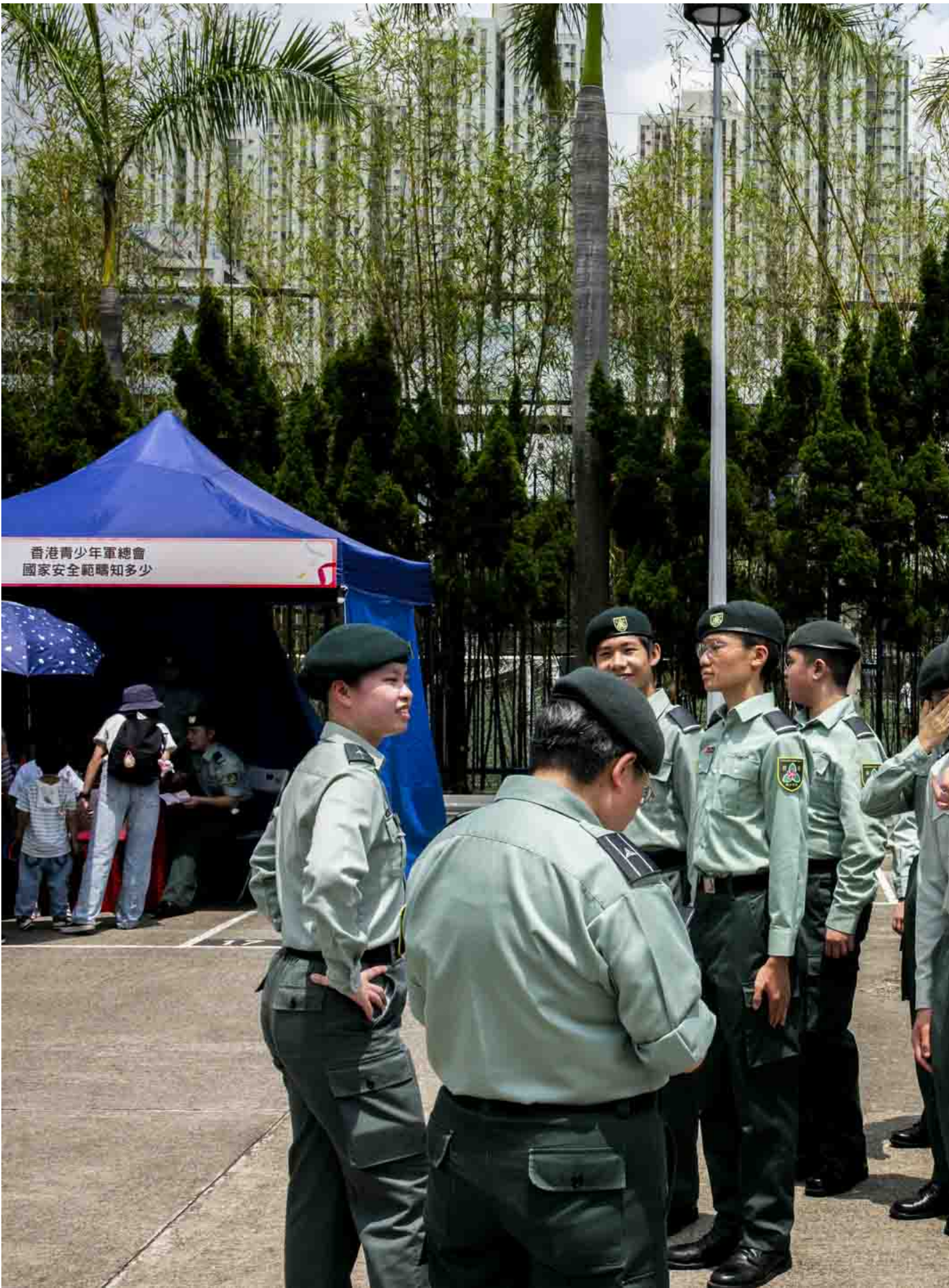
2024年4月14日，观塘区国家安全嘉年华在香港辅警总部举行，包括步操汇演、摊位游戏、表演及展览等活动。