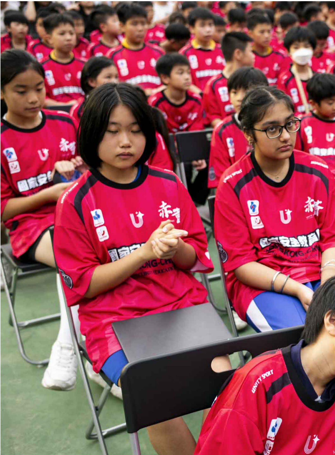
2024年4月15日，全民国家安全教育日嘉年华在维园举行，有国安知识展板及国安教育摊位游戏、香港警务处反恐装备展示、新兴运动体验等活动。