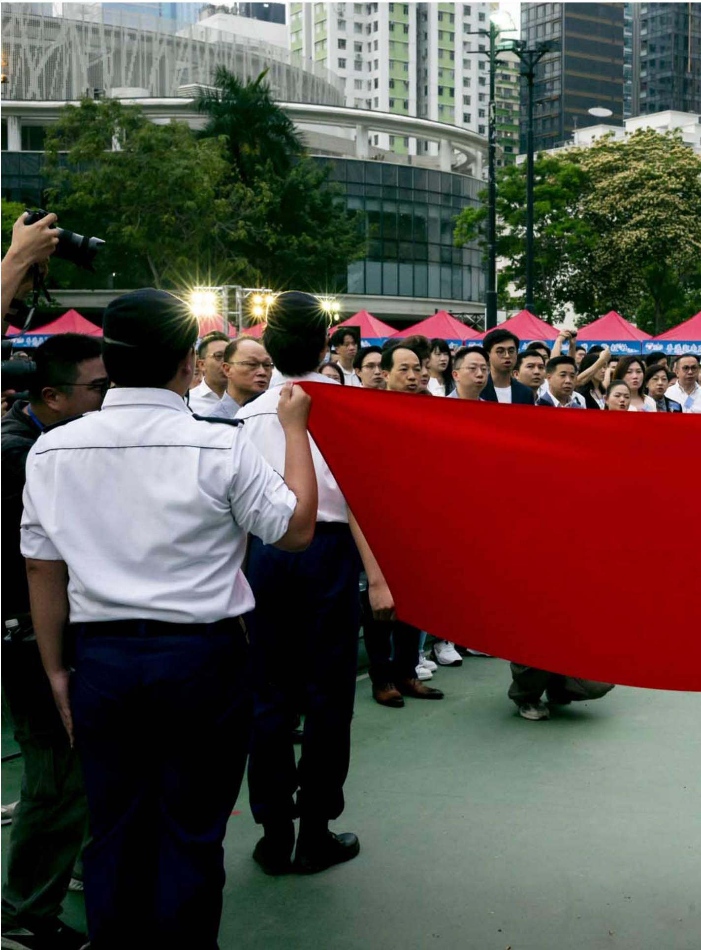
2024年4月15日，全民国家安全教育日嘉年华在维园举行，有国安知识展板及国安教育摊位游戏、香港警务处反恐装备展示、新兴运动体验等活动。

维园国安教育活动占据两块足球场大小，密密麻麻的国安知识展板划分出不同活动场地。除了歌舞表演舞台和游戏摊位外，活动场地另一侧由警队把守。水炮车和剑齿虎装甲车驻阵，铮亮的镇暴武器颇受小朋友欢迎，有的小朋友爬上警车玩乐，也有人倚在水炮车旁。不少市民配戴上警队服装和设备，与全副武装的纪律部队合影，气氛其乐融融。