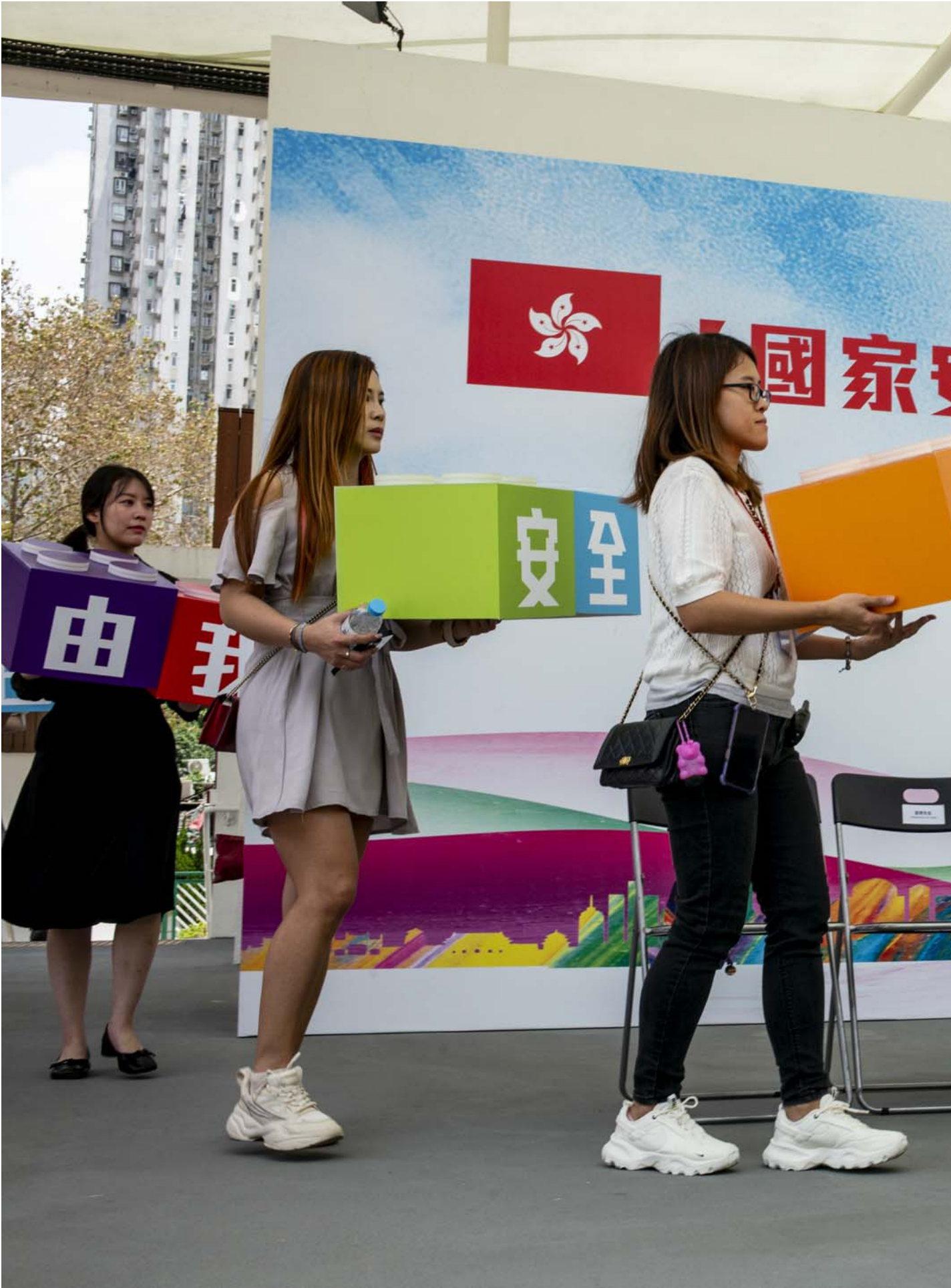
2024年4月14日，黄大仙广场举办“国家安全由我做起 - 巨型积木马赛克2024”活动，工作人员作最后准备。