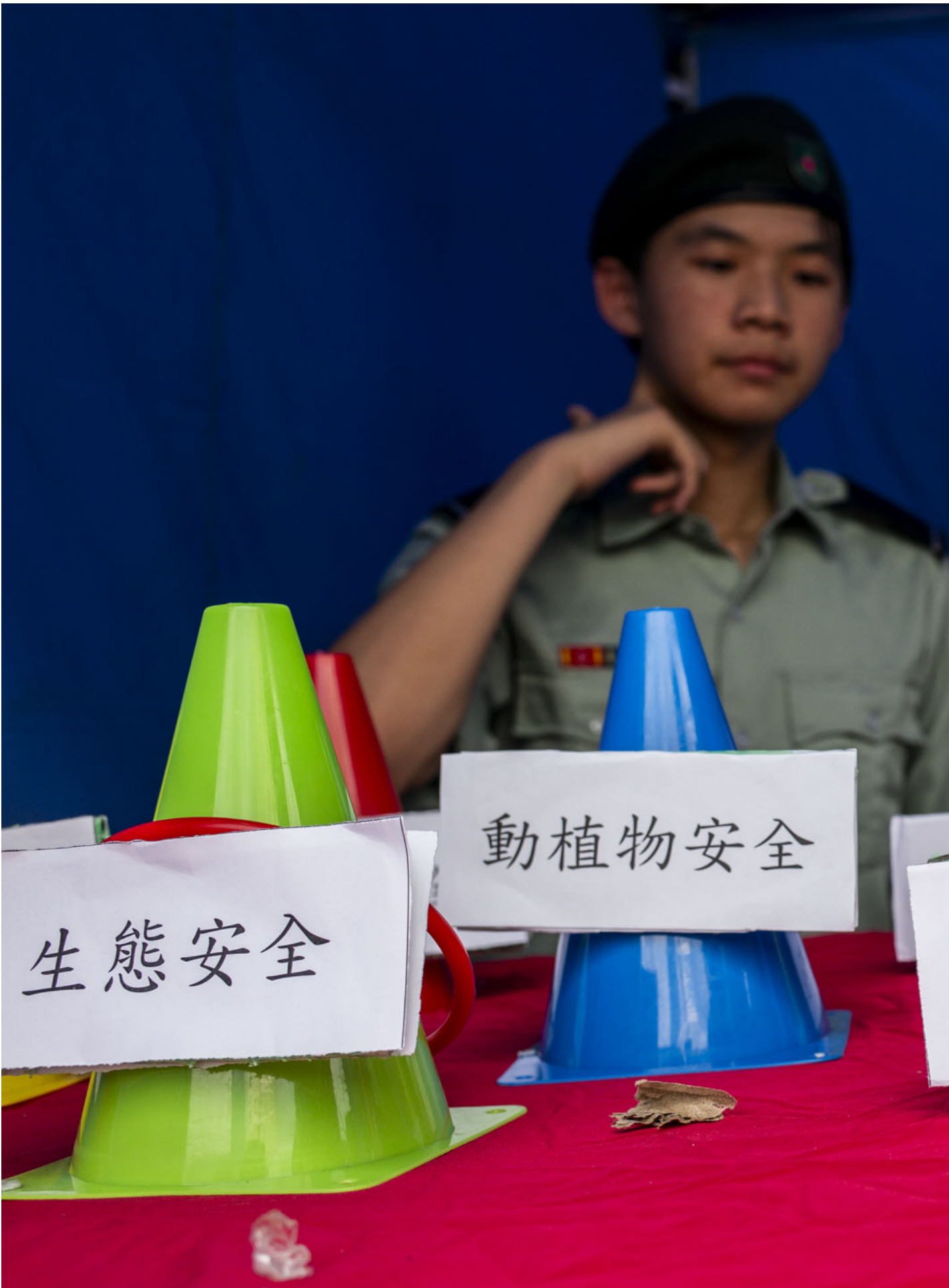
2024年4月14日，观塘区国家安全嘉年华在香港辅警总部举行，包括步操汇演、摊位游戏、表演及展览等活动。