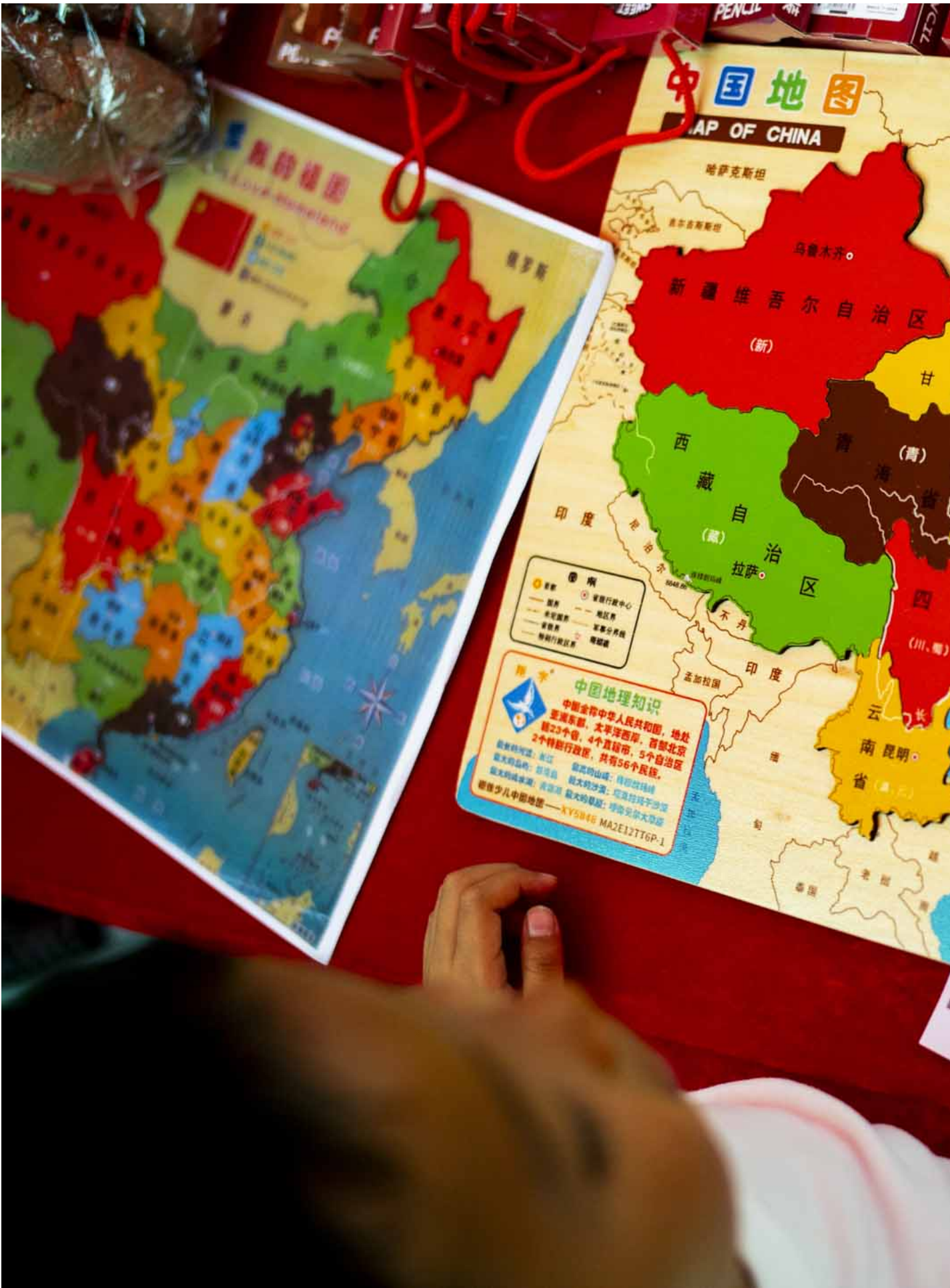
2024年4月15日，全民国家安全教育日嘉年华在维园举行，有国安知识展板及国安教育摊位游戏、香港警务处反恐装备展示、新兴运动体验等活动。