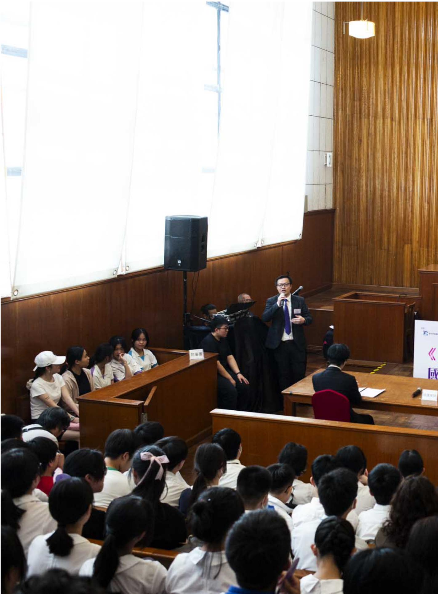
2024年4月15日，《同“深”卫国安》国家安全教育日2024在前北九龙裁判法院举行，期间有模拟法庭体验。

如今，在法院一楼，三个法庭被分为“安稳香港影视区”、“智识国安挑战”区域，以及模拟法庭予公众参与。