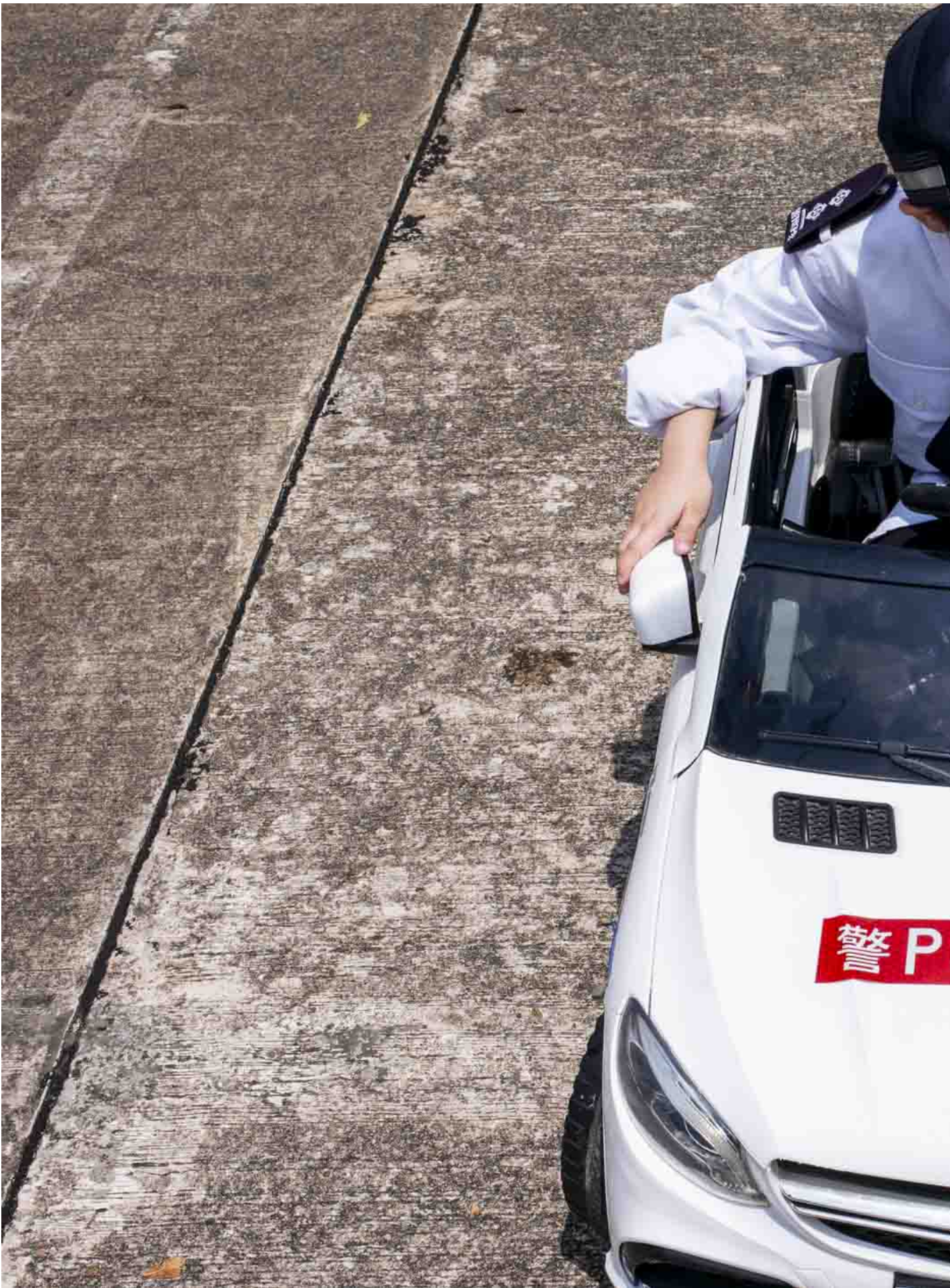
2024年4月14日，观塘区国家安全嘉年华在香港辅警总部举行，包括步操汇演、摊位游戏、表演及展览等活动。

50岁的黄先生住在维园附近，知道今日是国家安全教育日，特意来看看有什么能帮上忙。他连连称赞今年的好气氛，“不只是今天，香港的安全每个公民都有责任去维护。至于安全的内容，我就未参透。但我觉得每个市民都有责任。” 连续两年参与国安教育日活动的何小姐则认为，今年氛围算是不错，但上年有更多参与者。何小姐60多岁，她认为国安法带来秩序，令香港摆脱“乱七八糟的2019年”。她殷切地期盼有更多同类型活动，希望政府可以扩大宣传国安理念。