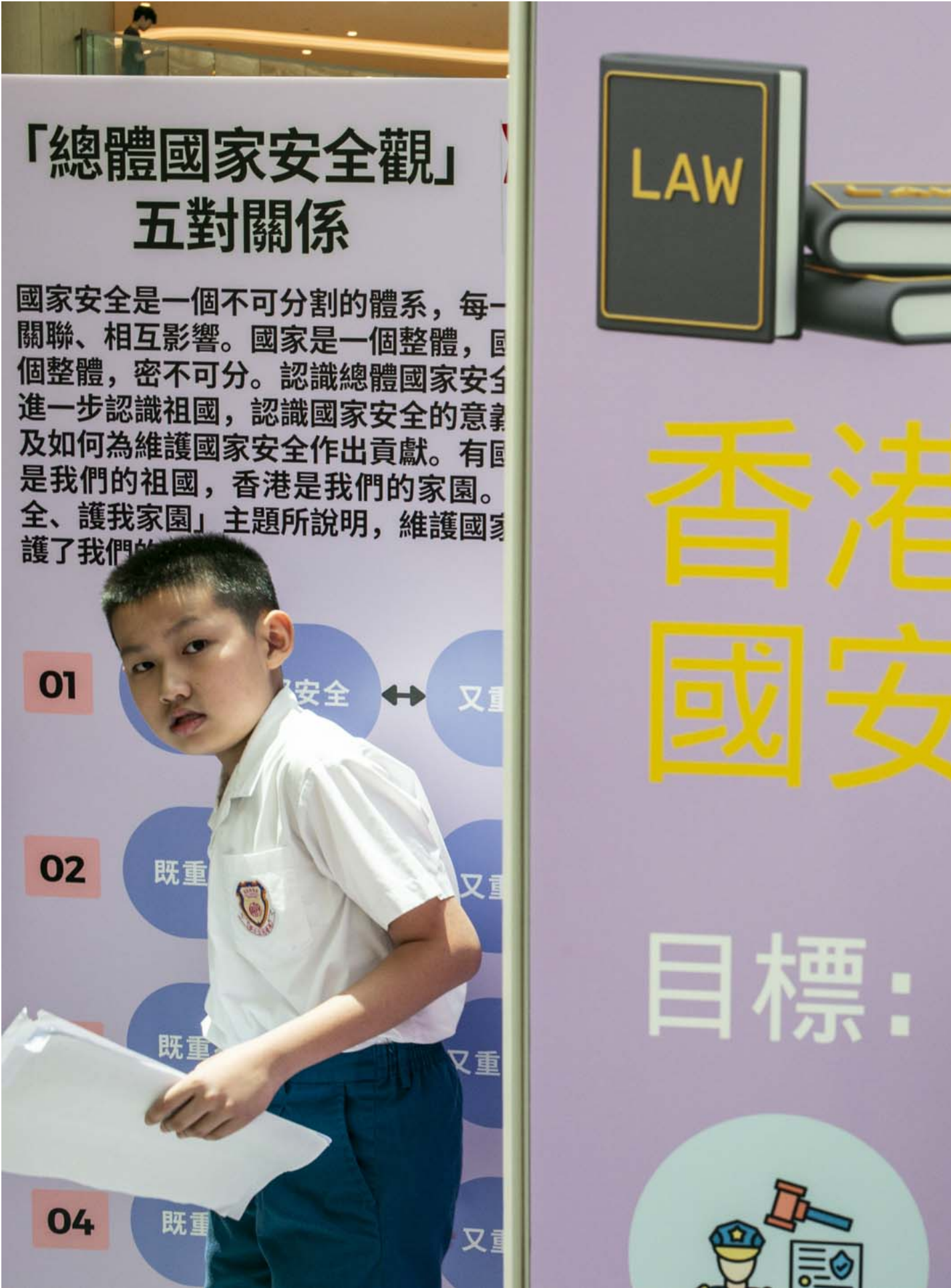
2024年4月13日，“国安•保良•将军澳”活动在将军澳新都城中心举行，有展览，摊位游戏和综艺表演。