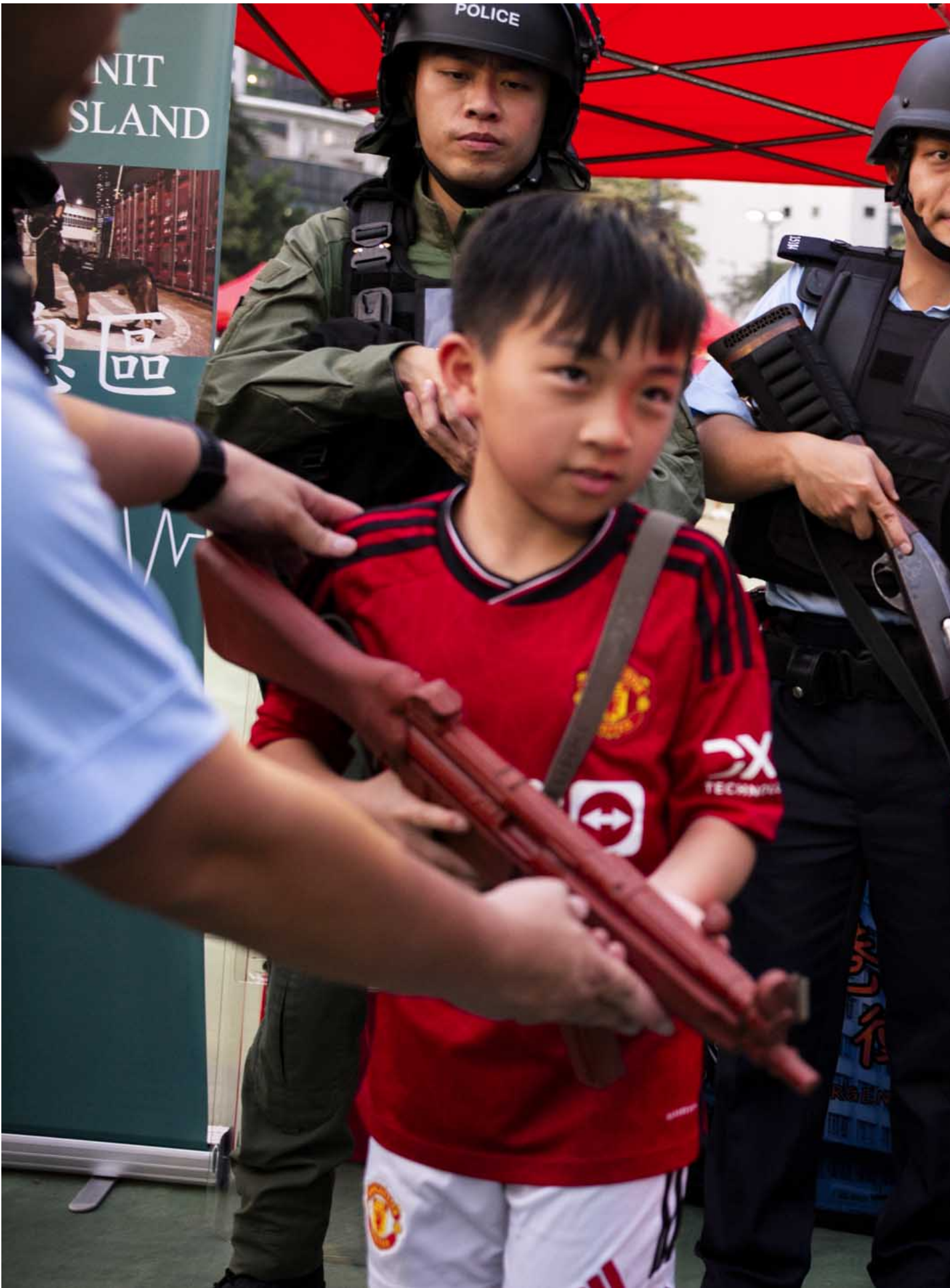
2024年4月15日，全民国家安全教育日嘉年华在维园举行，有国安知识展板及国安教育摊位游戏、香港警务处反恐装备展示、新兴运动体验等活动。

孩童和学生是国安教育的重点对象。在不同活动现场，青少年常是现场最大群体，除了学校组织，也有不少家长带上小朋友参与。地区活动中，中老年街坊也是参与主力，相较之下，青年群体的身影则显得稀疏。