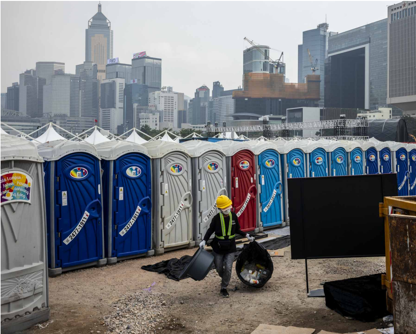
2023年12月4日，中环海滨活动空间的清洁工人。

香港好像在面对一种角色上的转移，从中西交汇点、“亚洲金融中心”，变“中国的金融中心”。