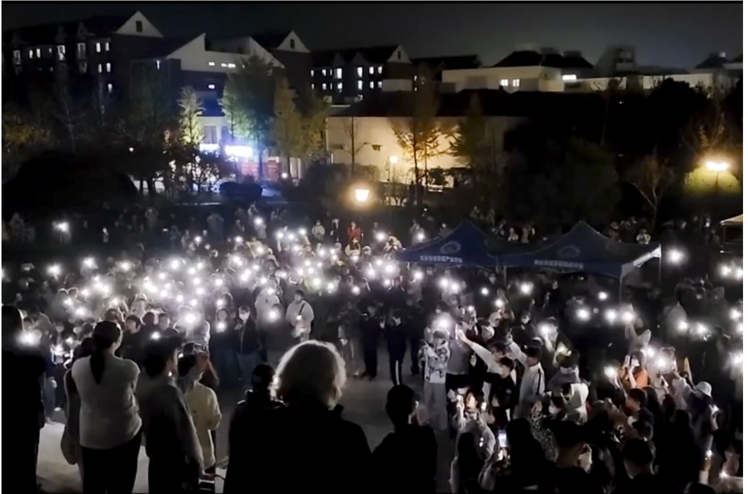
2022年11月26日晚上，大批南京传媒学院学生在校园钟楼前聚集，手举白纸、打开手机闪光灯集会，纪念在新疆乌鲁木齐大火中遇难的民众。影片截图