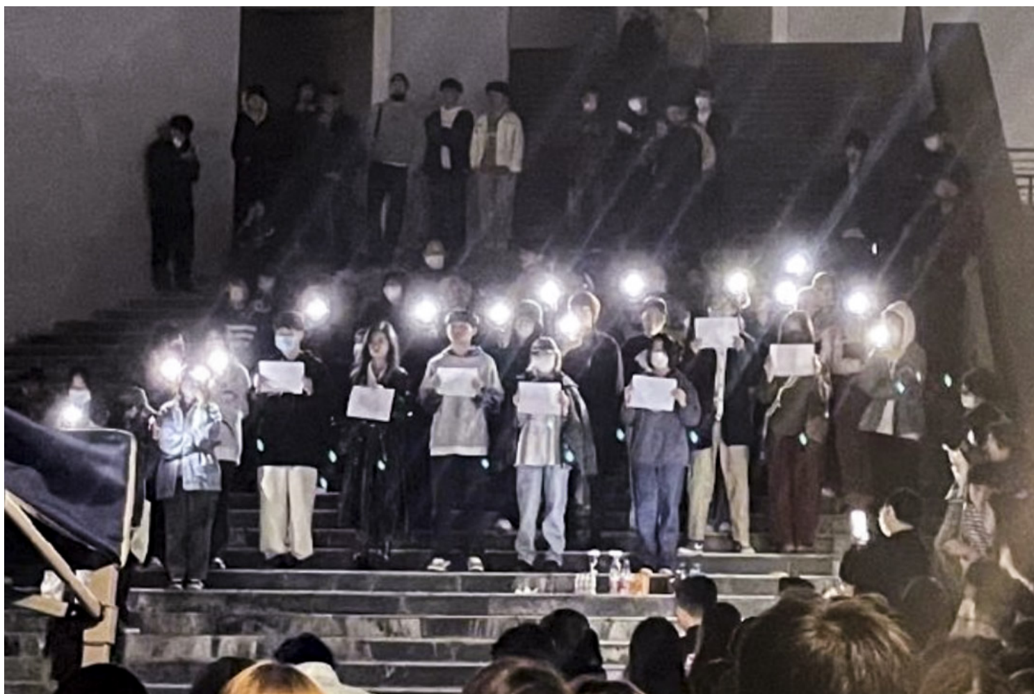
2022年11月26日晚上，大批南京传媒学院学生在校园钟楼前聚集，手举白纸、打开手机闪光灯集会，纪念在新疆乌鲁木齐大火中遇难的民众。

后来这名校长向学生喊话：“你们总有一天会为你们今天所做的一切付出代价”，现场马上有学生接，“中国要为这一切付出代价”。有自称在抗议现场的学生披露，当校长质问学生敢不敢说出来自己的名字时，“一个女生大声说出来了，所有人都在喊自己的名字”。