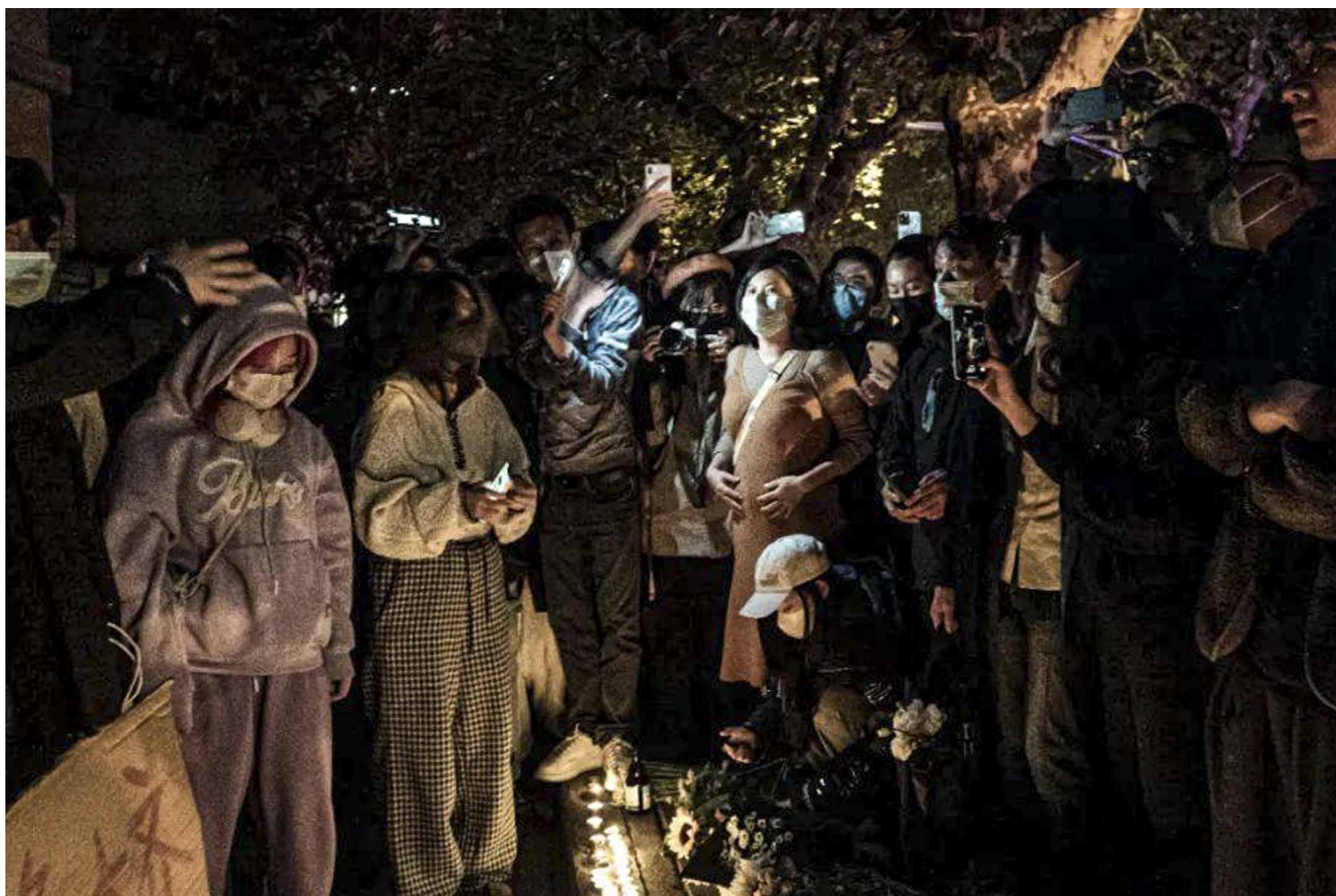
2022年11月26日深夜，上海乌鲁木齐中路聚集大量市民，悼念11.24乌鲁木齐火灾10位逝者，有人人们在街道上点燃蜡烛，献上鲜花。网上图片

事件结束后，相关影片和视讯资料被新浪微博迅速屏蔽，但关注此事的微博用户依然在隐晦地讨论并希望被抓捕的悼念者们平安，“他们有了血腥镇压的借口了，现在真的好担心”，也有部分用户认为这样的行为并不理智“这样的抗议方式是完全无效的，失去了原本的意义”，遭到了其他用户的激烈回应，“这个没意义那个没意义，那怎么办？继续跪着？”社群媒体平台Mastodon上亦有用户讨论，“表达对上街抗议和以其他各种形式勇敢抗争的同胞们的关心和担心，应当永远是以实际支持他们为基础的，是‘你们好样的，千万要保重安全，我祝福你们，支持你们，我和你们在一起’，而不是上来就‘这样没用、这样多危险呀’”，“去你的吧，咱们没去、咱没人家那么勇敢，就别在家点评数落真正走上街头的人，说没用那还是说这种话的人更没用”