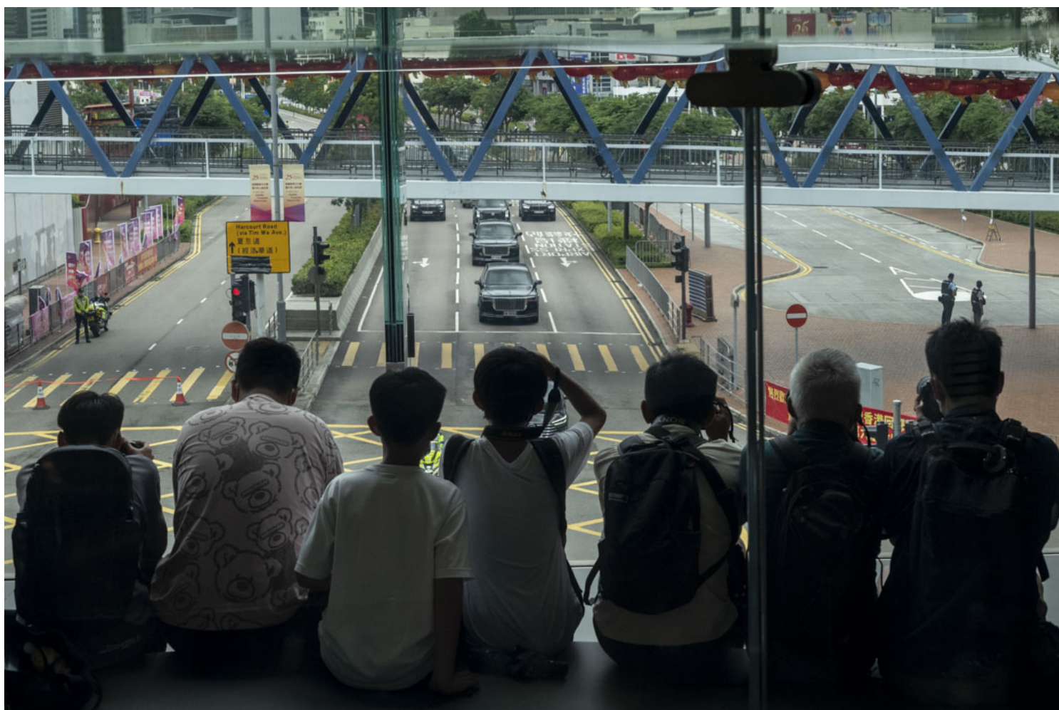
2022年7月1日，市民于IFC苹果店透过玻璃窗观看国家主席习近平的车队。

举行回归活动的金紫荆广场和会议展览中心，警方更呈高度戒备状态。会展站一早关闭，警方出动配备多孔发射器的“剑齿虎”装甲车巡逻；另外需要进入核心保安区或会展的人士，必须经安检和核实身份。