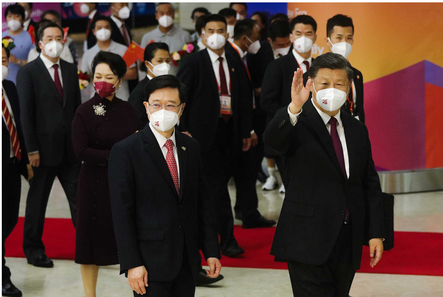
2022年7月1日，中国国家主席习近平(右)和新任特首李家超(左)出席香港回归祖国25周年庆典暨第六届香港特区政府就职典礼。