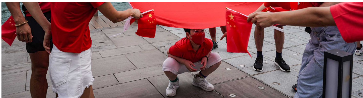
2022年7月1日，市民在湾仔码头海旁展示中国国旗并拍照留念。