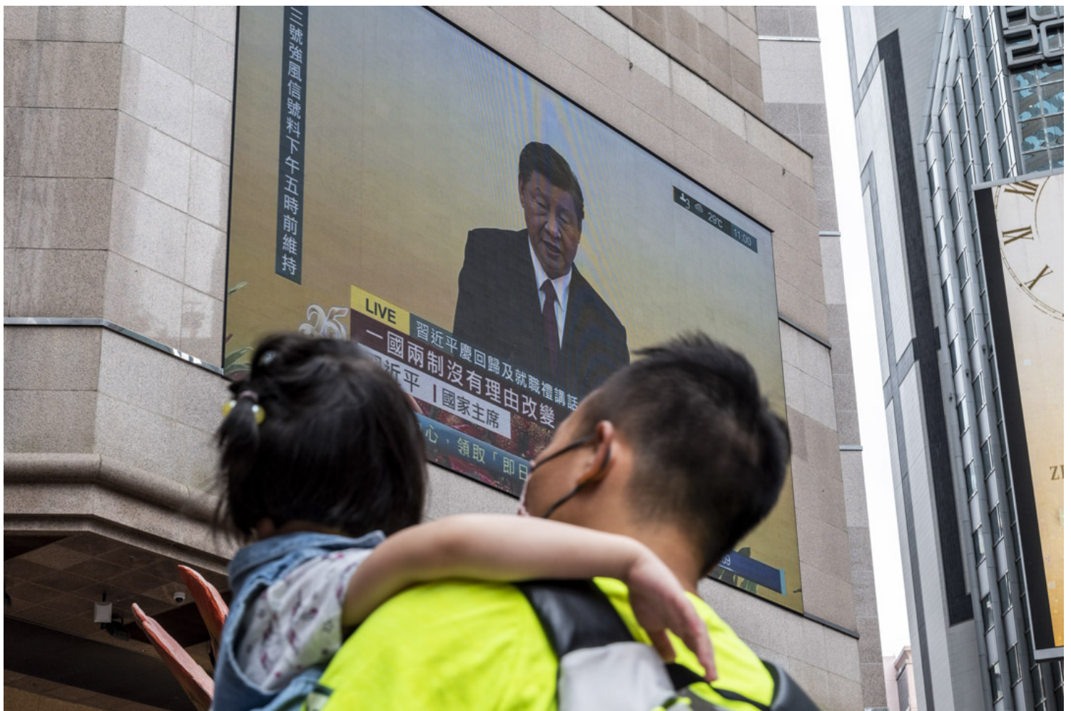
2022年7月1日，时代广场大电视全程直播国家主席习近平于回归25周年的演讲。

“即使我乘港铁回家，也得等多少班列车啊？”容小姐续指，她家住新界东，乘港铁要转乘好几次，全港大塞车的情况下，她萌生先回办公室等人潮散去的念头，“这些情况搭车回家，也会像罐头内的沙甸鱼一样被挤得超辛苦。唉，庆回归啊，我现在就真的超‘燐’（愤怒）了。”容小姐最终屈服，步入撑伞行人群中，以尽早回家为目标。