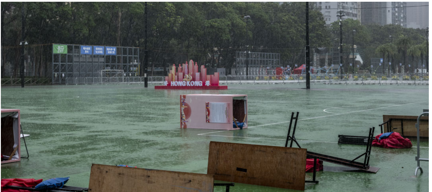
2022年7月1日，香港维多利亚公园的庆回归活动于三号风球下暂停。

在2014年雨伞运动及2019年反修例运动期间为警方执法护航的香港的士司机从业员总会，在6月28日先是安排3队由26辆的士组成的车队在港九新界巡游，之后再出动250辆的士在中环码头列阵，排出“25”字样。香港渔民团体联会亦在同日出动25艘大型渔船在维多利亚港巡游，有市民到码头挥动国旗支持。