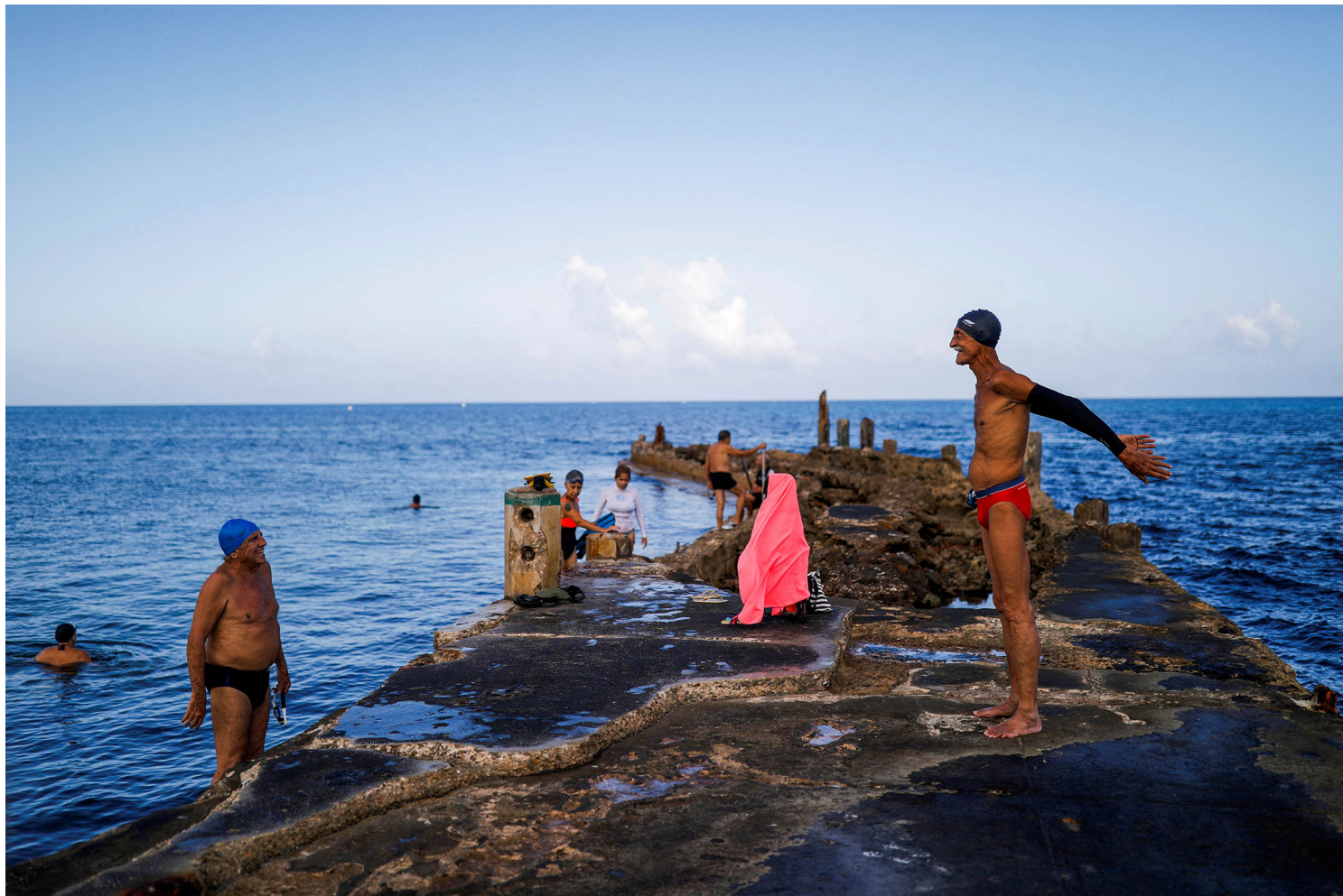
古巴哈瓦那。

将近30个小时漫长而曲折的飞行，我终于到达了纽约肯尼迪国际机场，这是我自疫情大流行以来第三次来这里，春末的纽约仍然不算温暖，一切都像极了北京，偶尔还会下一场雨。我在纽约打完免费的加强针和做完核酸检测之后，也启程前往古巴，开始正式的工作。