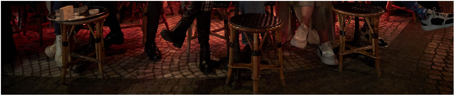
法国巴黎。

身处这样的巴黎，我其实早已忘却疫情的存在。巴黎街头的每个细节都在展示疫情后略带“疯狂”的复苏，已经把过去远远抛开，人们仿佛也不再愿意想起那段日子，用力地参与到热闹之中。对于我来说，不知不觉已经离开中国两个月的时间，可当初离开北京时的情景仍然历历在目。