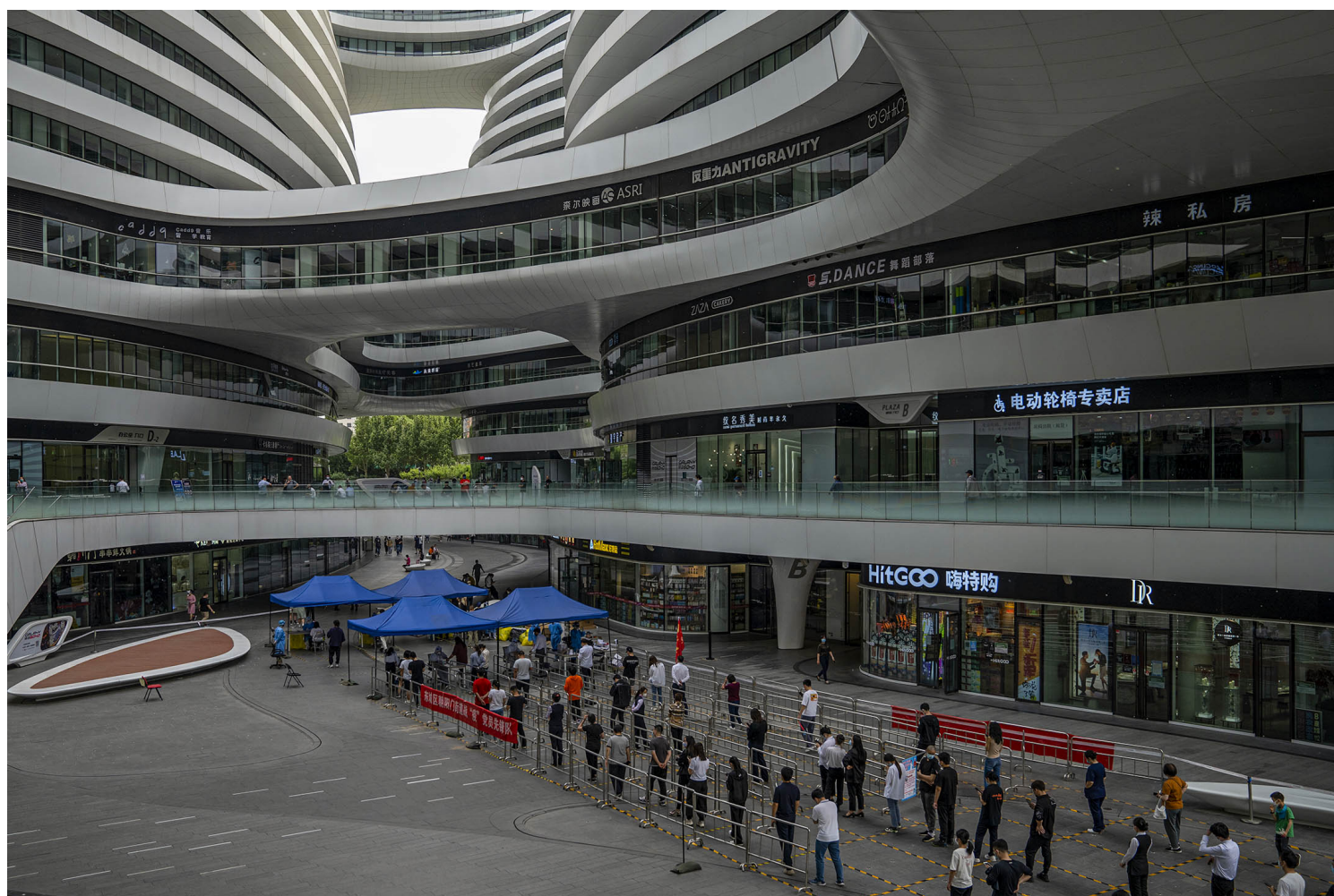
中国北京。

在四月最后一天的夜晚，我背上行李，打车前往首都国际机场T2航站楼。机场高速几乎没有什么车，司机开始与我闲聊，他说这几天来我是他第一个去机场的单子。他好奇地问我此时还能去哪里，离开北京是不是很方便，到了当地是不是要隔离。我回答说，我是国际航班，这次是出国。这句话让车内变得沉默了下来，过了许久，司机才问了我一句，出国了需要隔离吗？我说不需要的，司机有气无力地说了一句“挺好”。