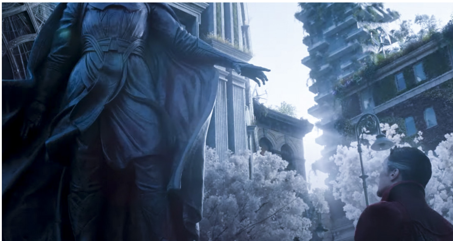
《奇异博士 2：失控多重宇宙》（Doctor Strange in the Multiverse of Madness）剧照。网上图片