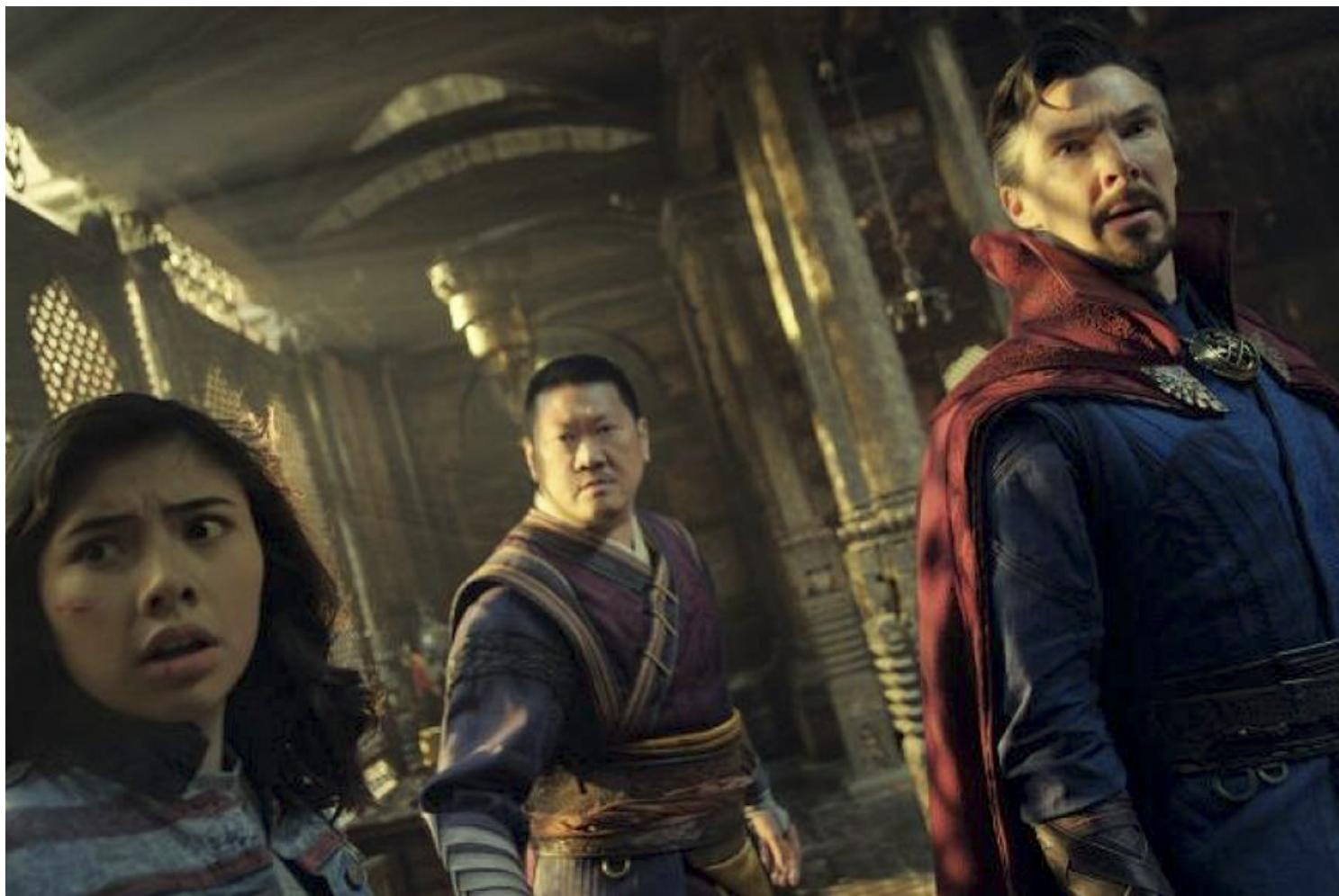
《奇异博士 2：失控多重宇宙》（Doctor Strange in the Multiverse of Madness）剧照。

漫威宇宙在第三阶段的尾声，借由《复仇者联盟：终局之战》（Avengers: Endgame）正式导入了多重宇宙的存在，紧接著透过《洛基》（Loki）、《无限可能：假如...？》（What If...?）两部 Disney+ 影集，以及引发全球粉丝欢声雷动的《蜘蛛人：无家日》（Spider-Man: No Way Home），而开枝散叶，分头深化多重时间线的多重可能性——也是这段期间，索尼影业跟著祭出了《蜘蛛人：新宇宙》（Spider-Man: Into the Spider-Verse）加入战局。最新接档的《奇异博士 2：失控多重宇宙》（Doctor Strange in the Multiverse of Madness，港译“奇异博士2：失控多元宇宙”，陆译“奇异博士2：失控多元宇宙”）也以此为目标，继续从相同题目中取材。