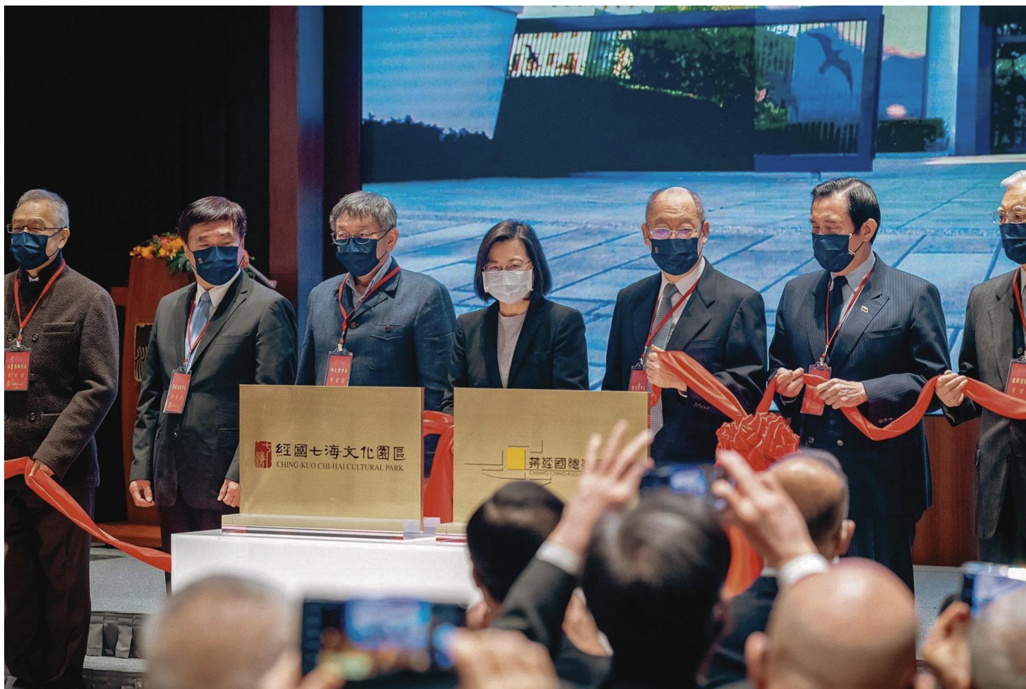
台湾总统蔡英文出席“经国七海文化园区”开幕典礼。