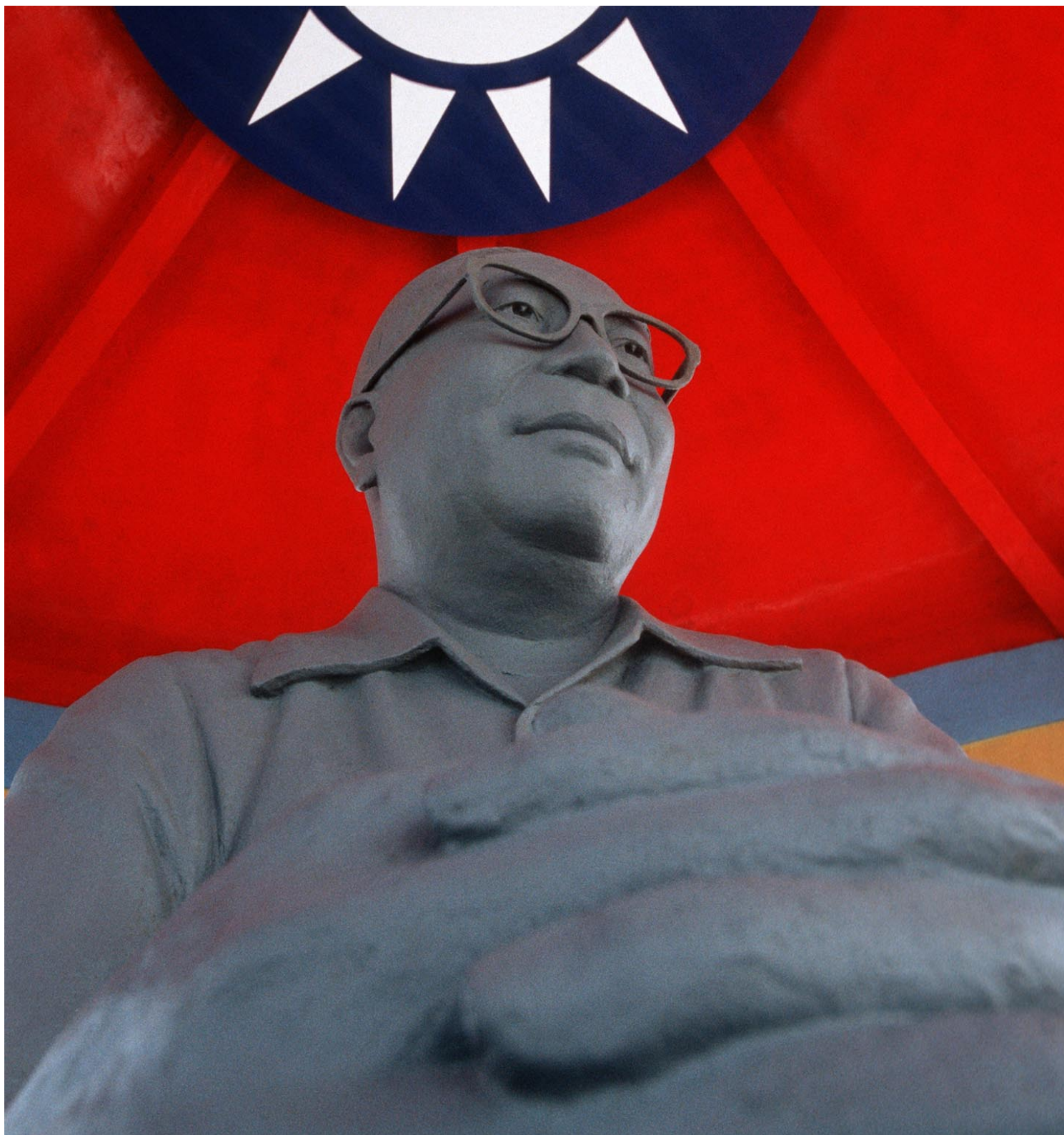
2003年7月1日，台湾马祖上的蒋经国雕像。