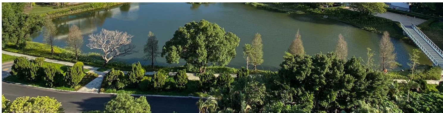
经国七海文化园区。