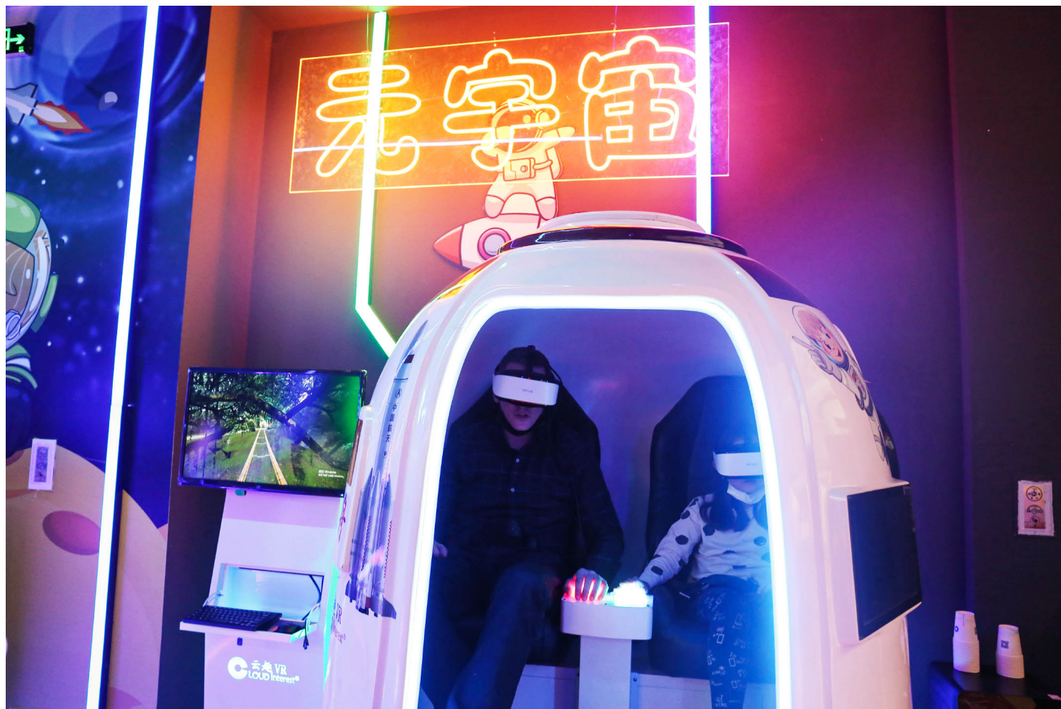
2021年12月22日上海的购物中心开幕式上，VR科技博物馆的元界概念吸引市民参观。