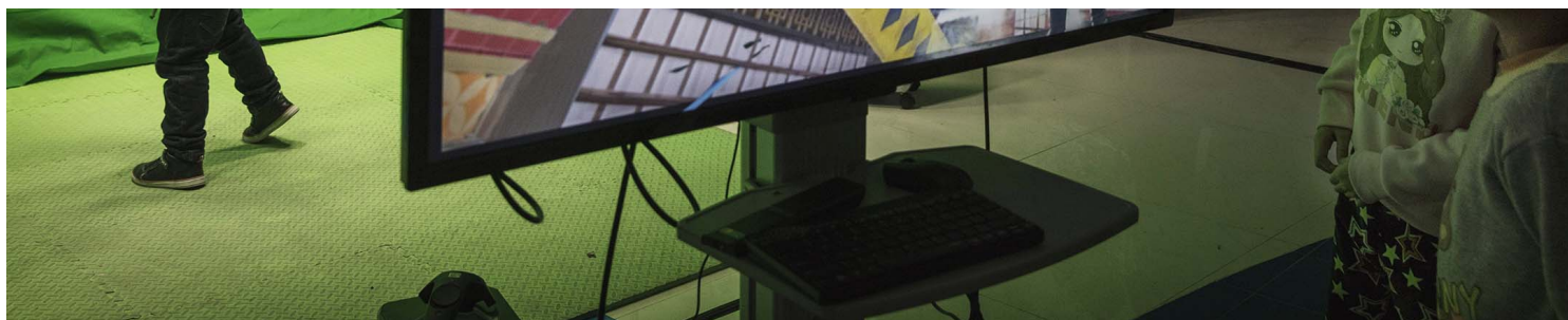
2016年11月27日北京，一名男孩在一个VR公园玩游戏时戴著虚拟现实眼镜。

科幻小说家属于过去的未来。我们编织最好的未来，也编织最坏的未来。虚构于我们是游戏，是思想实验，是精神力的锻炼，在创作一种可能性的同时，希望和同样身在当下的人们一起清除迷障。我们未来器官的分泌物不应为商业巨头们服务，用来吸金或技术垄断，或作麻醉剂。