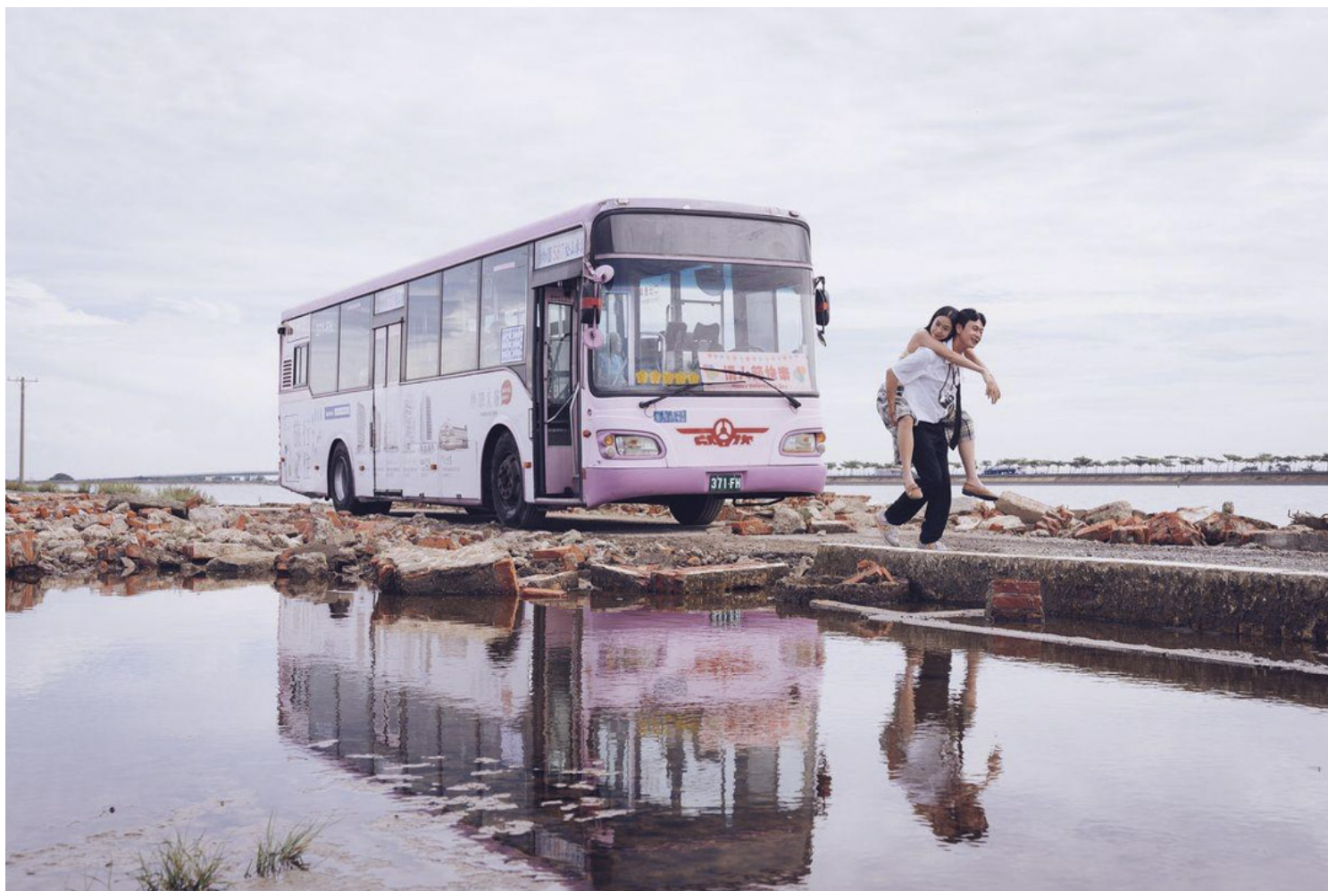
《消失的情人节》剧照。

“就包括好莱坞，因为他们的配乐量是很夸张的，可能电影的一部分，会到七八十首，但原声带里面，就是收录了十几二十首；又或者我们在原声带中听到的，跟片中配乐不太一样，因为他们在录制配乐的同时，已经规划好哪个版本哪首曲子应该收录在原声带中，他们一直以来都是这样制作，所以他们的原声带不只是能聆听出一部电影，也能单独当作一张音乐专辑。”