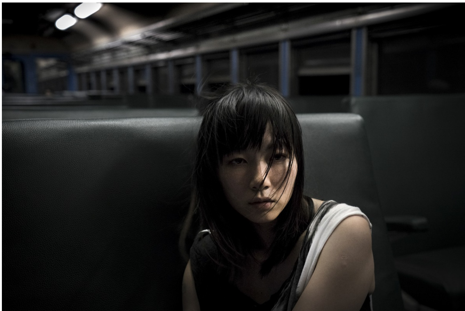
《小美》剧照。网上图片

“《小美》是第一个开工的。但时间上，跟《接线员》差不多，其实有一些重叠，所以我觉得这两部在第一版的demo，还是会希望越深刻越好，想做更为艺术一些，很可能就像你讲的，《棋盘》的色彩会比较浓厚一点。”