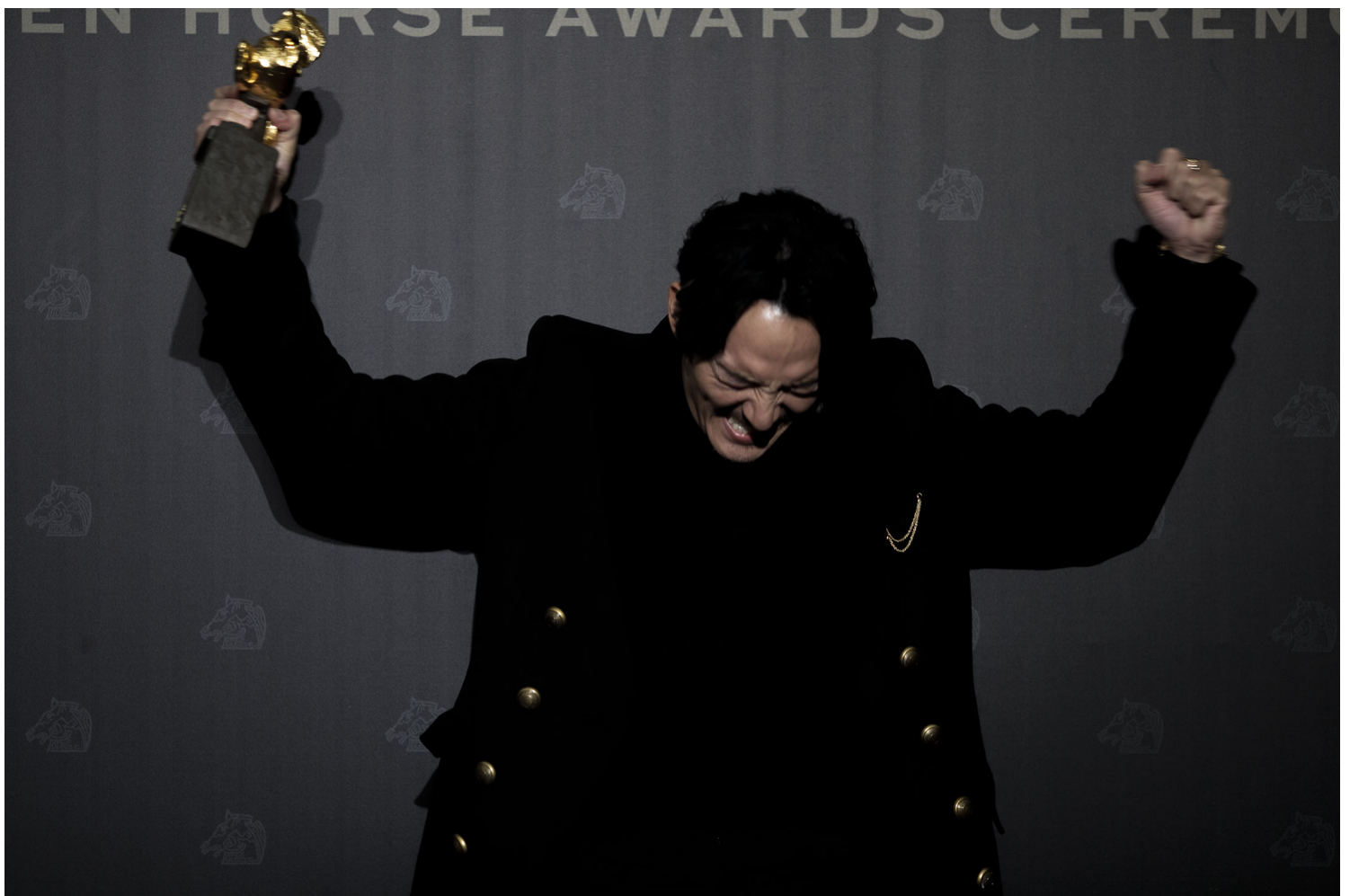
2021年11月27日，张震获第58届金马奖最佳男主角。

《时代革命》以九个章节一步步交代2019年运动各个重要事件的起承转合，香港人的愤怒如何慢慢形成、累积，至最后不惜揽炒。周冠威和其他片段拍摄者如战地记者般窜入每个重要的场域和时刻，将香港人无畏无惧争取民主自由的坚持和决心巨细无遗展示世人眼前。其他未有入围但进入复选的作品，例如在金马影展上放映的纪录片《日常》，跟这场改变香港命运轨迹的社会运动也密不可分，着眼于普过人日常生活如何在无声无色中改变。