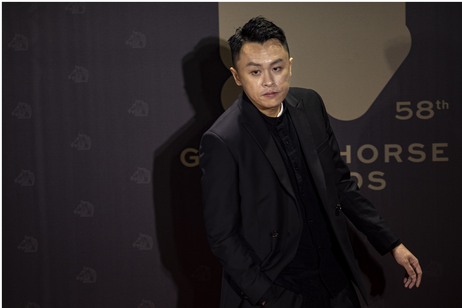
2021年11月27日，《少年》导演任侠。

完成摄制的作品则在议题上更具社会性，关注的面向更多、更深刻，其中不少更直接与香港的社会运动有关。