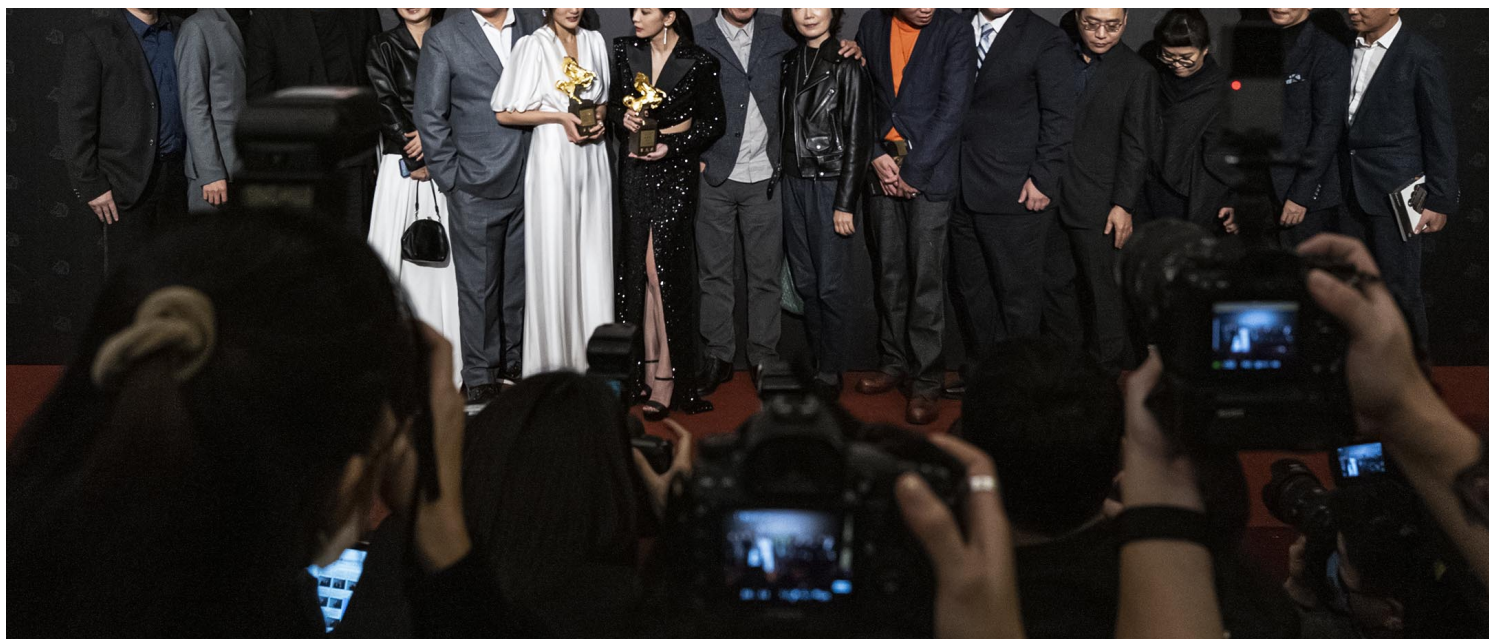
2021年11月27日，《瀑布》获金马奖最佳剧情片。

《瀑布》在意义上较情感偏向个人经历改编的《美国女孩》，在视野和格局上都更大，即使《瀑布》的瑕疵稍多，但它是属于2021年当下这个COVID-19肆虐的大时代。