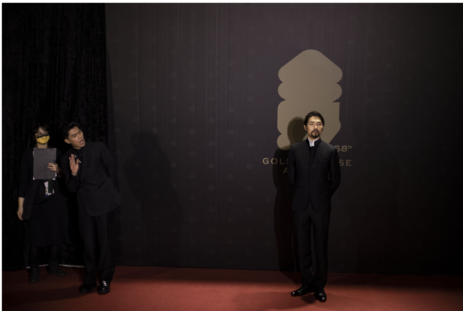
2021年11月27日，香港电影《浊水漂流》获最佳改编剧本奖。