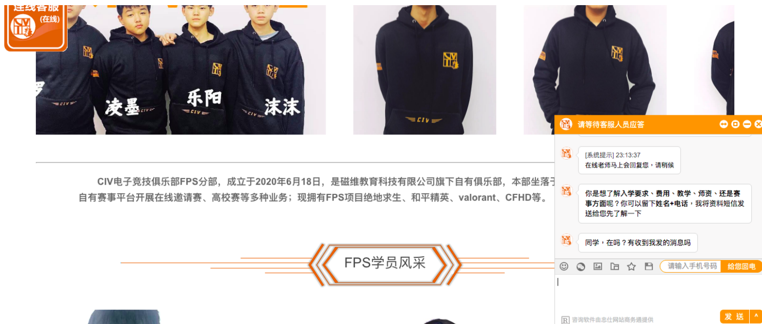
某电竞学校网页上的模范学生页面。网络截图

我假扮学生家长向学校询问个项目，接待我的顾问老师表示，青训队已经不复存在。“国家出台了政策，所有的电竞学校都得跟着政策走。”但她补充会有“技巧技法上的训练”，主要是“看视频复盘”和“学校里小范围对战”。当我问她，作为一个未成年人，孩子每周只能登陆游戏三小时，那么短的时间里他如何能够小范围对战时，她没能给我一个答案，反而给我一个更绝望的“安慰”：