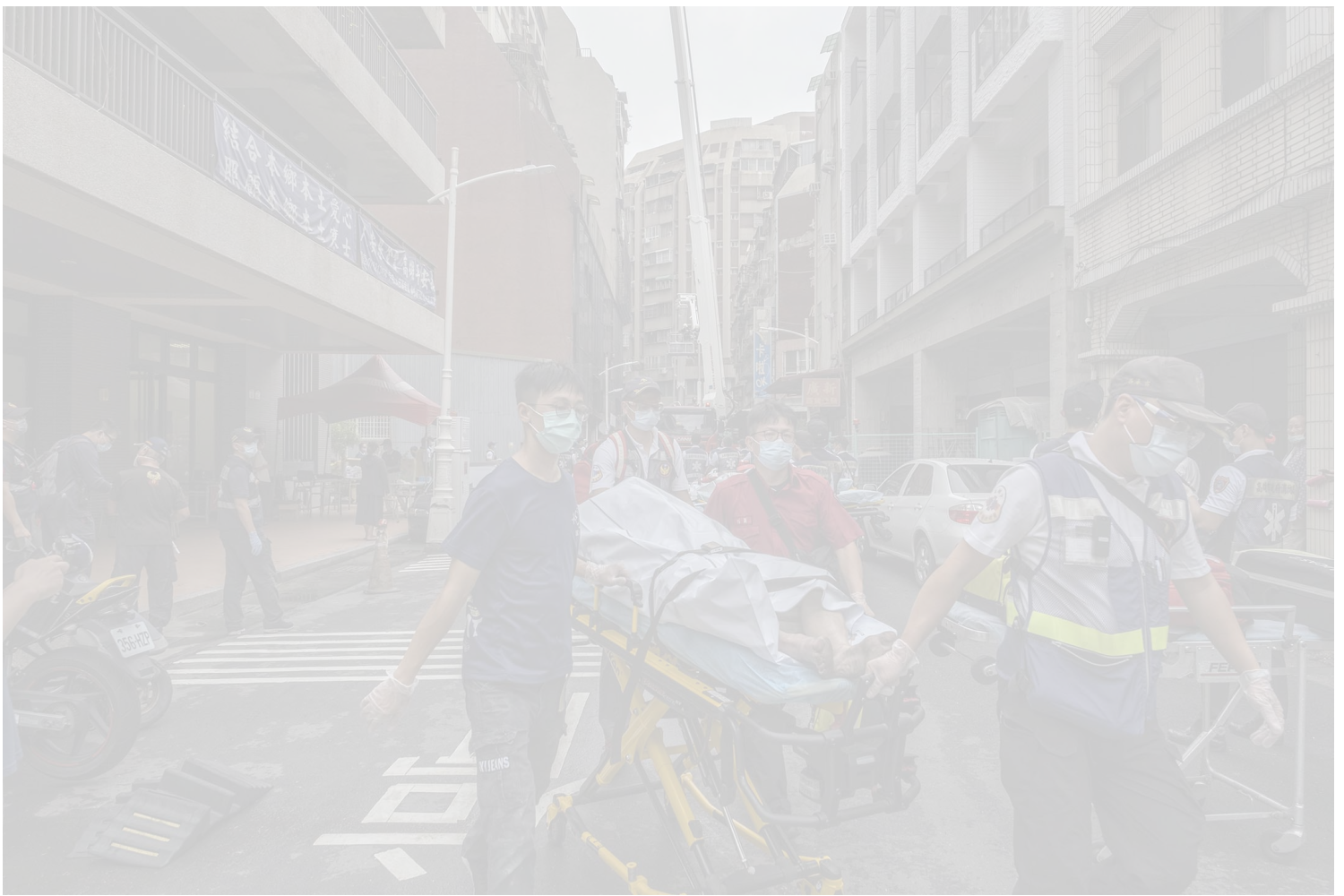
2021年10月14日台灣高雄發生火災後，醫護人員從災場運送一具屍體。

多位高雄市議員在今日議會質詢時指出，鹽埕區有不少老舊大樓，狀況與城中城類似，要求市府盤點老舊社區，加速都市更新計畫。國民黨籍媒體人趙少康則批評，民進黨在高雄長期執政，但高雄的都市更新進度緩慢，認為「民進黨要負全責」。