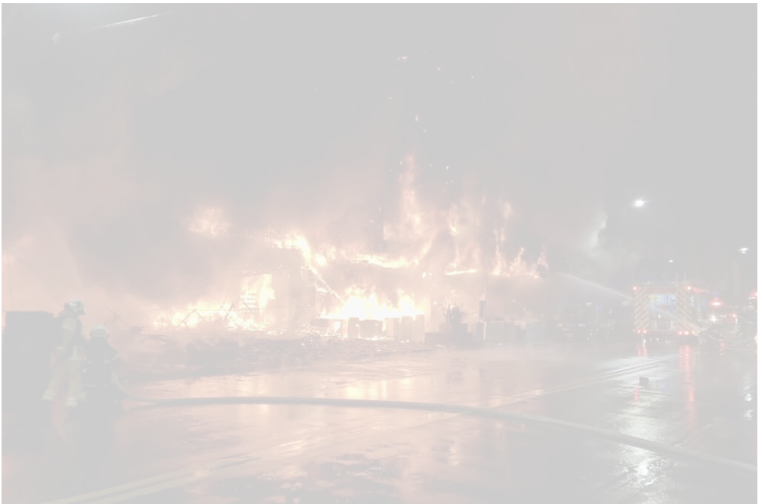
2021年10月14日，台灣高雄鹽埕區「城中城」發生火災。

據中央社報導，火勢主要集中在 1 至 6 樓，而傷亡的住戶則主要集中在 7 樓以上，多半因濃煙嗆傷而喪命。此外，由於起火處騎樓堆放許多雜物，加上該建築屬危老大樓、缺乏管理，救援難度非常高。