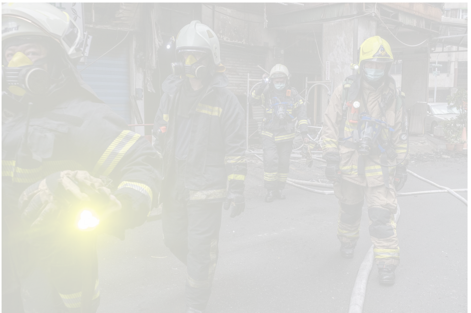
2021年10月14日台灣高雄，火災後消防隊員準備進入大廈。