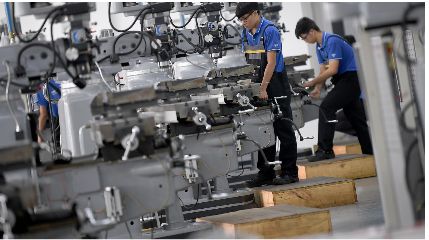
2018年12月6日中国广州，职业培训中心内的学徒。