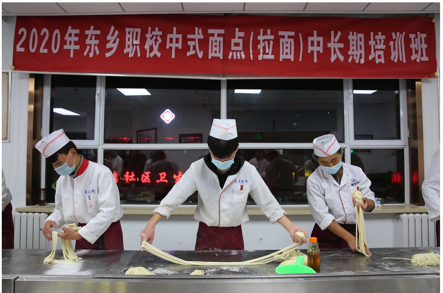
2020年11月12日甘肃省临夏回族自治区，学生在一所职业学校学习。