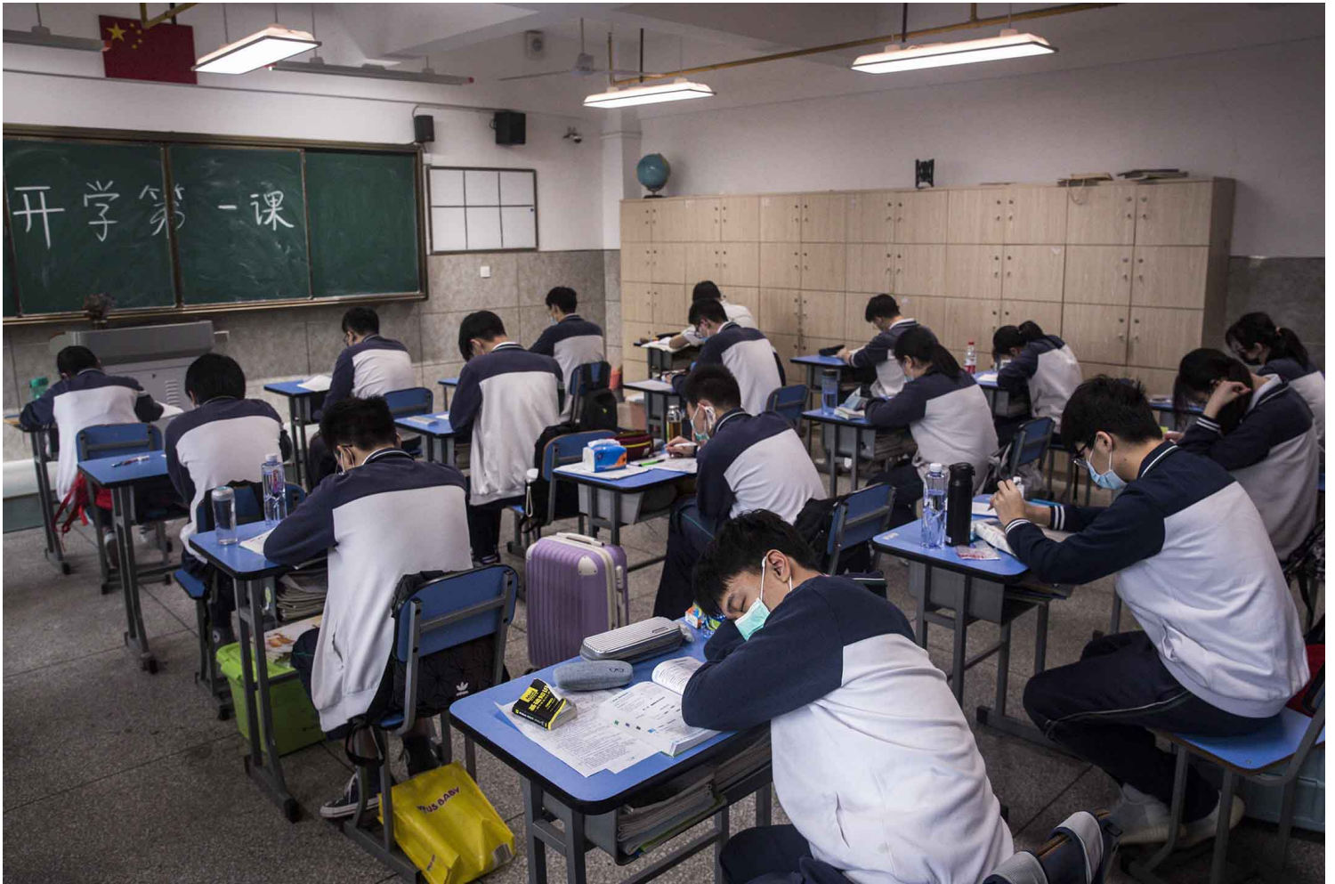
2020年5月6日中国武汉，学生于省武汉市第六中学教室内学习。