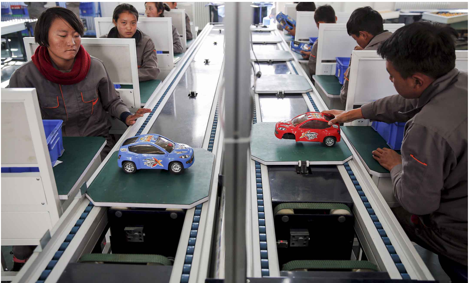
2015年11月19日西藏自治区拉萨市，一群外国记者参观政府组织的一所职业学校，学生们在玩具汽车装配线上工作。