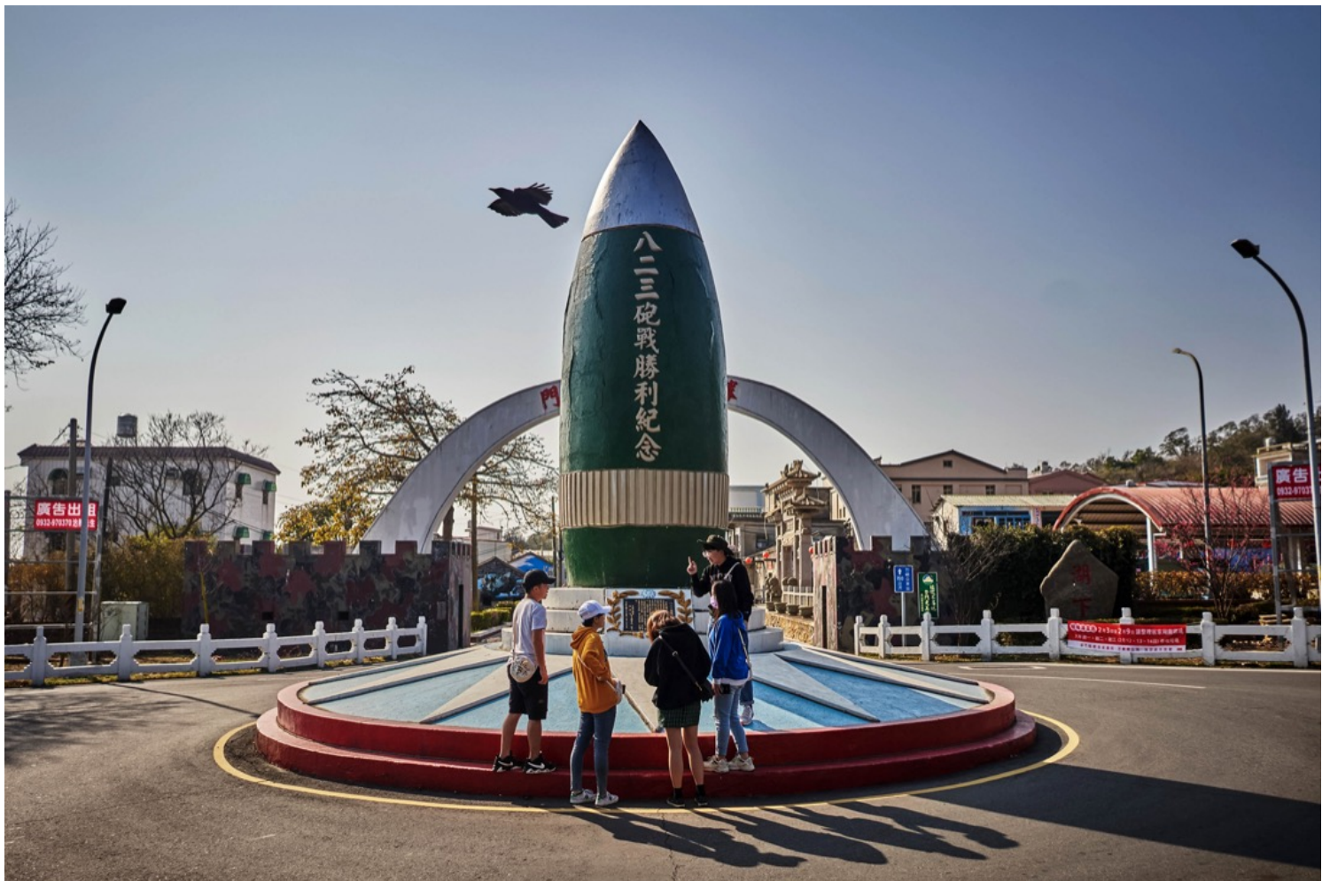
2021年2月4日，台湾金门县烈屿乡，游客在纪念1958年金门八二三炮战中取得胜利的纪念碑前拍照。

吴：简单地讲，毛泽东实际上对收复台湾并不是很重视。毛在1950年宁愿去参加朝鲜战争，也没有借这个机会对台湾采取行动。当然，那个时候人民解放军也没有这个力量，没有海军，基本上也没有空军。毛的时代只是一直在讲“要解放台湾”。