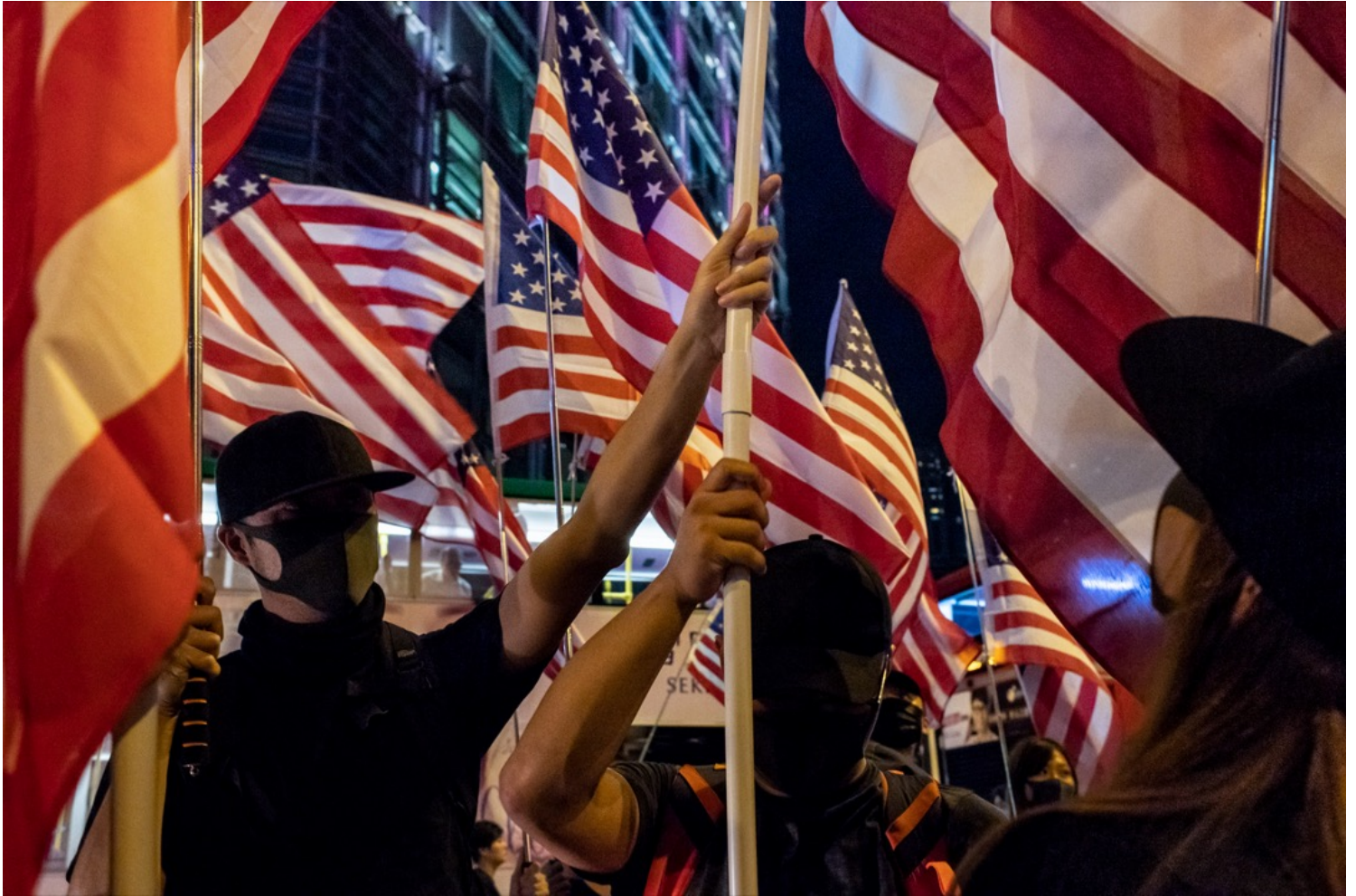
2019年10月14日，香港反修例运动期间，有集会支持美国通过香港人权与民主法，参与者高举美国国旗。

这样来看，你刚才讲到的香港和台湾的问题，特别是中国过去这两年在香港的动作，实际上就是对美国霸权的一个挑战。第一，香港是一个高度国际化的地方，美国有利益在那里，日本有利益在那里，英国就更不用讲了。其次，香港在世界经济体系当中是一个单独的成员，比如它在世界贸易组织里和中国一样是一个独立的成员。第三，香港民众要求能够维持英国殖民地时期以来建立的法治的传统、自由的传统，并且进一步要求民主，这都是与美国的基本价值一致的。中国当然主要就是打压这种对民主的追求，对自由和法治的维护。但是问题在于这个案例比较奇特，因为香港是中华人民共和国主权下的一部分，所以中国的挑战是暧昧的，不能说是直接挑战了某个外国。这不像当年日本袭击珍珠港，那个很明显。对香港这个问题，中国可以讲这是我自己的地方；另一方面，美国人可能也不觉得和他自己有多大的利益关联。这个挑战就显得很小，甚至不被认为是对于美国霸权的挑战。