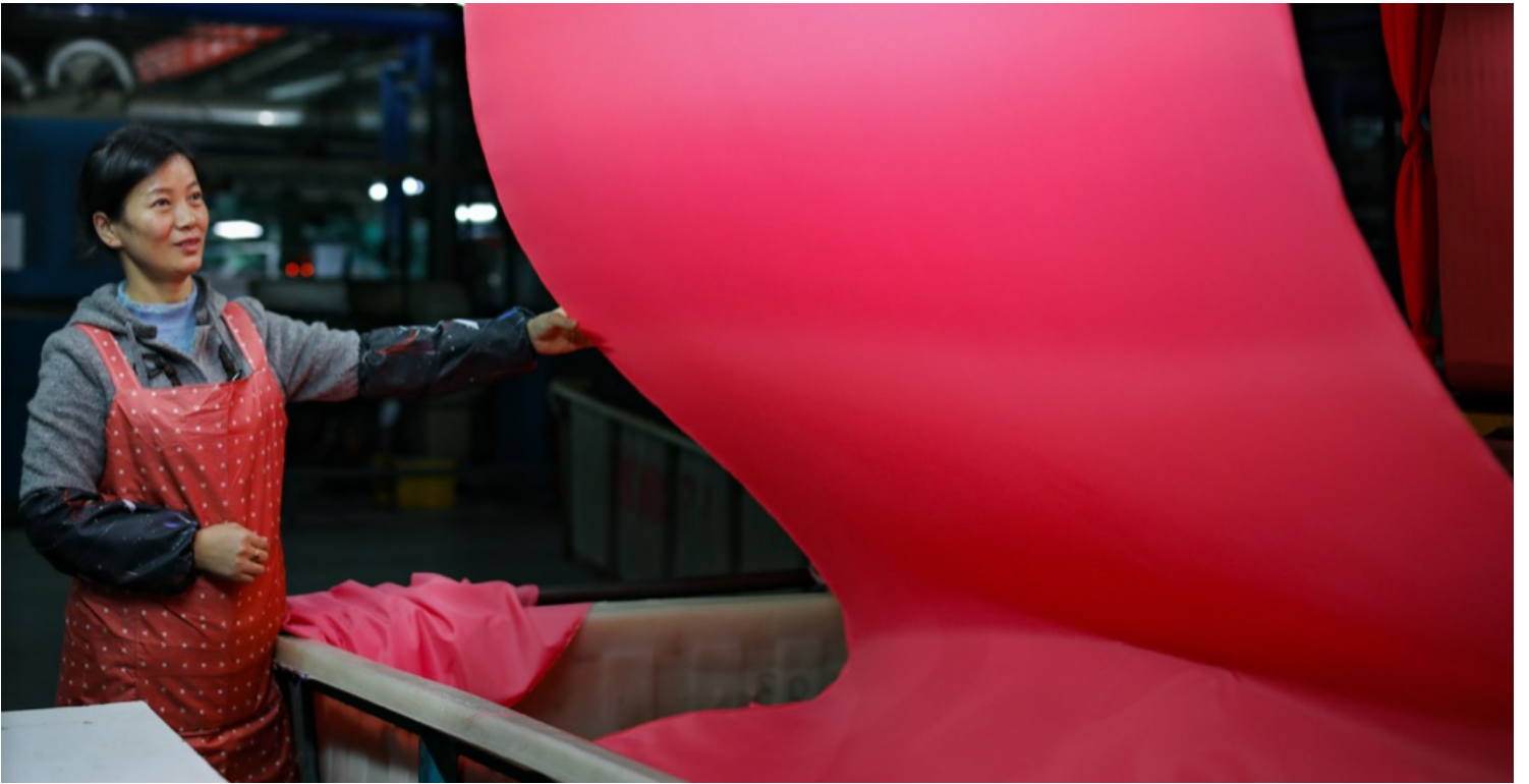
中国江西省万年县，一名女工在纱厂工作。

中国在这方面有野心，最近一些年不断地推广用人民币结算。你会看到，凡是在中国的经济影响相对大一些的国家，比如非洲、甚至东欧一些国家，都在推广使用人民币结算。人民币已经成为世界上最强的四五种货币之一：美元、欧元、英镑、人民币、日元，可能差不多就是这四五种。走到这一步，已经是很快的了。现在，中国还想借助新的货币形式来颠覆美元的霸权地位。中国政府特别重视比特币、虚拟货币之类，他们在这方面下了很大的功夫。