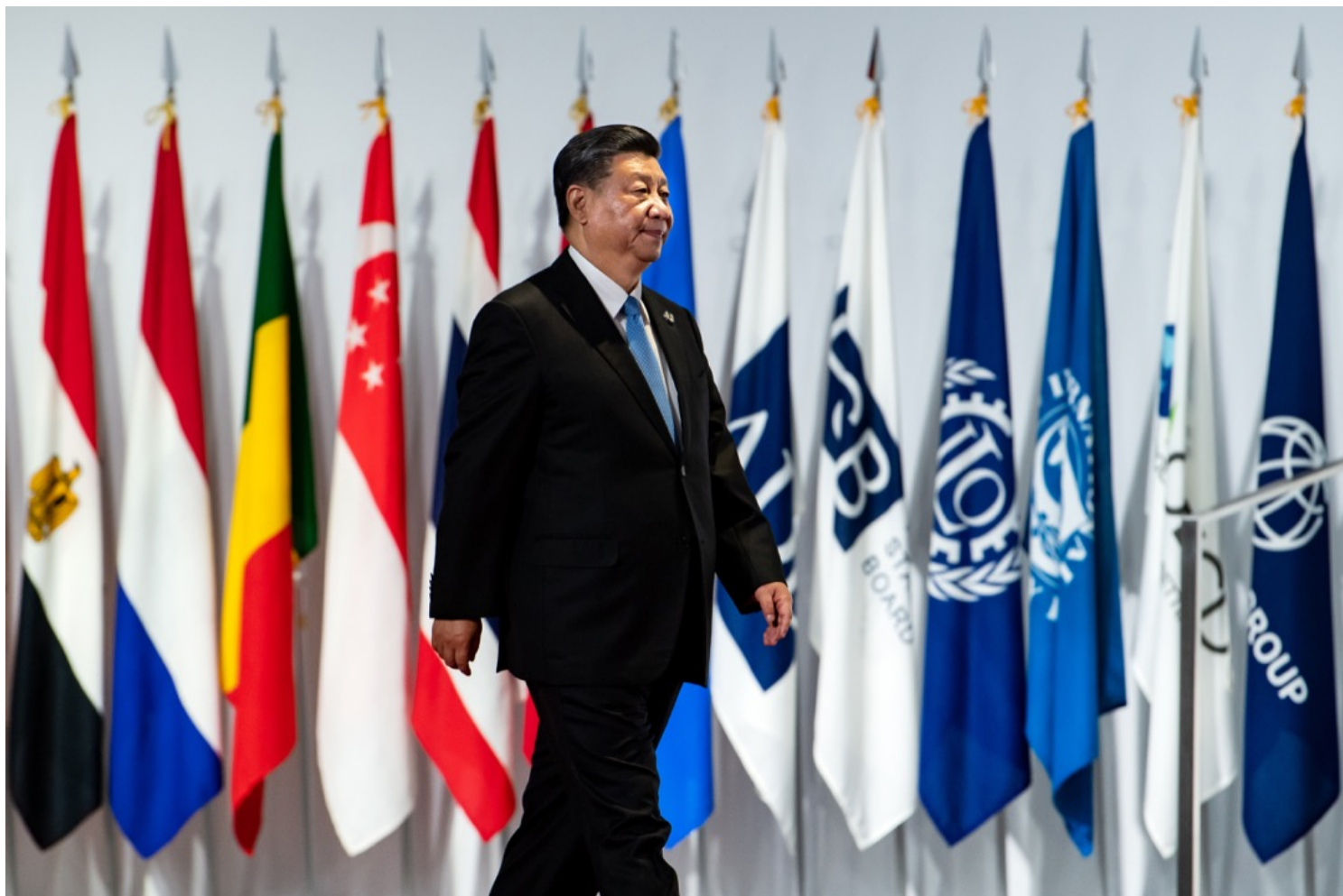
2019年6月28日，中国国家主席习近平出席在日本大阪举行的G20峰会。

何况中国还有一个大外宣体系。美国政府是没有propaganda的，不管他怎么以为美国价值好，都是靠好莱坞等这些东西去传播，美国政府并不直接去传播这种价值。而中国政府是可以用上各种各样的投入来传播中国政府的价值观。这个因素也要考虑。