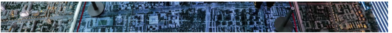
学生参观北京市规划展览馆。

实际上，我觉得，中国现在关于国际秩序的一些想法，和1930年代日本军国主义扩张时所提的一些想法有类似之处，翻译成英文都差不多。日本政府当时讲“大东亚共荣圈”，co-prosperity of East Asia，中国现在是讲 mutual prosperity，也是强调共享经济繁荣，试图用物质的利益让其他一些国家附属于中国。当然，与当年的日本不同，我很难想像中国今天或明天会使用军事力量来占领某些国家，由此拓展自己的影响。对于香港、台湾，还有中国宣称拥有主权的争议性领土，它很可能在条件可能的时候使用武力来占领。但是，我很难想像它会使用军事力量直接占领韩半岛或东南亚。