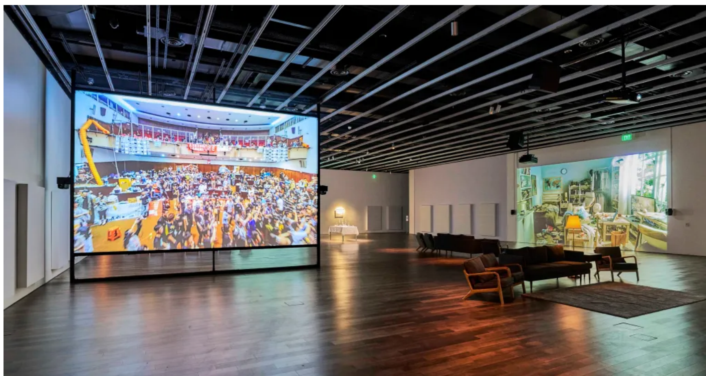
Asian Art Museum

兩件作品呈現在獨立展牆的正反兩面，彼此相似的空拍、廣角、對稱構圖與所呈現的空蕩的主幹道和立法院，加之反抗與避險的雙重元素，不難讓人聯想到寇德卡鏡頭下1968年的布拉格幾近無人的Wenceslas廣場。寇德卡的相片中，廣場前景是手腕與手錶，手錶指標所指向原本廣場集會發生的時間，然而居民已提前得知入侵消息，及時撤離了集會廣場。無人的地面上清晰可見重型裝甲車的履帶碾壓留下的痕跡，那是蘇聯軍隊駕駛坦克入侵布拉格的證據。這張照片被認為是歷史上布拉格之春開始的見證，它無聲地、瞭然地控訴著。見證本身也可以是一種力量。