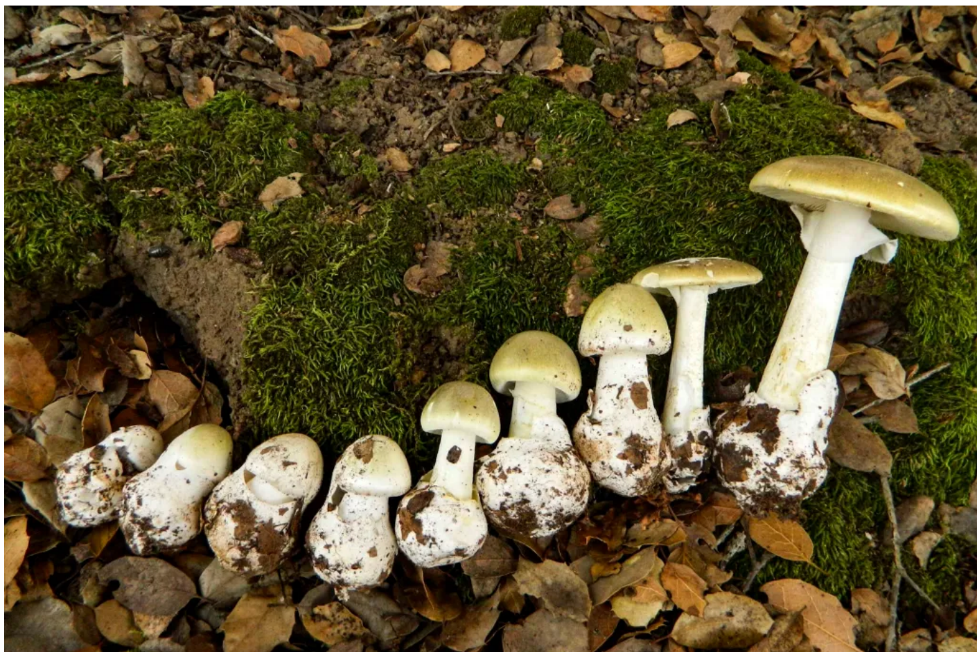
(death cap mushroom)