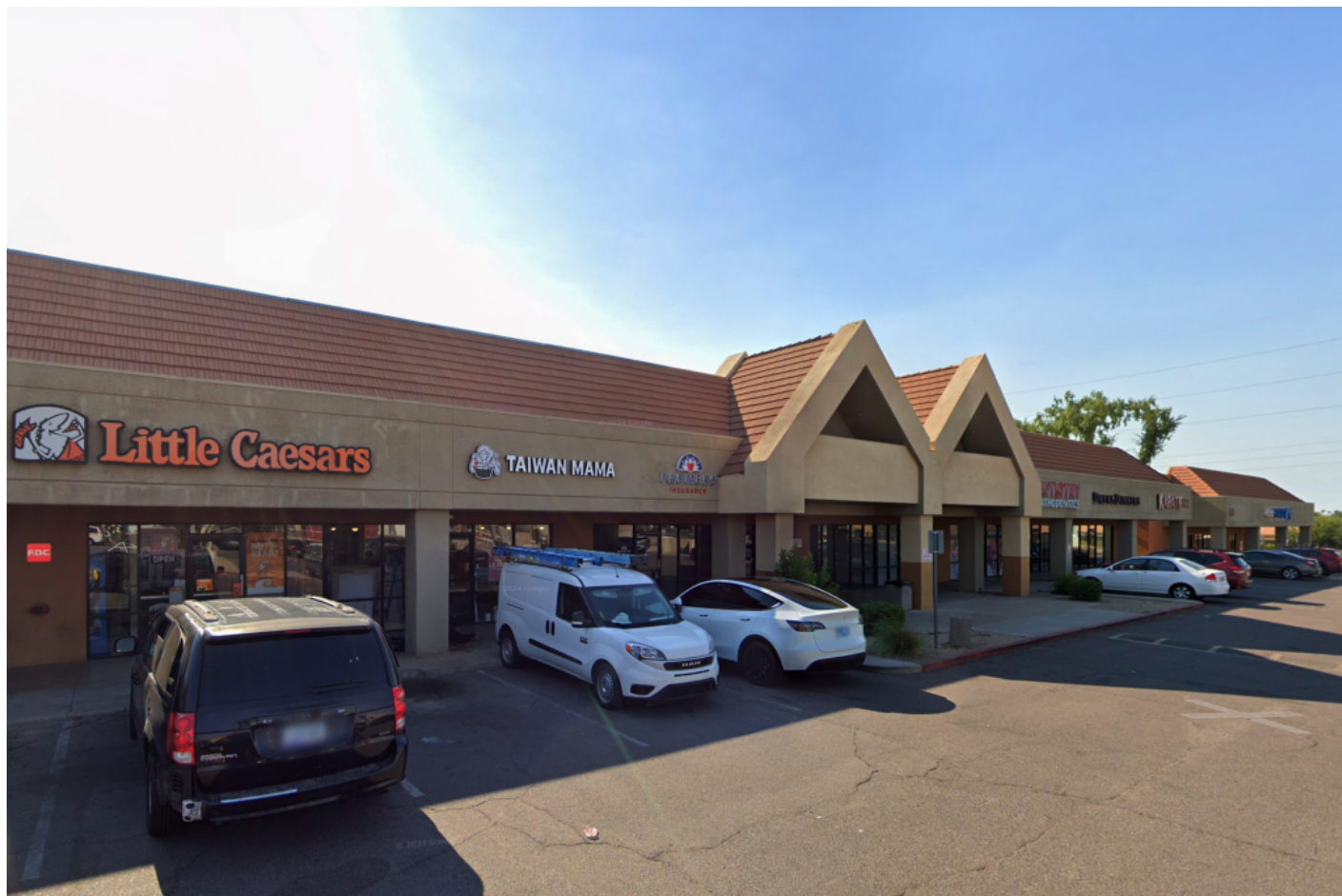
Taiwan Mama Google Map