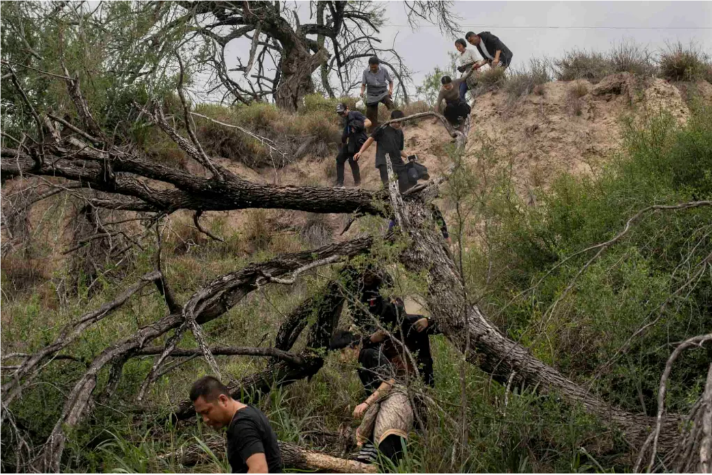
2023 4 5

攝影師於大地震發生後趕付現場，拍攝震後市中心及山泥坍方的情況，紀錄自然災害的地景，也捕捉了災民的脆弱與彼此之間的關懷，並守候災場目擊動物救援的瞬間，跟進報道猛烈餘震後的花蓮，見證災後復常的面貌。