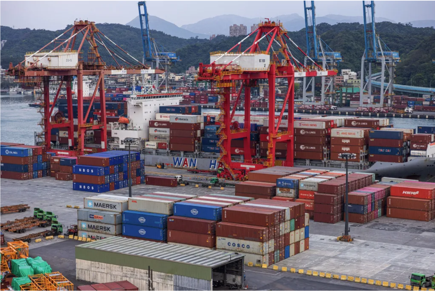
2025 4 4 Annabelle Chih/Getty Images

為因應衝擊，經濟部強調將加速與美方協商降稅，並推動產業中長期轉型，降低對單一市場的依賴。