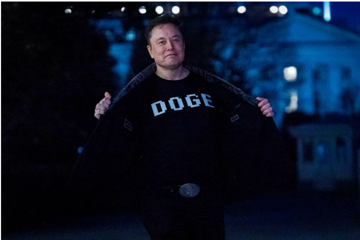
2025 3 9 “DOGE”

長期看來，馬斯克提出的一系列計劃，仍然與特朗普的部分政策綱領衝突，因涉及諸多傷害共和黨核心選民利益的觀點而引發黨派內部人士擔憂。