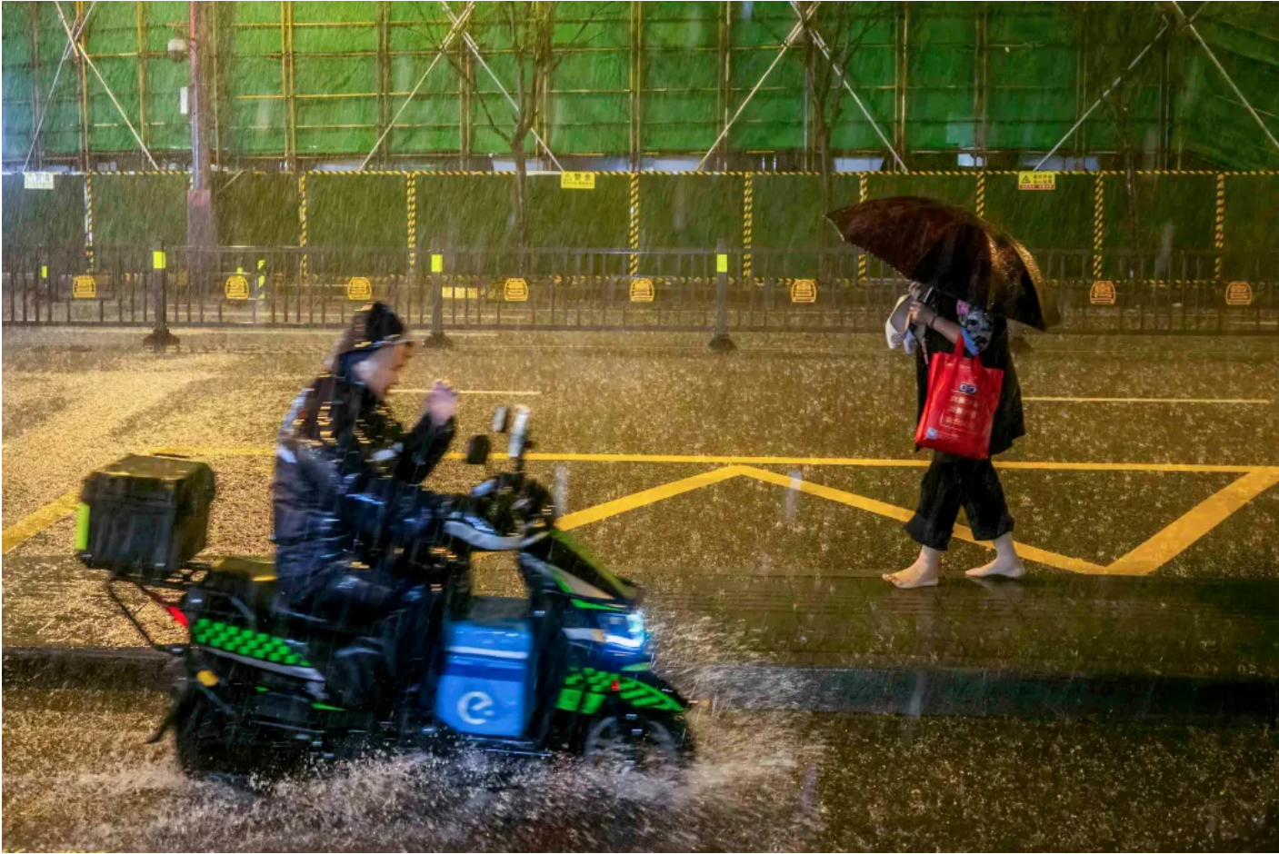
2024 4 2

亦有學者分析認為，目前很難說給騎手繳納社保會導向何種結果，比如，「五險」分為不同領域，騎手或許對醫療保險和工傷保險有需求，但養老保險、生育保險等未知是否會成為他們眼中的負擔。