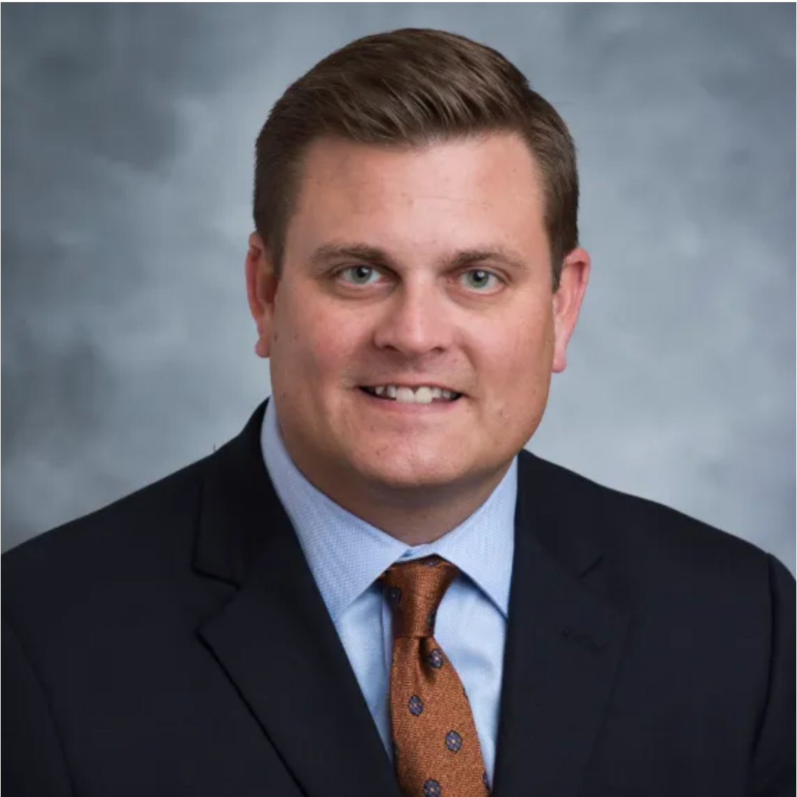
UnitedHealthcare CEO · Brian Thompson

而曼吉奧尼被捕時，警方從他身上搜出一份手寫宣言，裏面充斥着他對美國醫療保險行業的不滿。他痛斥聯合健保的市值一漲再漲，但美國居民的平均壽命卻下降了，稱這些保險公司「濫用我們的國家獲取鉅額利潤」。因此，他要解決這些「寄生蟲」。