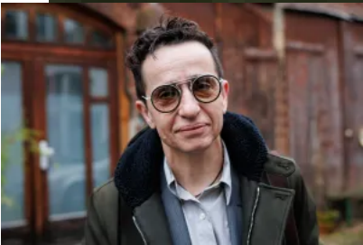
險被刺殺的馮娜·麥蘭妮，和「歷史之外」的大屠殺記憶

聯合國多個特別報告員、獨立專家和工作組聯合曾向 以色列政府發函 ，指出以色列軍隊行為可能構成戰爭罪，要求對事件徹查並追責。