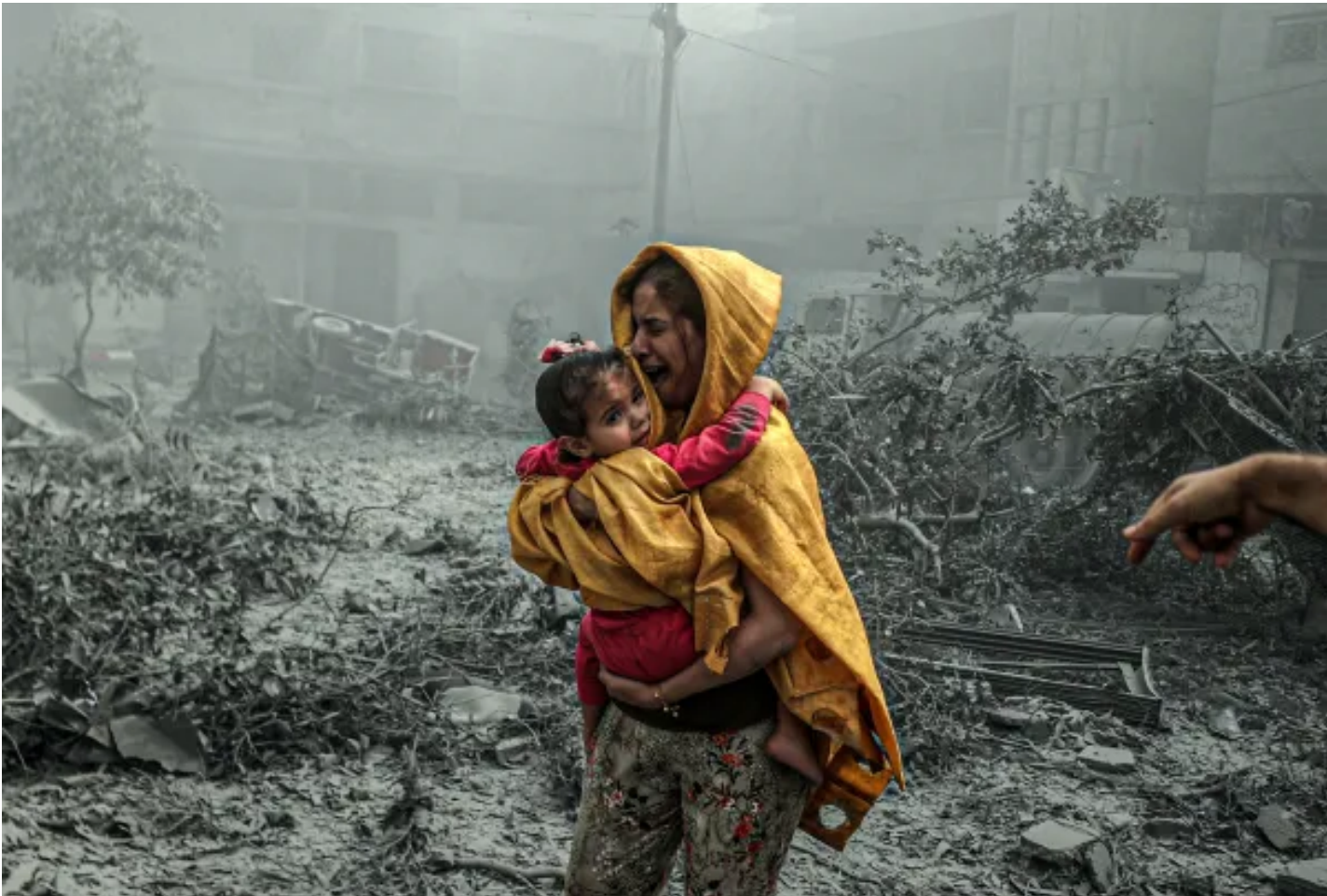
2023年10月23日，加沙，以色列空襲當地，一名女子抱著女孩痛哭。

《柳葉刀》雜誌發表的一項研究估計，如果將間接死亡人數考慮在內，加沙的實際死亡人數可能超過 18.6萬人。