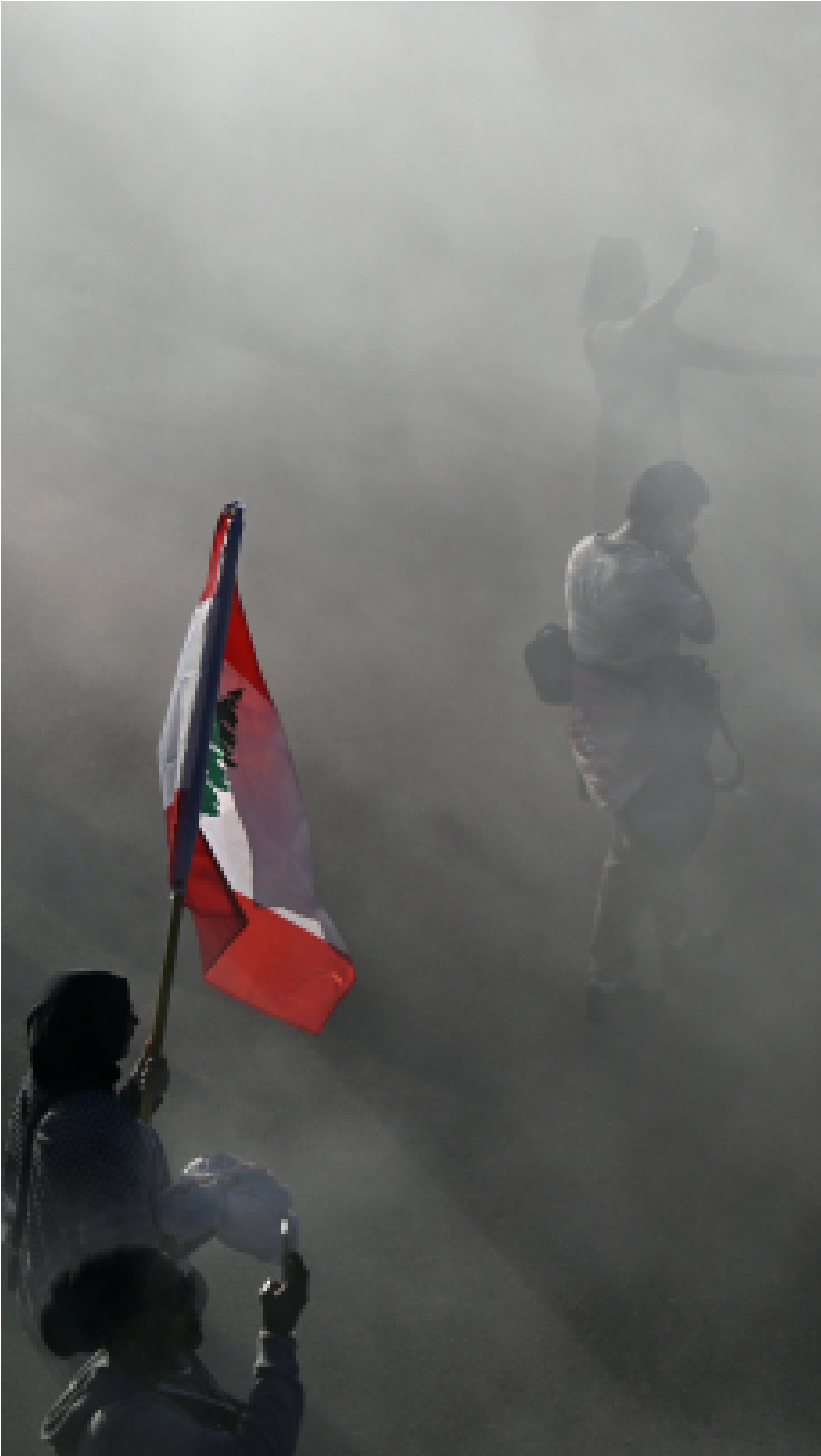
2024年10月5日，加拿大渥太華，以色列對加沙戰爭一週年，親巴勒斯坦示威者在集會上揮舞旗幟。