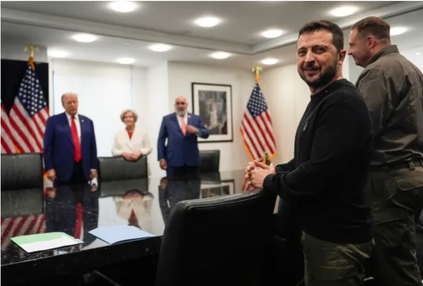
2024年9月27日，美國紐約，烏克蘭總統澤連斯基到特朗普大樓與共和黨總統候選人特朗普會面。

離開真相，談何看見彼此和追求正義？我們的日報、速遞Whatsnew、端聞Podcast能夠保持免費，離不開每一位會員的支持。 暢讀會員首月5折 ， 尊享會員全年85折 ，幫助我們做出更好的即時報導和深度內容。