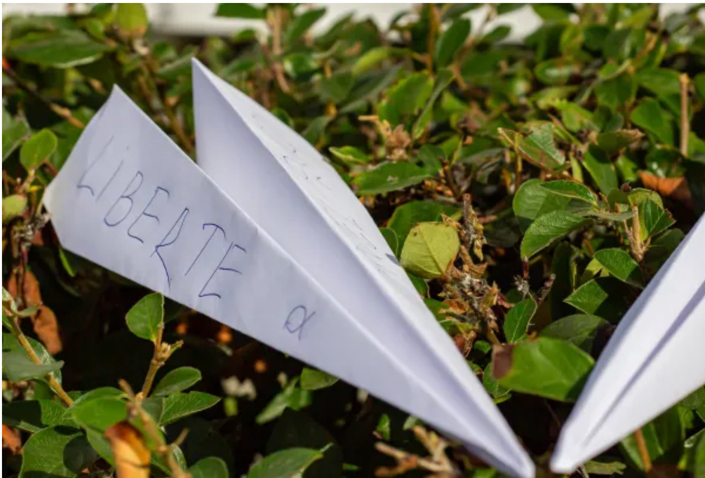
2024年8月26日，俄羅斯，象徵Telegram應用程式的紙飛機放置在法國駐莫斯科大使館前。

Telegram是充斥最多俄羅斯戰爭宣傳的平台，也幾乎是俄羅斯唯一不需要VPN就能傳播反對派信息的平台。