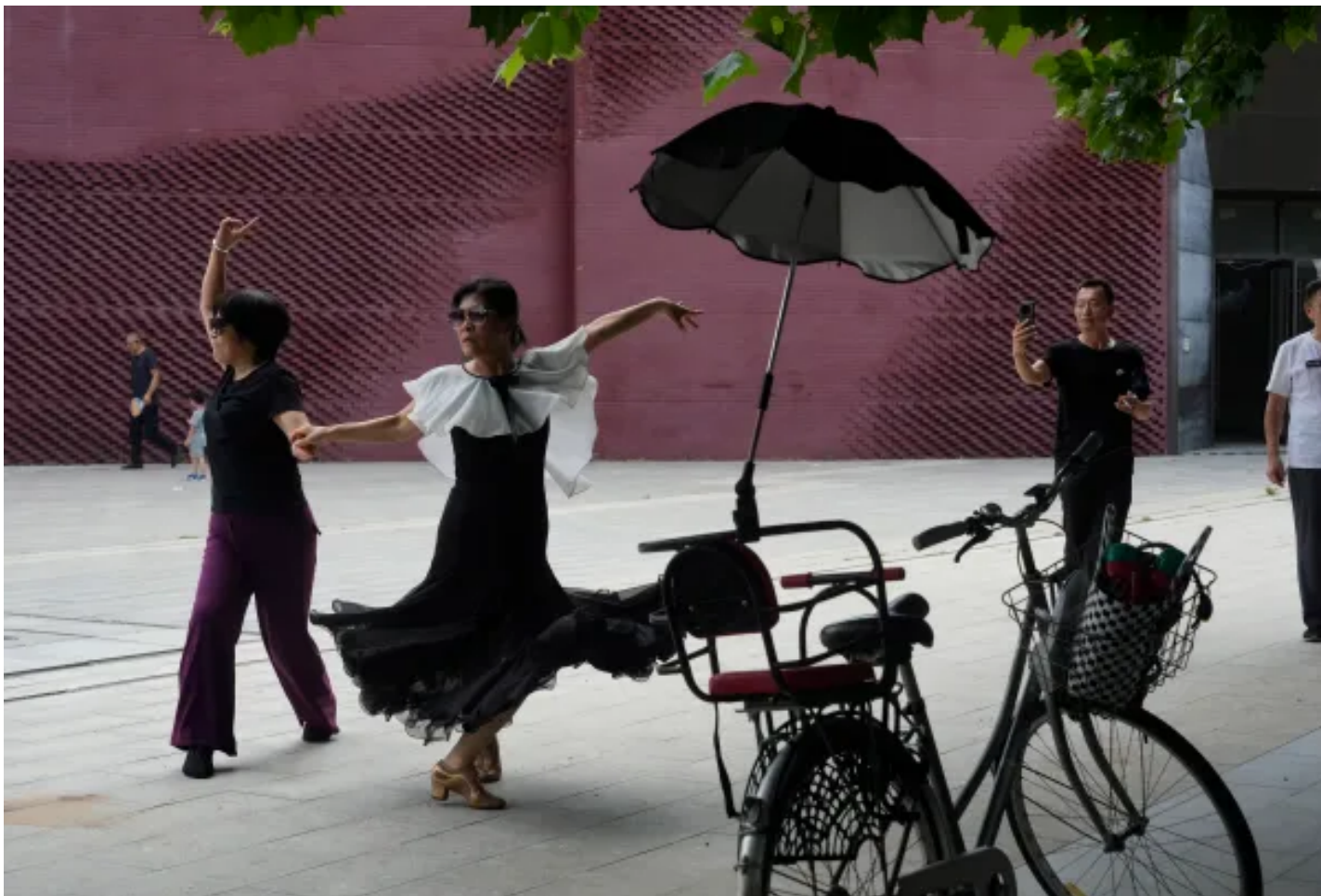
2024年8月6日，中國北京，女士們正在跳廣場舞。

離開真相，談何看見彼此和追求正義？我們的日報、速遞Whatsnew、端聞Podcast能夠保持免費，離不開每一位會員的支持。 暢讀會員首月5折 ， 尊享會員全年85折 ，幫助我們做出更好的即時報導和深度內容。