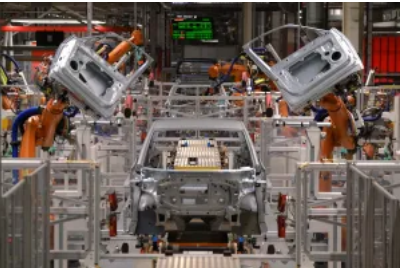
中美電動汽車來攻下，德國擔憂「去工業化」 | Whatsnew

福士汽車高層希望通過現有的削減計劃進一步削減成本並增加報酬率。根據計劃，僅福士汽車品牌到2026年就將節省100億歐元，報酬率則可以提高至6.5%。工會則批評管理層戰略錯誤，強調關廠絕不可行。工會主席指「解雇、工廠關閉和薪資削減」「只有在一種情況下才是可以接受的，那就是整個商業模式已經死亡」。可預期，工會與管理層接下來將展開激烈的鬥爭。