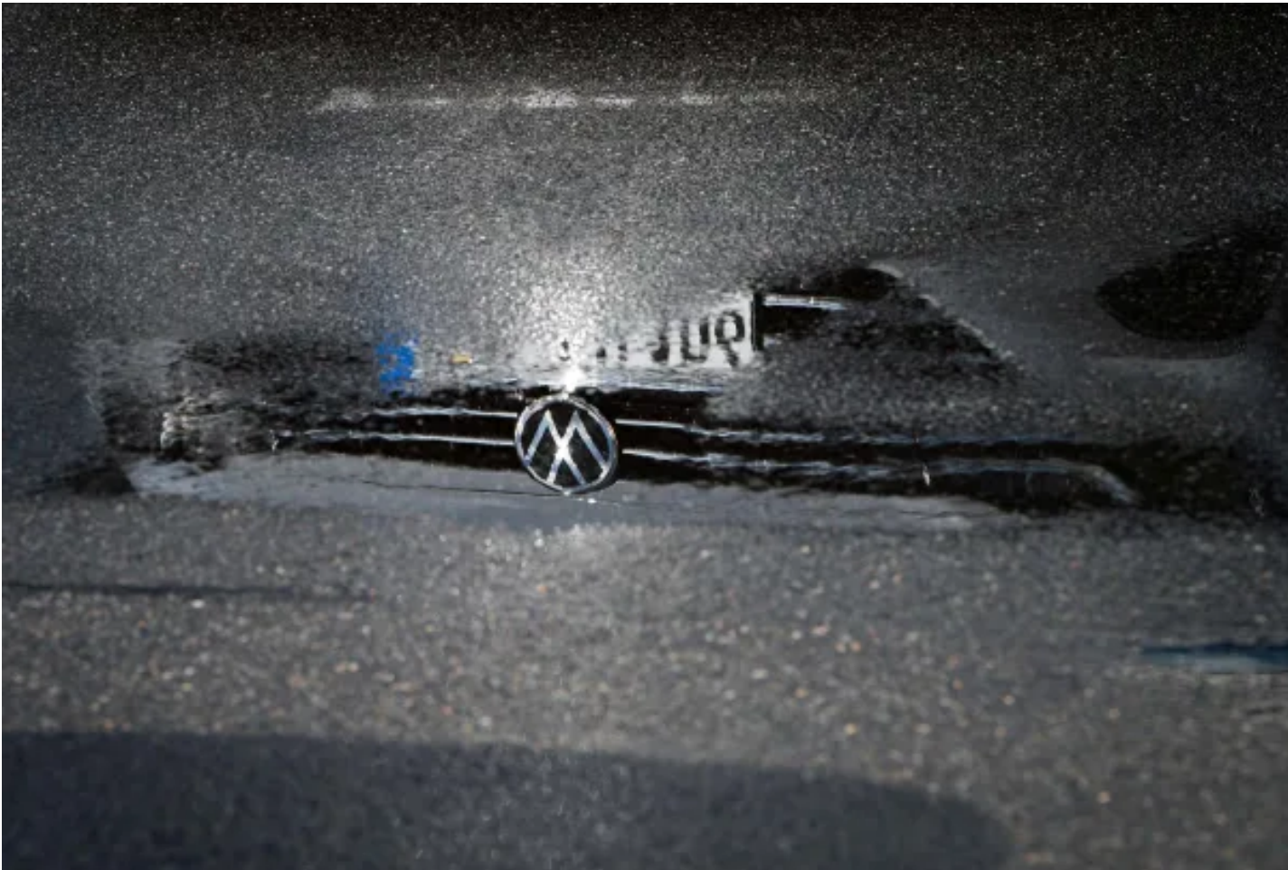
2024年9月11日，德國下薩克森州，福士汽車的標誌倒映在水坑中。

離開真相，談何看見彼此和追求正義？我們的日報、速遞Whatsnew、端聞Podcast能夠保持免費，離不開每一位會員的支持。 暢讀會員首月5折 ， 尊享會員全年85折 ，幫助我們做出更好的即時報導和深度內容。