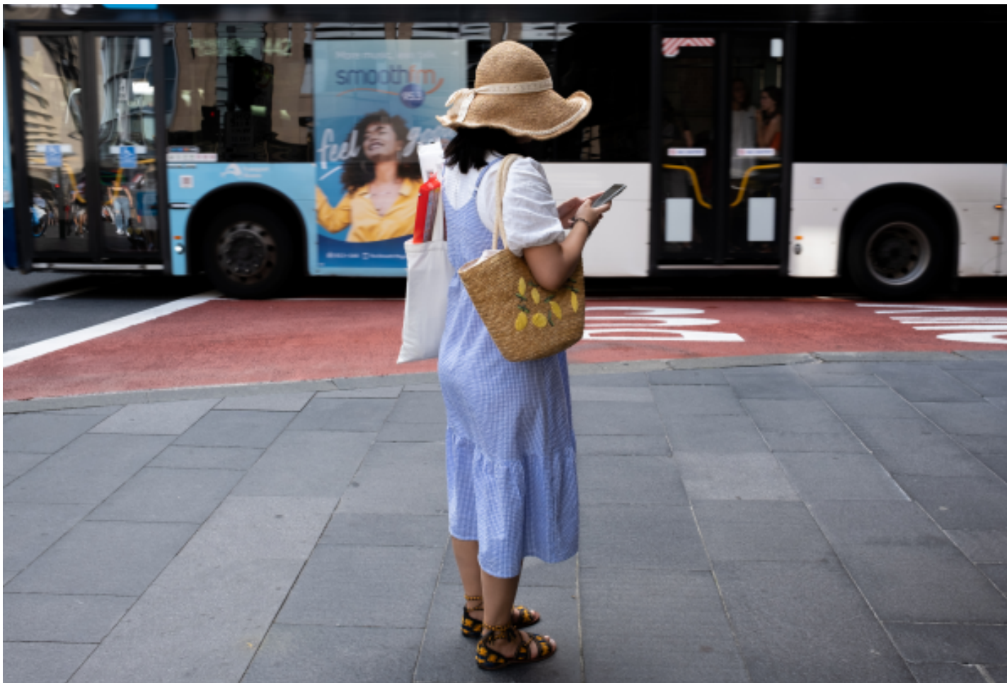
2023年2月12日，澳洲悉尼，一名女士在巴士站旁看手機。

社交媒體對青少年的負面影響已經到了政府必須採取行動的地步，但怎樣的政策更好？人們爭論不休。