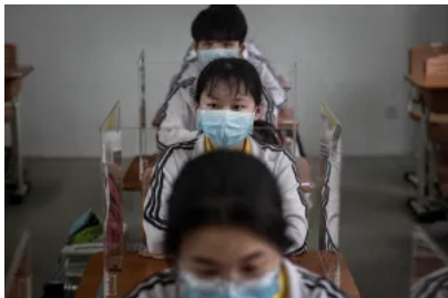
「想過一了百了，只能一忍再忍」，後疫情時代青少年心理困境

這一擬定中的立法，也反映出全球對此議題的焦慮：一方面，在早前疫情影響下，學生在家上課，使用科技產品和社交软件的頻率增加，令學校和家長擔心學生對科技產品、尤其是智能手機依賴成癮；另一方面，有關社交媒體算法誘導青少年患上進食障礙症、捲入網絡欺凌等新聞頻發，令各國家長和教育團體多次呼籲政府採取相關措施，保護青少年身心健康。