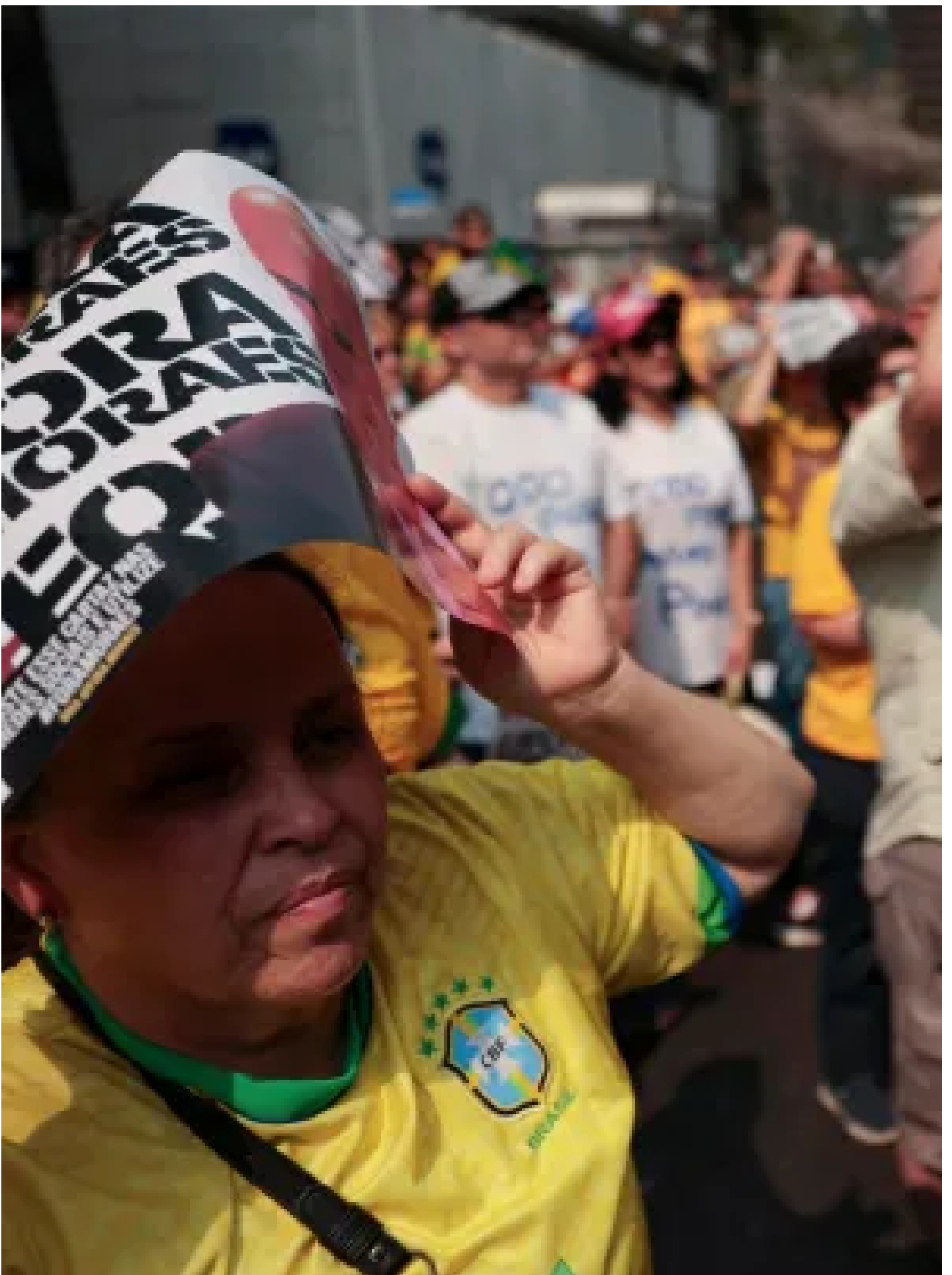
2024年9月7日，巴西聖保羅，有集會抗議巴西最高法院法官亞歷山大·德·莫賴斯（Alexandre de Moraes）封殺X的命令。

莫賴斯隨後行動：8月31日凌晨，X已無法在巴西使用。9月2日，由包括莫賴斯在內的五名法官組成的小組一致通過了這一禁令。馬斯克控制的衛星互聯網公司 Starlink 的巴西賬戶也被凍結以追討罰款，Starlink 曾試圖對抗禁令，甚至考慮提供免費的網絡服務，但也在9月3日讓步，宣布將在巴西提供的 Starlink 服務中屏蔽 X。