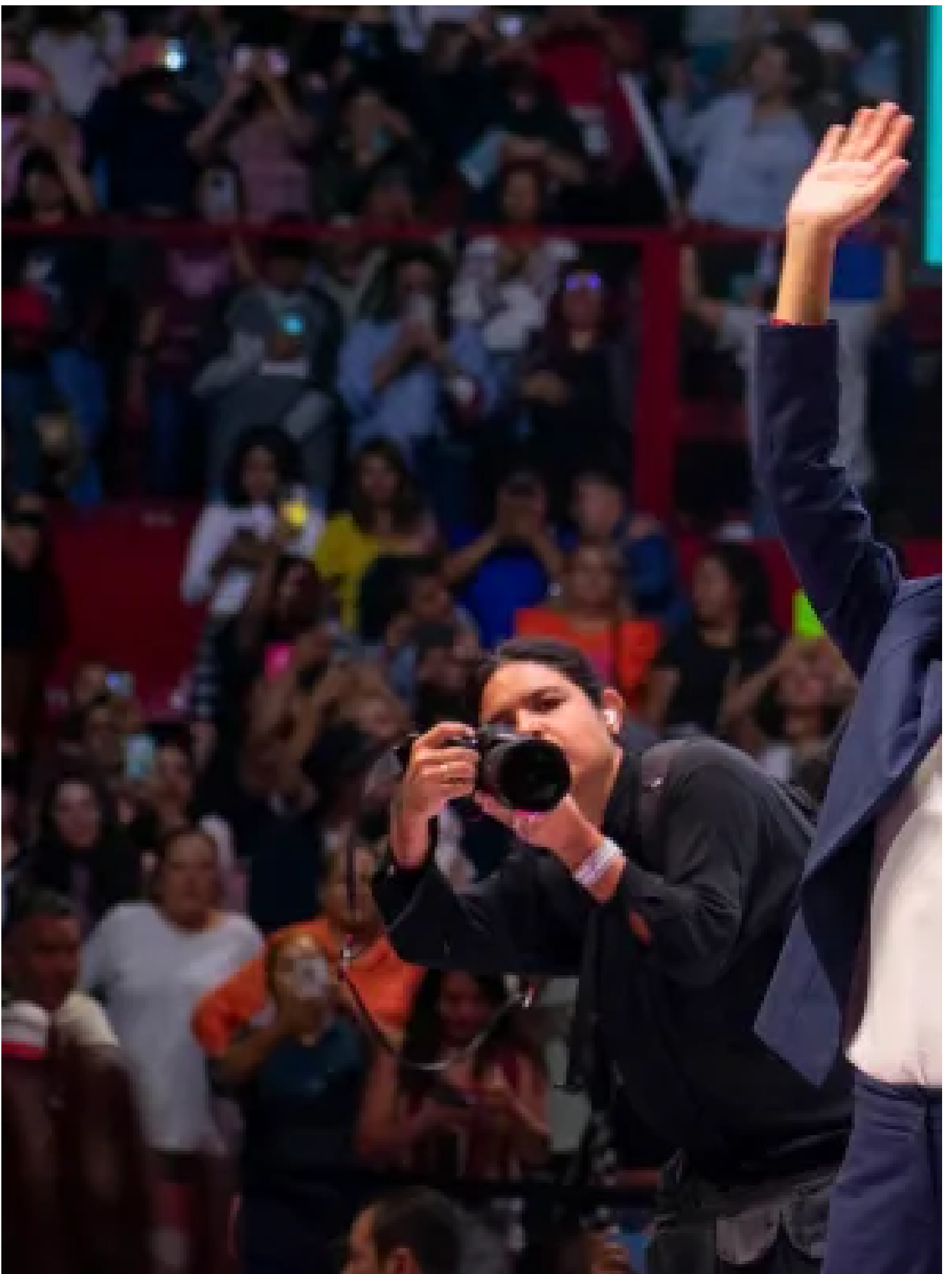
2024年6月8日，即將成為墨西哥第一任女性總統的克勞迪婭·辛鮑姆（Claudia Sheinbaum）在墨西哥大選中代表Morena獲得大勝。

洛佩斯提出的「第四次變革」代表了他希望通過「國家復興運動」執政在墨西哥引入的長期系統性改革，包含扶貧減貧、社會公正、消除腐敗、教育公平、甚至重建國家形象和精神等一系列目標。要完成如此大規模的改革，很顯然一次選舉勝利、一個總統任期是不夠的。基於目前的高支持率，「國家復興運動」期待從甫獲通過的司法改革中獲得更大的收益。