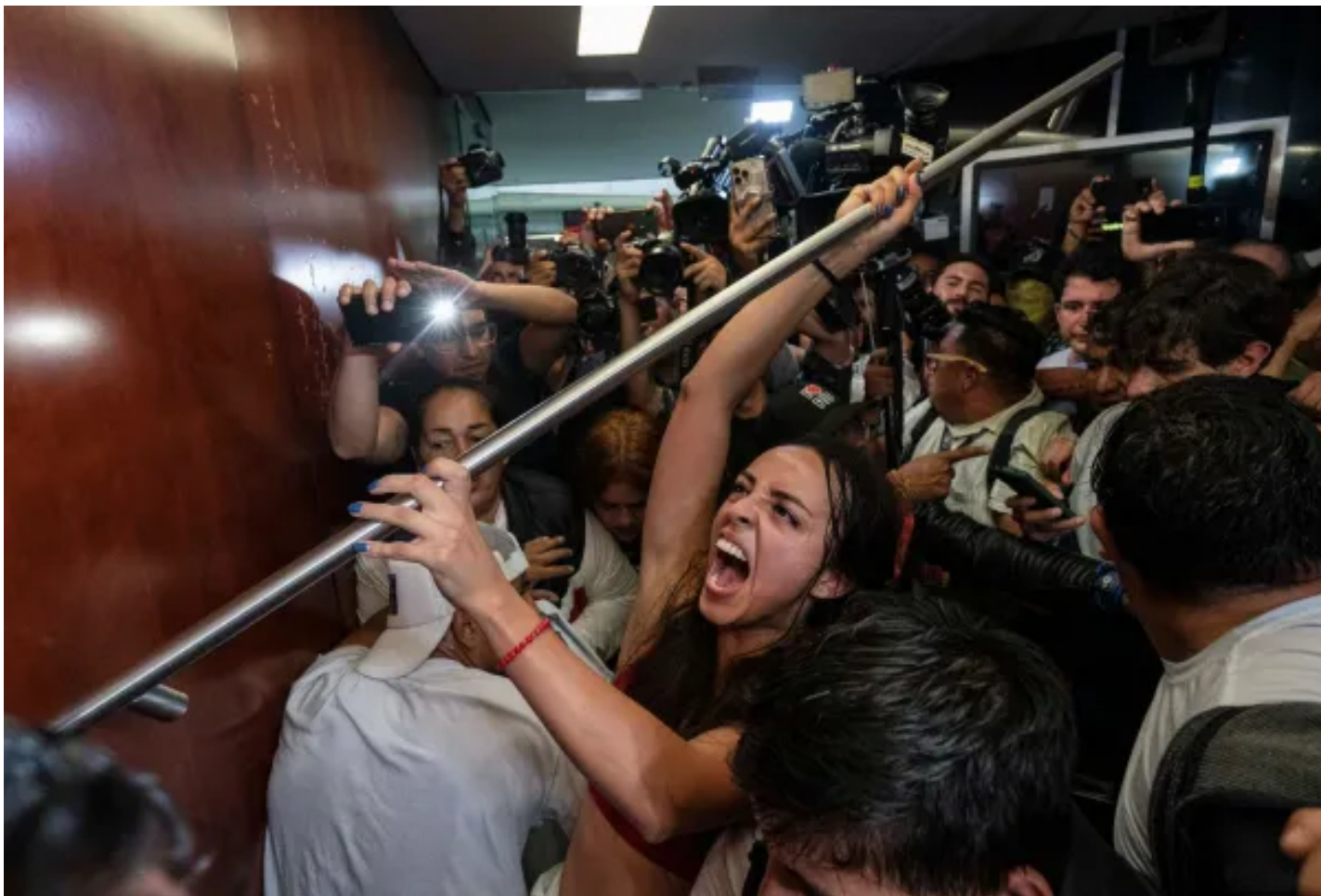
2024年9月10日，墨西哥司法改革審議期間，示威者試圖闖入參議院抗議。

司法改革旨在對目前的司法系統重新洗牌，從最高法院到基層司法人員的選拔都將由選民投票完成。