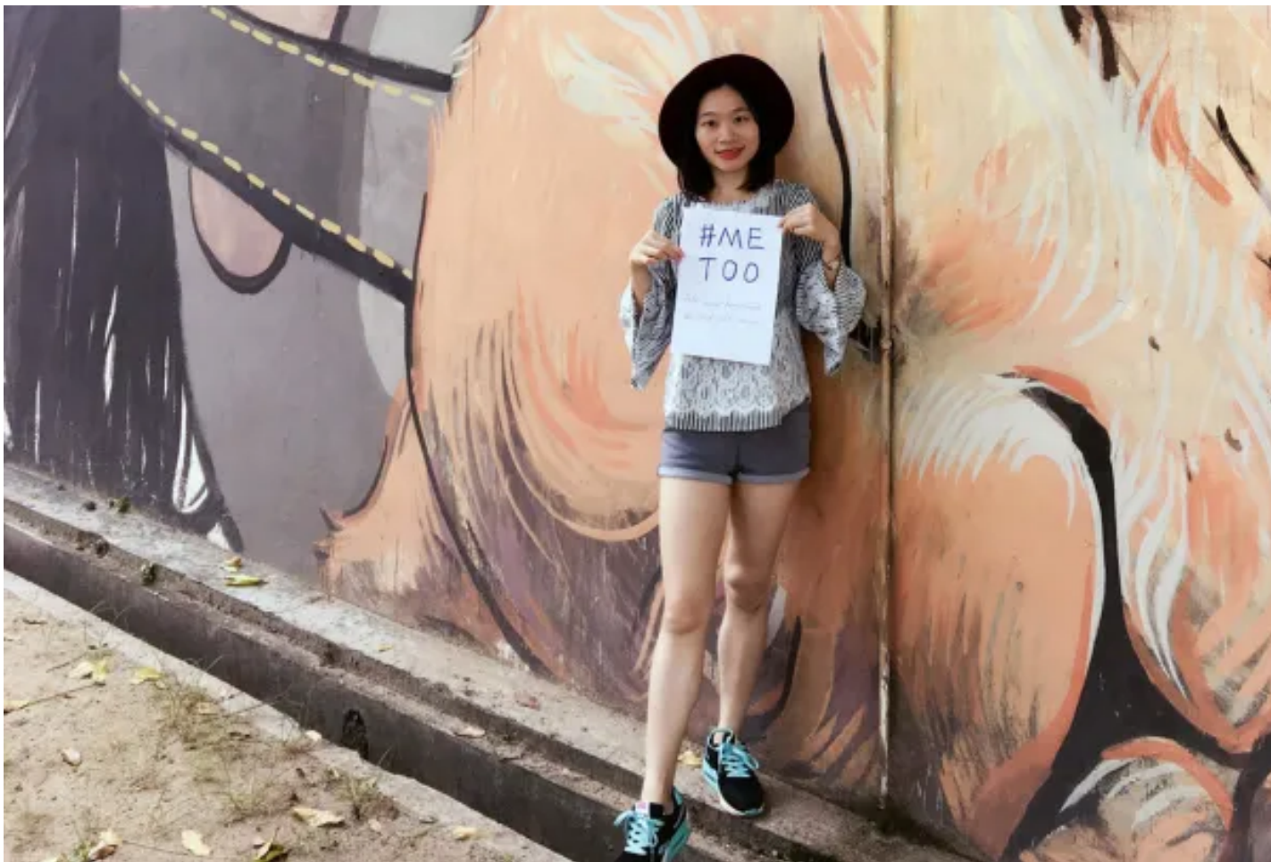
中國獨立調查記者、女權行動者黃雪琴。

9月13日，關注「雪餅案」案的社群媒體帳號「Freexueqin黃雪琴&jianbing王建兵」 發帖 披露，被控「煽動顛覆國家政權」罪的黃雪琴與王建兵已於9月12日收到廣東省高級人民法院的二審裁判文書，駁回其上訴。