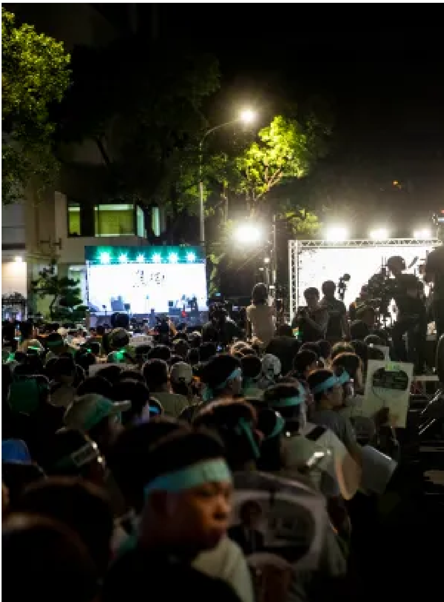
2024年9月9日，台北，民眾黨支持者於立法院外集會，要求當局釋放民眾黨主席、前台北市長柯文哲。

而楊貴智和法律白話文運動團隊，正是揹著法律專業在自媒體圈走了十年的一群人，一開始是為了傳遞關於服貿的正確訊息，現在他們仍期許法白可以對社會有更大的正面影響力。