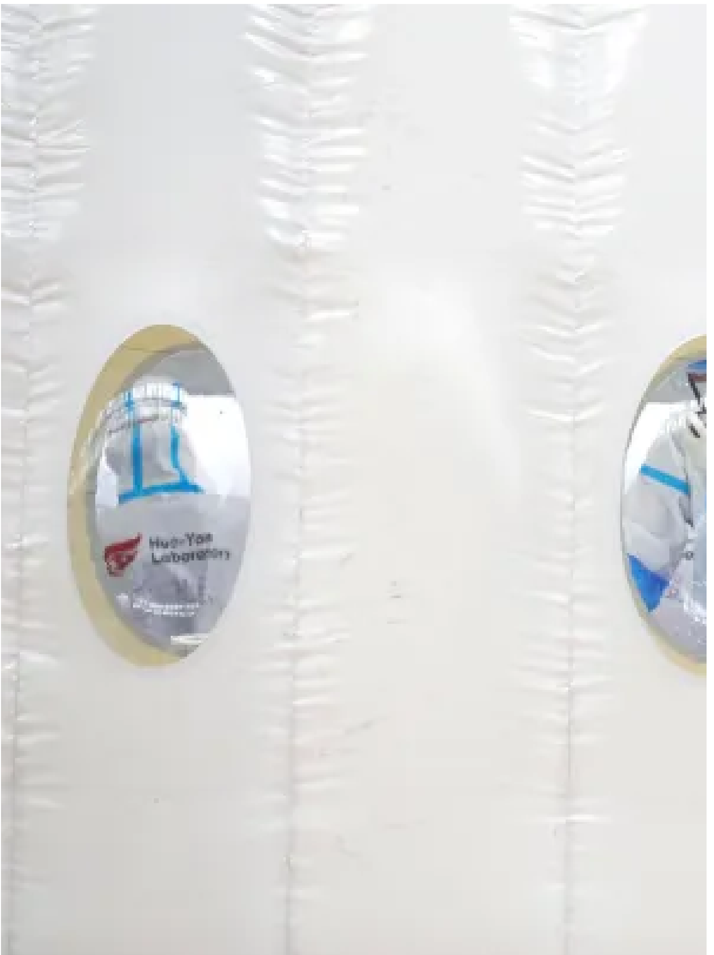
2020年6月23日，北京，穿著防護衣的工作人員對居民的樣本進行新冠病毒檢測，該實驗室由華大基因營運。

提高門檻的法案則以《外國敵對通訊透明法》（Foreign Adversary Communications Transparency Act, H.R. 820）、《科學及科技協議加強國會通知法》（Science and Technology Agreement Enhanced Congressional Notification Act, H.R. 5245）為代表。