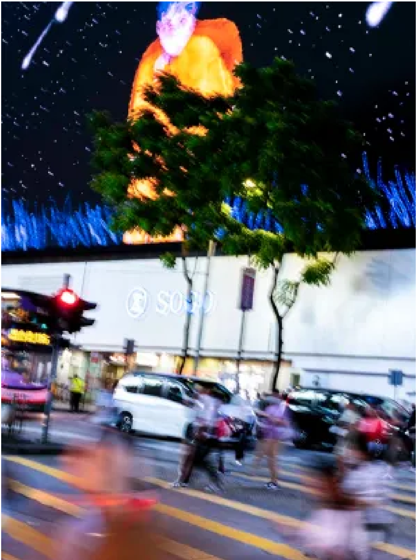
銅鑼灣過馬路的行人。

「這件事是很好的借鑑，日後修例的時候，（法改會）要知道其實不單單只是液體，而是針對私密部位的時候，都應該涵蓋。」她說。