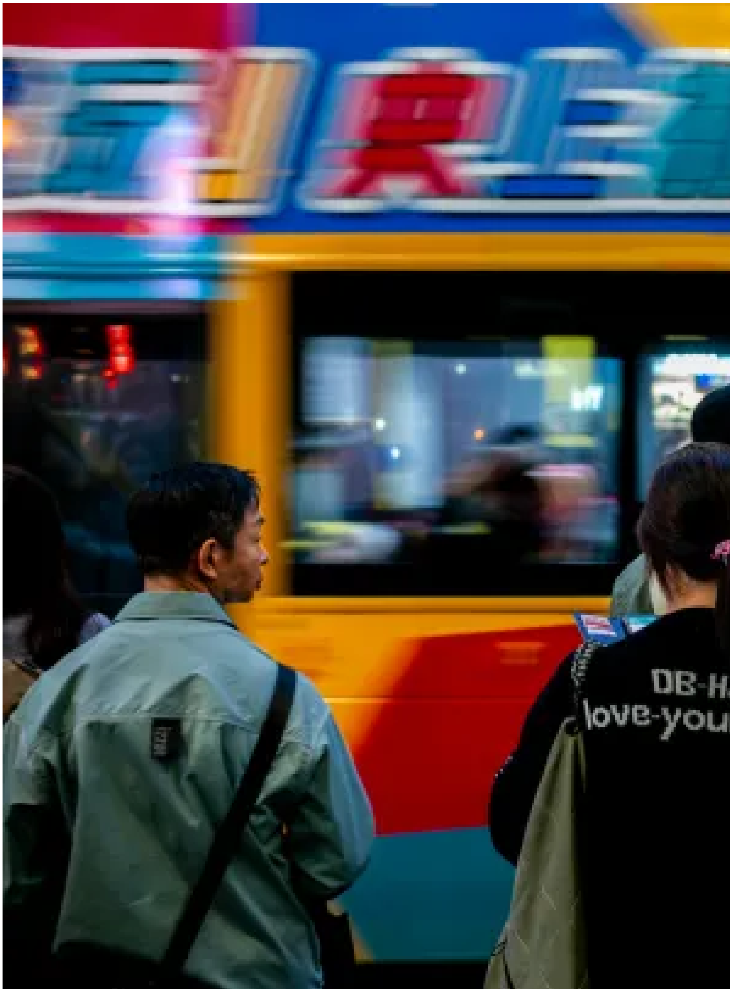
旺角繁忙的街道。

「這個行為是有問題的，是不應該出現的，要制止它，而不是說不要緊、不嚴重、忍了它就算了。」