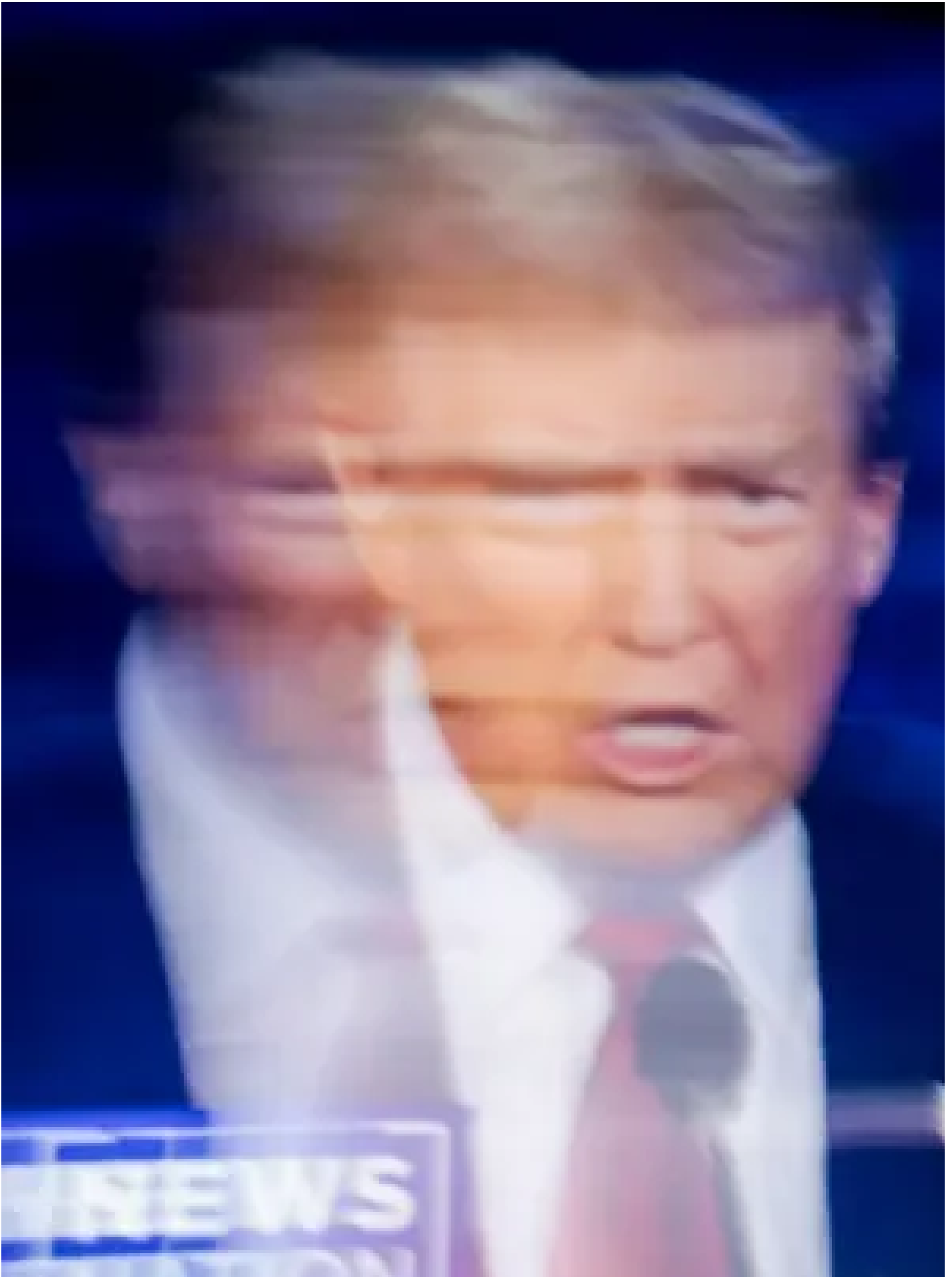
2024年9月10日，美國總統選舉電視辯論在費城舉行。

而在主持人問到移民相關的問題時，特朗普又把話題轉移回自己的集會，繼而又提到「海地移民」在俄亥俄州「吃貓吃狗」——這同樣也是未經核實的發言。特朗普還說，民主黨「試圖讓更多非法移民參與投票」，這也是共和黨近期攻擊民主黨移民議題的一套敘事的一部分——同樣也被 事實核查 指出是一則錯誤的指控。