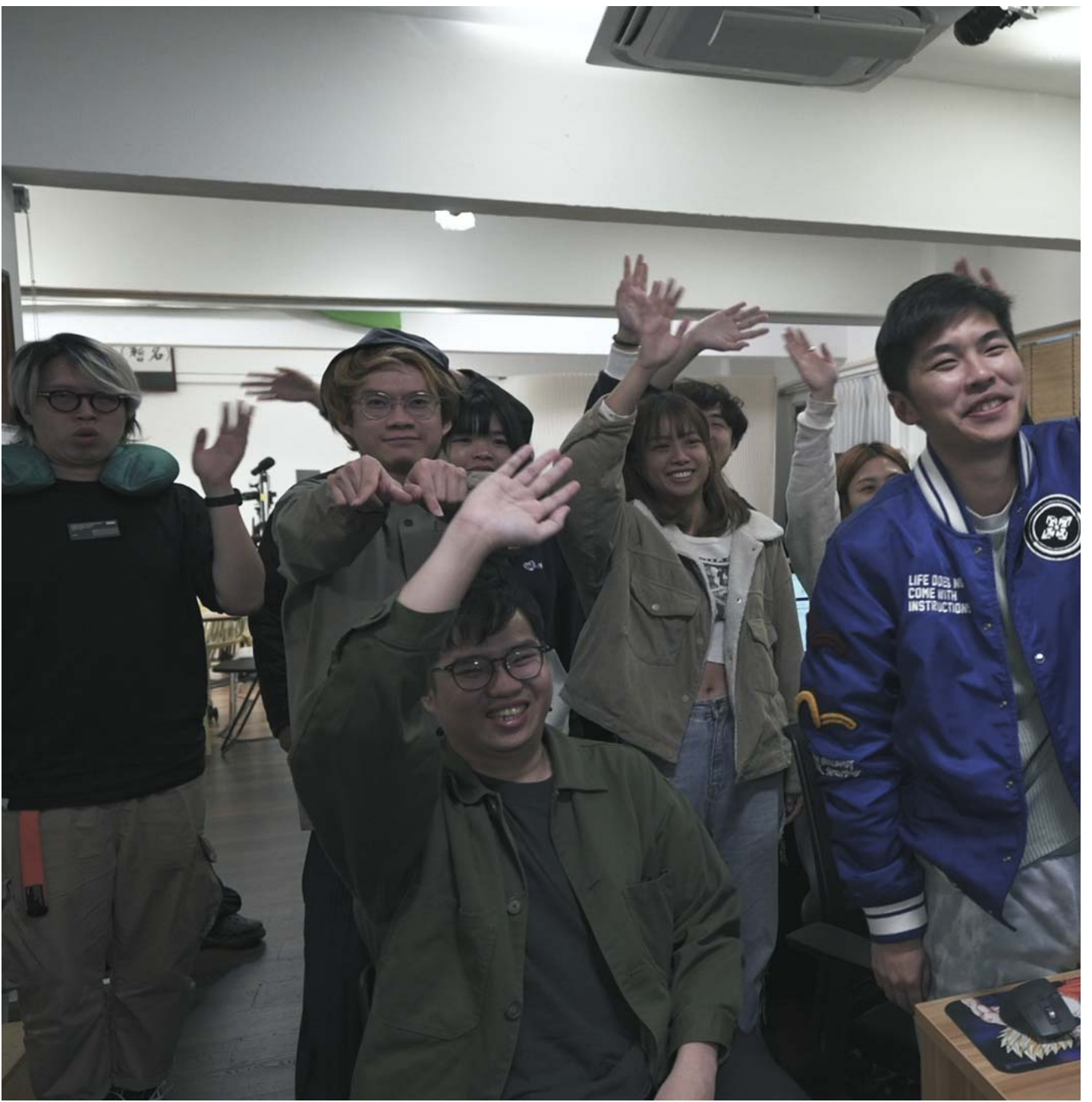
《公开试当真》剧照。高先电影提供