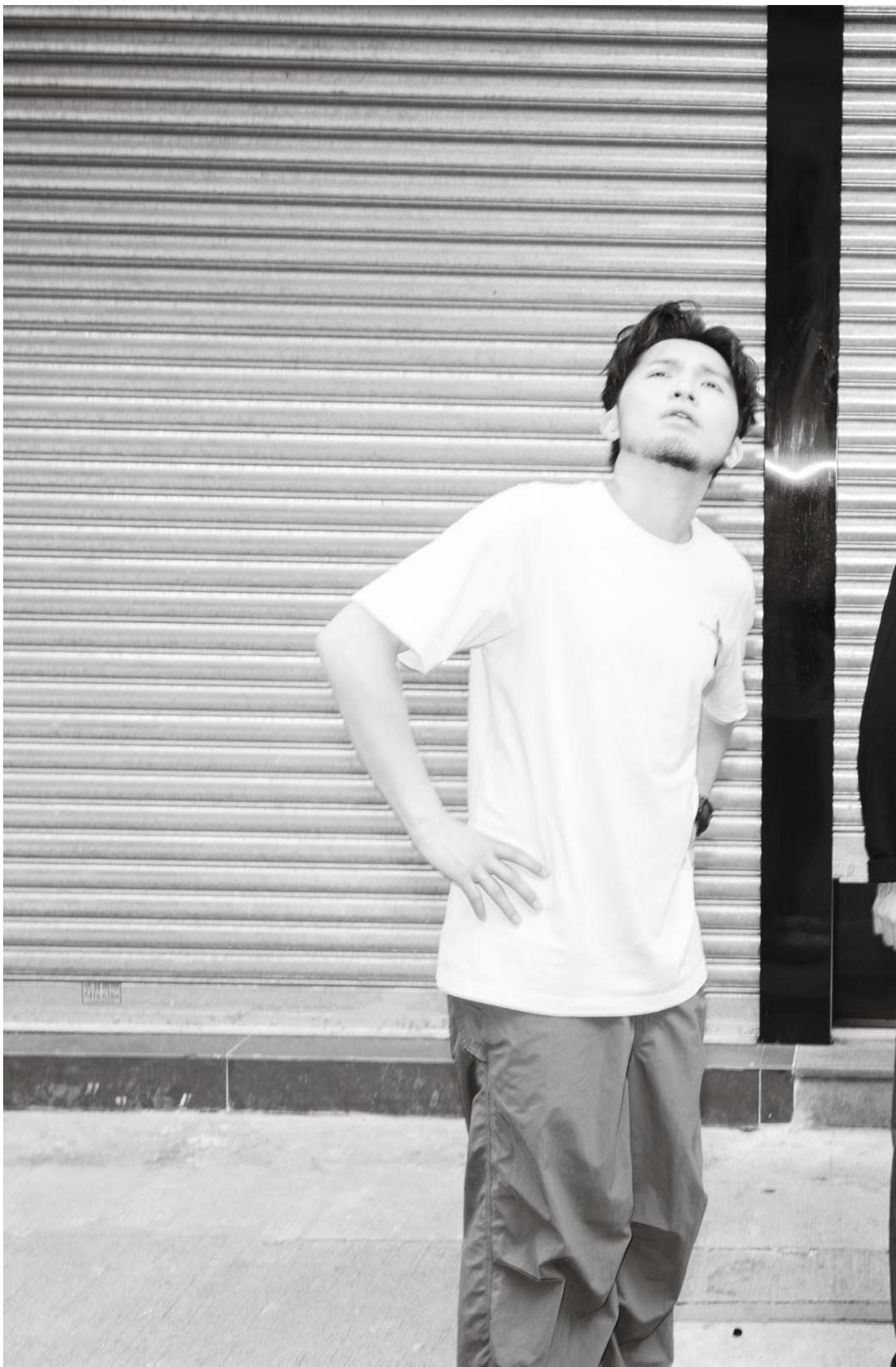
许贤与赞师父。