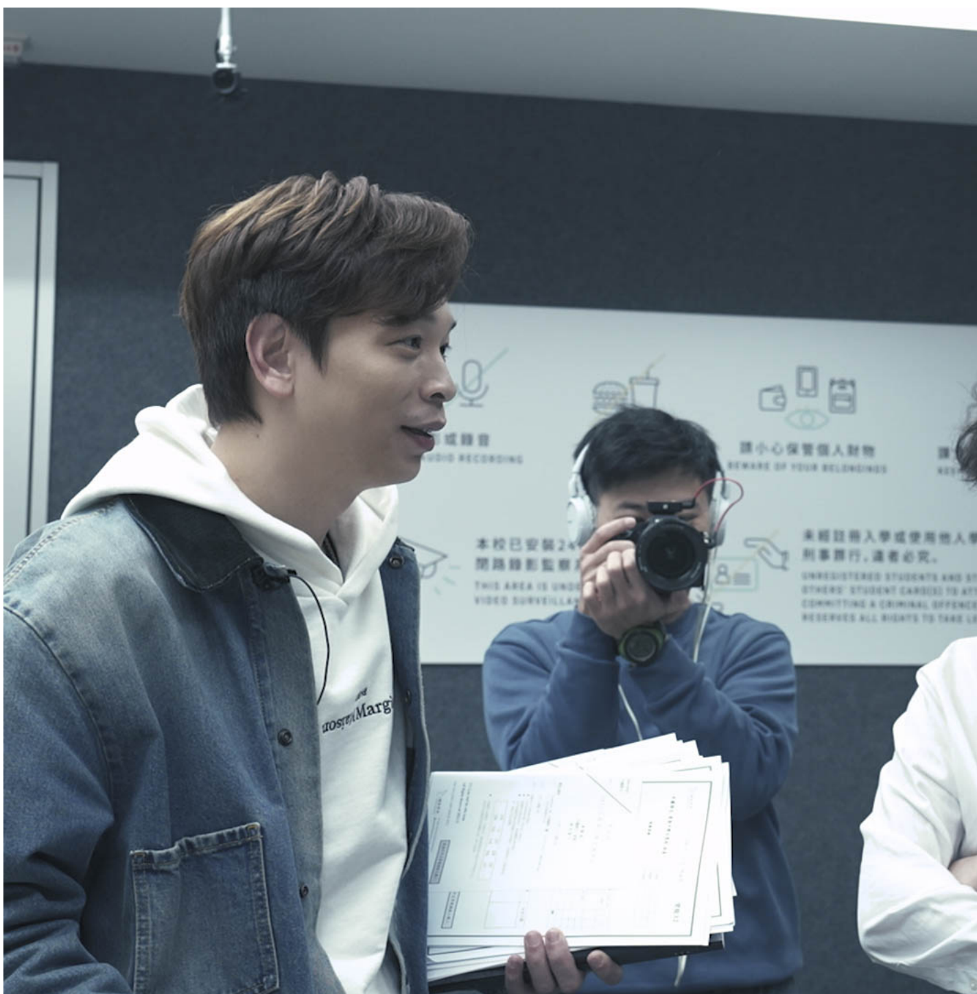
《公开试当真》剧照。高先电影提供