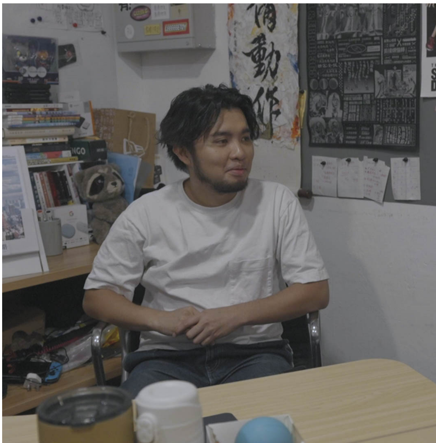
《公开试当真》剧照。高先电影提供