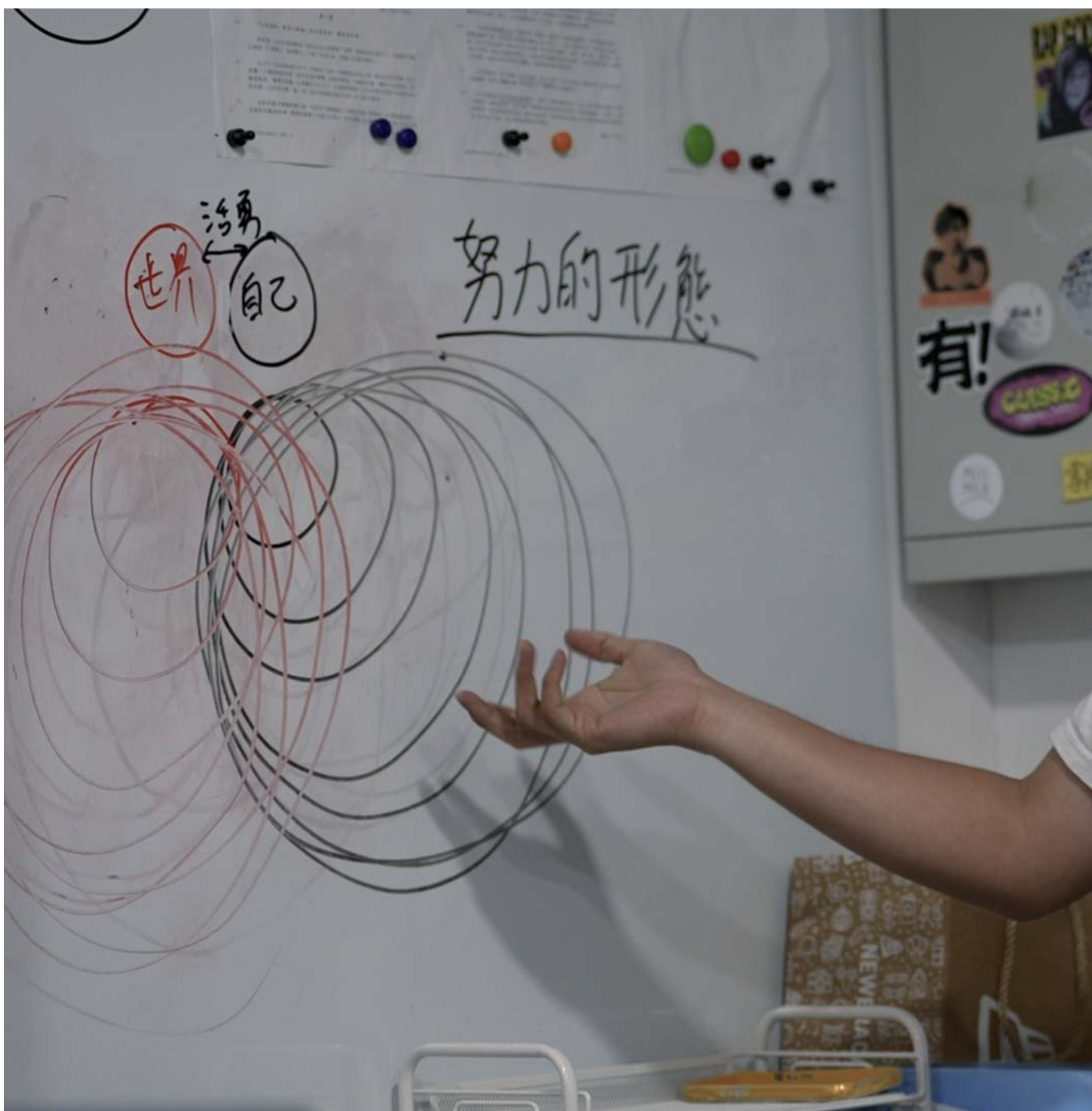
《公开试当真》剧照。