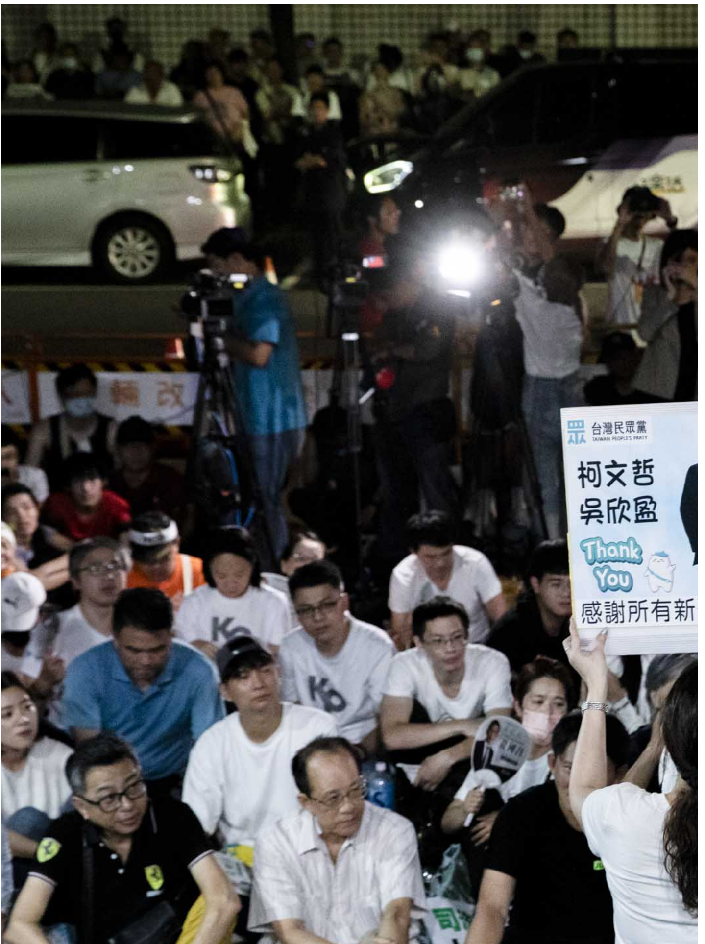
2024年9月1日，民众党主席柯文哲因涉京华城容积率案，遭台北地检署声押禁见，支持者在北检外聚集声援。