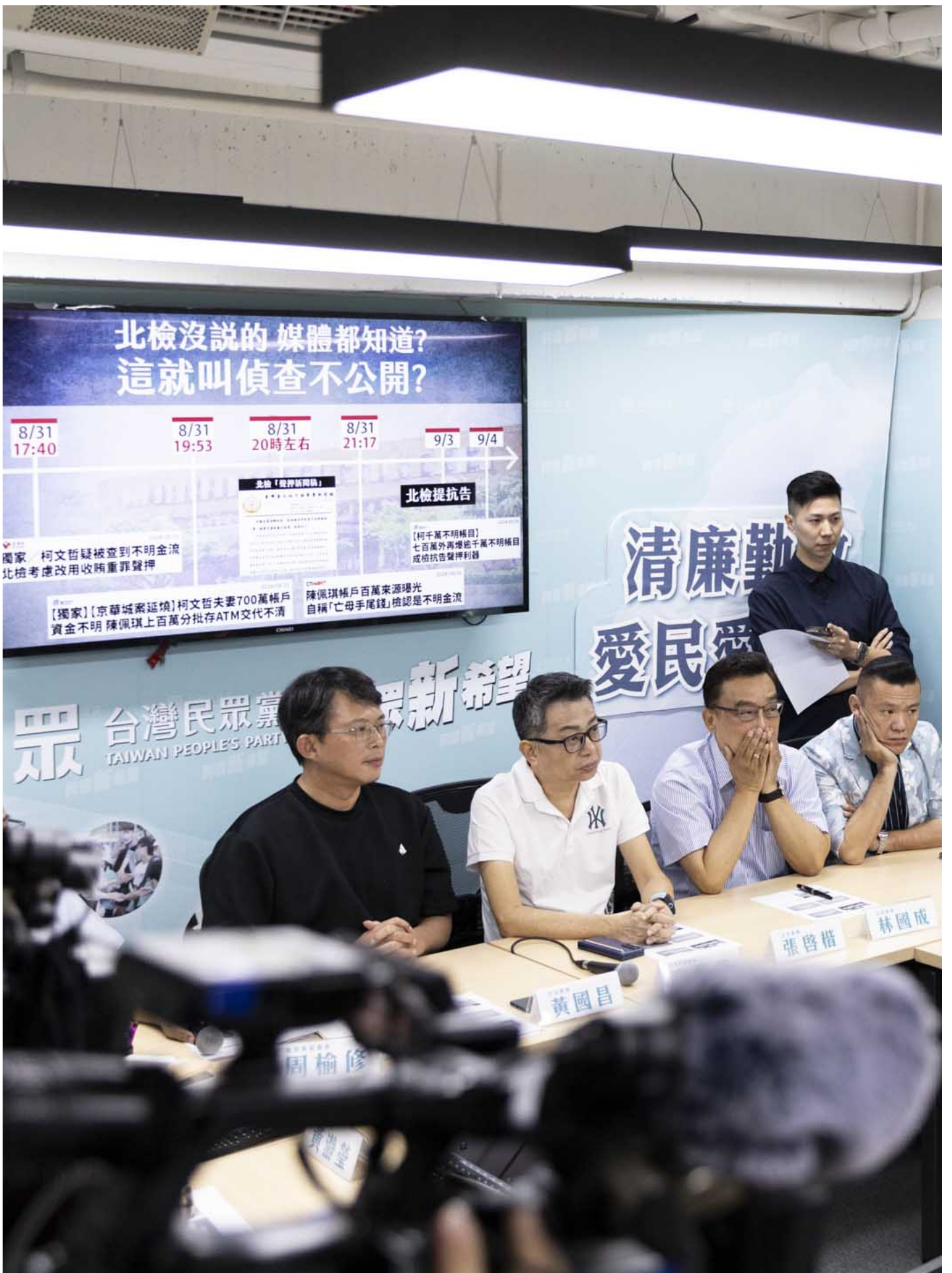
2024年9月5日，民众党主席柯文哲涉入京华城容积率弊案，发回台北地院更裁，召开羁押庭。民众党中央紧急应变小组举行记者会向外界说明立场。