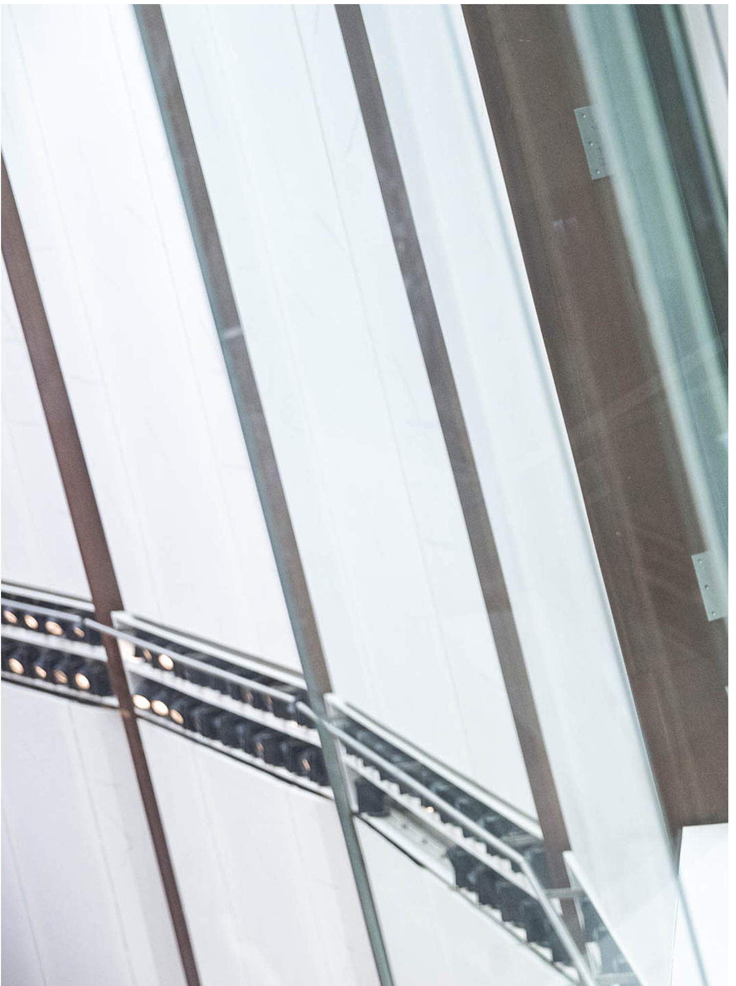
立法会议员谢伟俊。