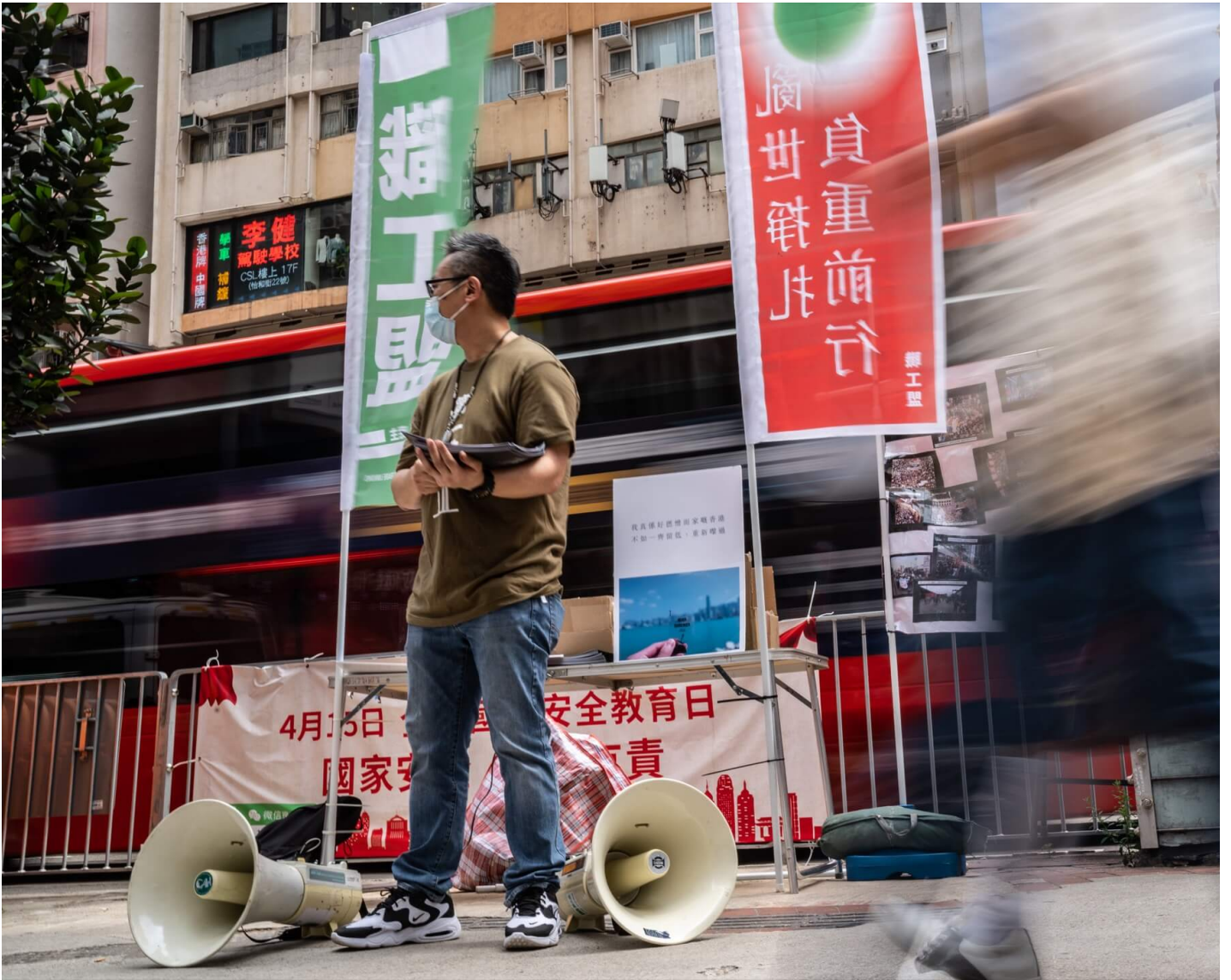
2021年5月1日，劳动节，职工盟以“乱世挣扎，负重前行”为题，在铜锣湾摆设街站派宣传单张。

政策争议背后，这是新一场由工会和素人牵头的反修例运动。有人质疑这是“打飞机式”抗争，也有人深信这是香港公民社会的韧性。