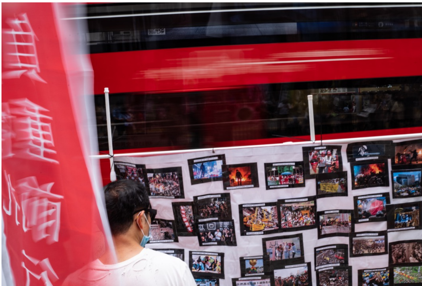
2021年5月1日，劳动节，职工盟以“乱世挣扎，负重前行”为题，在铜锣湾摆设街站，宣传横额上贴上过去香港各大小示威的图片。

法例已过，历史已写，但《关注锁港条例工会联合阵线》一班工会还在构思社交媒体的活动推动议题，还在等待附属法例的进展继续监察。