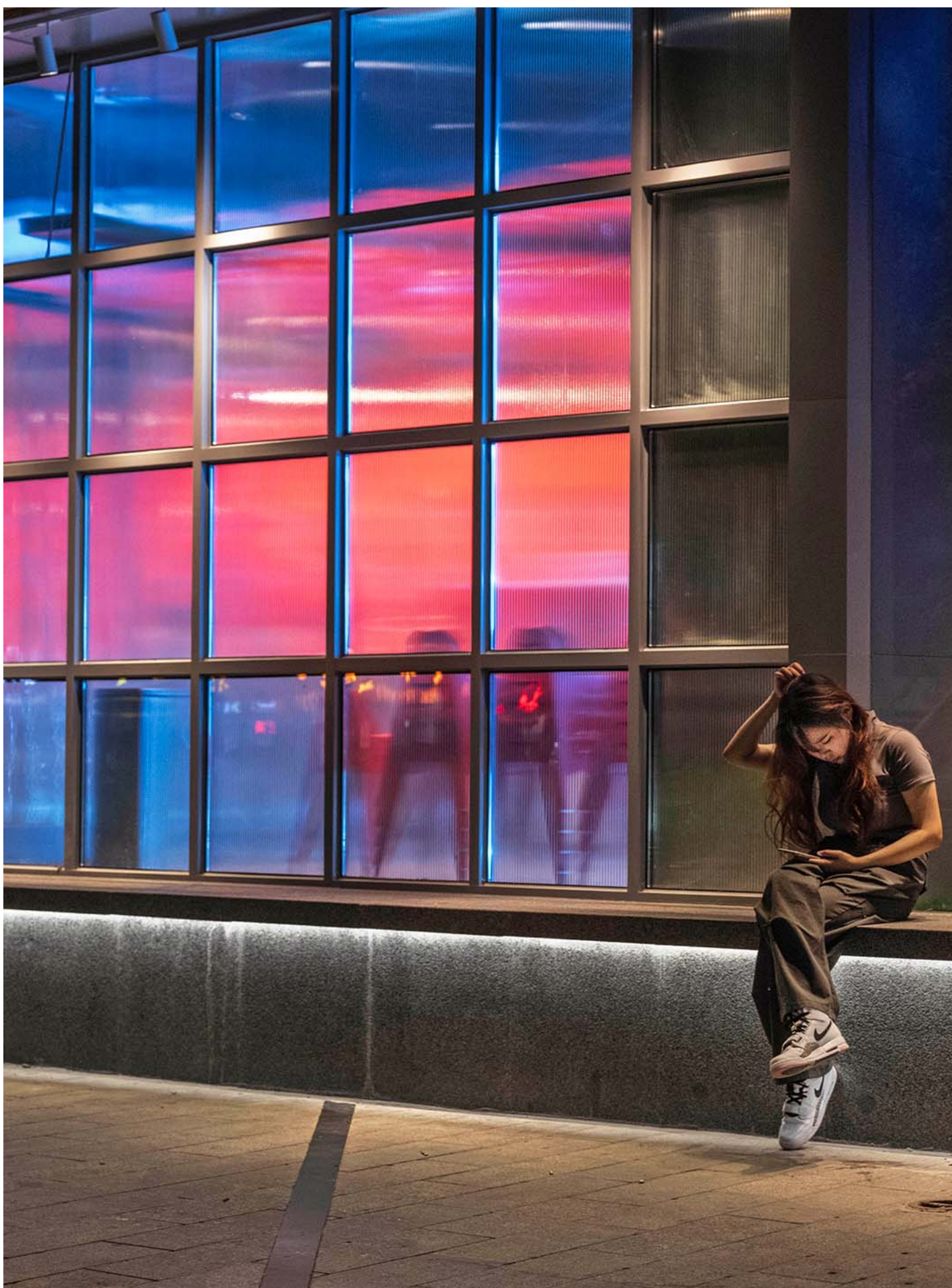
2023年9月13日，中国北京，人们在餐厅外看手机。