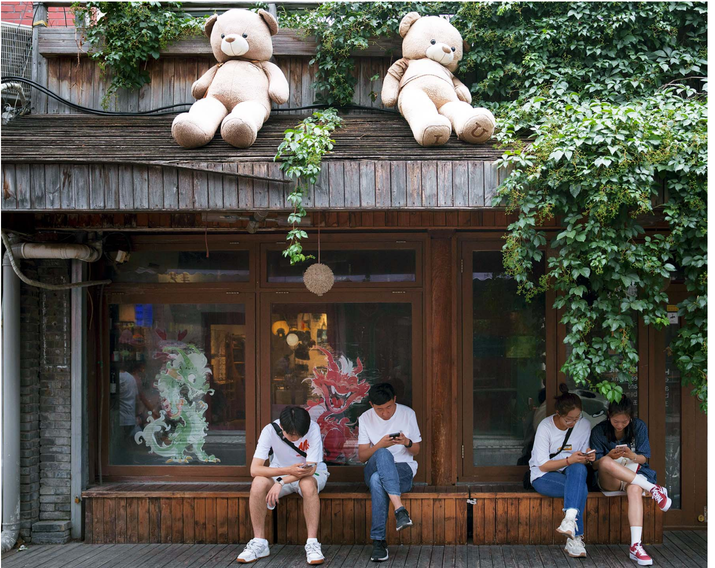
2024年6月27日，中国北京，人们坐下商铺外看手机。