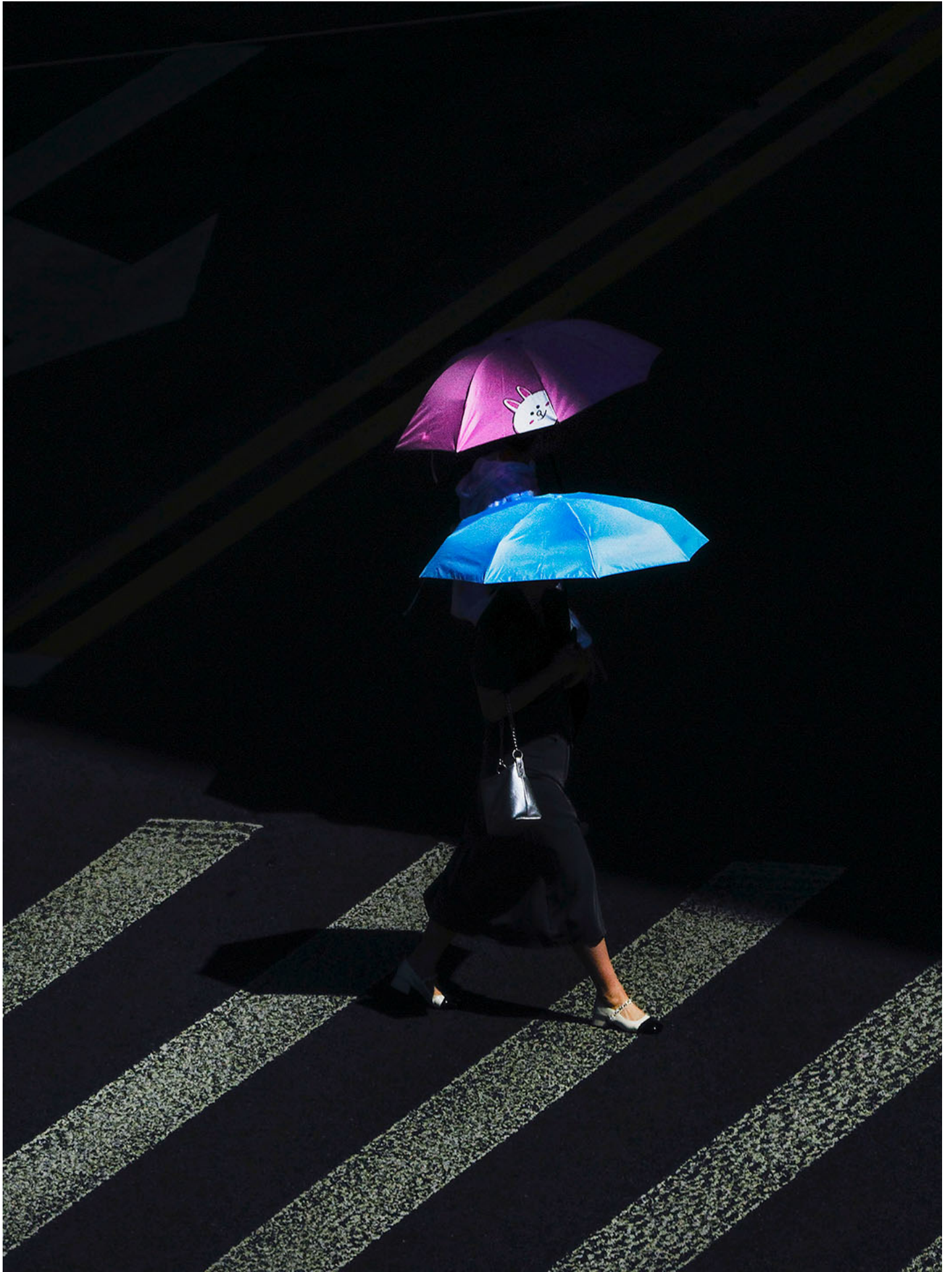
2024年7月4日，中国上海，行人撑著雨伞过马路。

两个外来知识分子的结合，吸引了大量年轻人涌入徐艳东的书店、加入公共讨论和探寻知识边界，但也带来了不必要的关注。