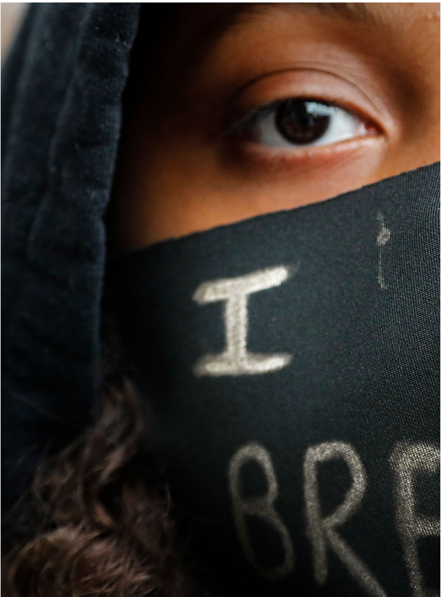
2020年6月6日，英国伦敦，一名女孩戴著写有“Black Lives Matter”的口罩。

许多政策暗含种族主义和偏见。例如，对吸食块状可卡因的人判处的监禁比粉末可卡因更长。前者通常由美国黑人使用，而后者通常由白人吸食。1986年通过了《反药物滥用法》。该法案对使用毒品施加了更严厉的惩罚，并对公共住房提出了更严格的要求。结果，很多底层非裔美国人失去了获得公共住房的机会。但由于缺乏其他工作机会，Ta们只能参与毒品交易，成为被监禁的对象。