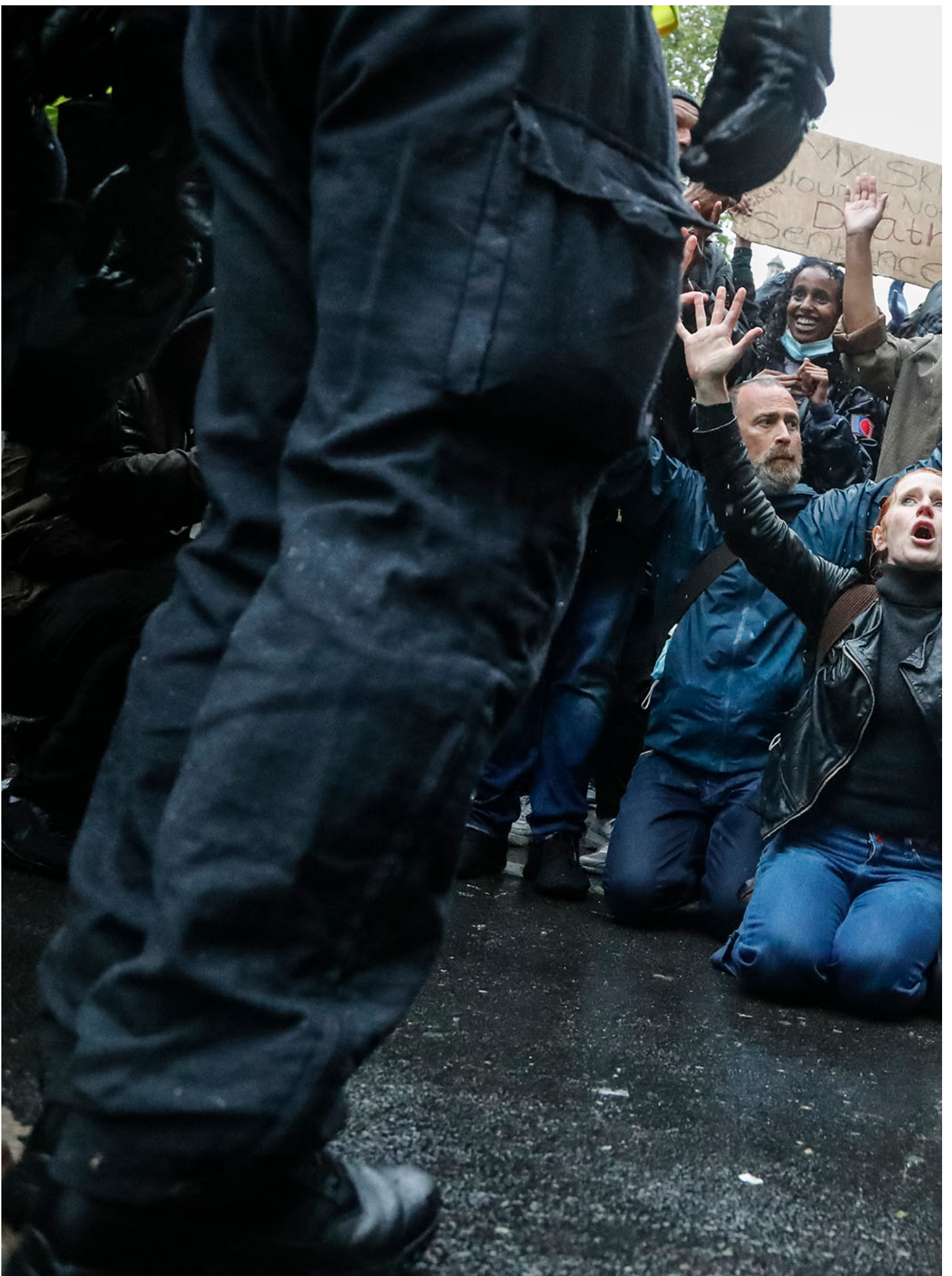
2020年6月5日，英国伦敦，示威者面对警察下跪，抗议美国明尼阿波利斯警察杀害非裔男子佛洛伊德。

BLM 运动是在美国历史上唯一的黑人总统奥巴马执政时期兴起的运动——谁说黑人做了总统就有了种族平等？“国王已死，但是主仆的思维长青。（The king is dead but long live the king）” 废除运动的名字就指向这种奴隶制的延续。