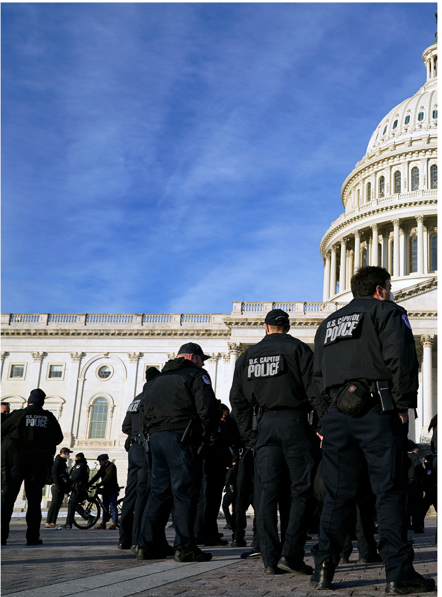
2022年1月6日，美国华盛顿，警察站在国会大厦前。