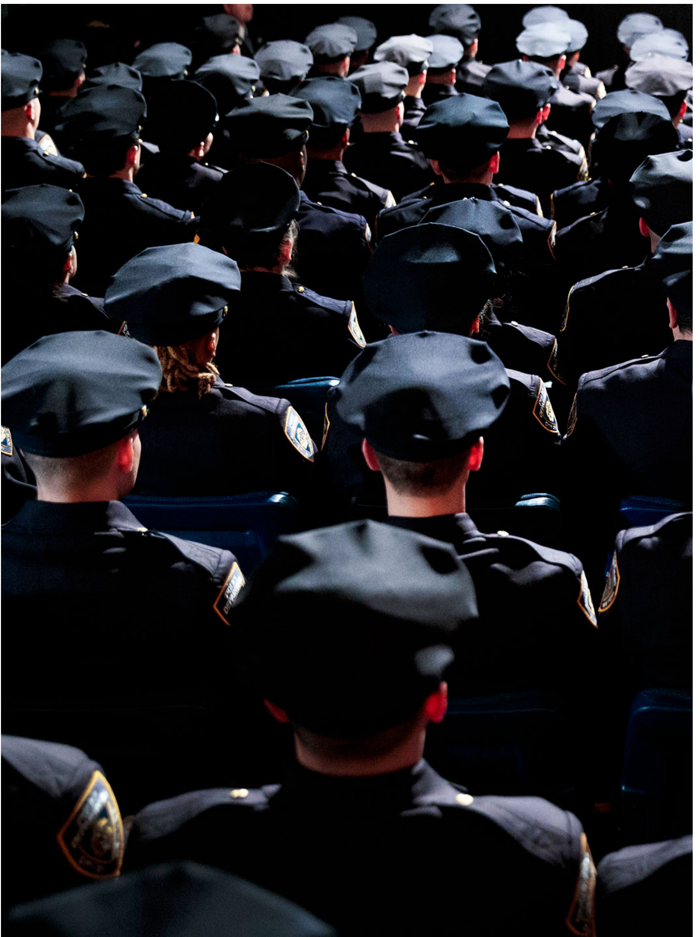
2017年3月30日，美国纽约，警察学院毕业典礼。

在《监狱过时了吗》这本书中，Davis 以这样一个故事结尾：1993年在南非，一个反对种族隔离政策的白人女孩 Amy Biehl 在开普敦送她的黑人朋友回家的路上被几个高喊着反白人口号的黑人杀害。他们用石头砸 Amy 的车，逼她停车，然后将她从车里拽出、谋杀。在这一年，南非种族隔离制度已经运作了45年，非白人第一次可以投票，距离曼德拉带领的非洲人国民大会胜出仅需要再等一年。当时26岁的Amy是美国人，她选择通过富布莱特项目（fullbright program）来到南非正是因为收到了曼德拉的感召。