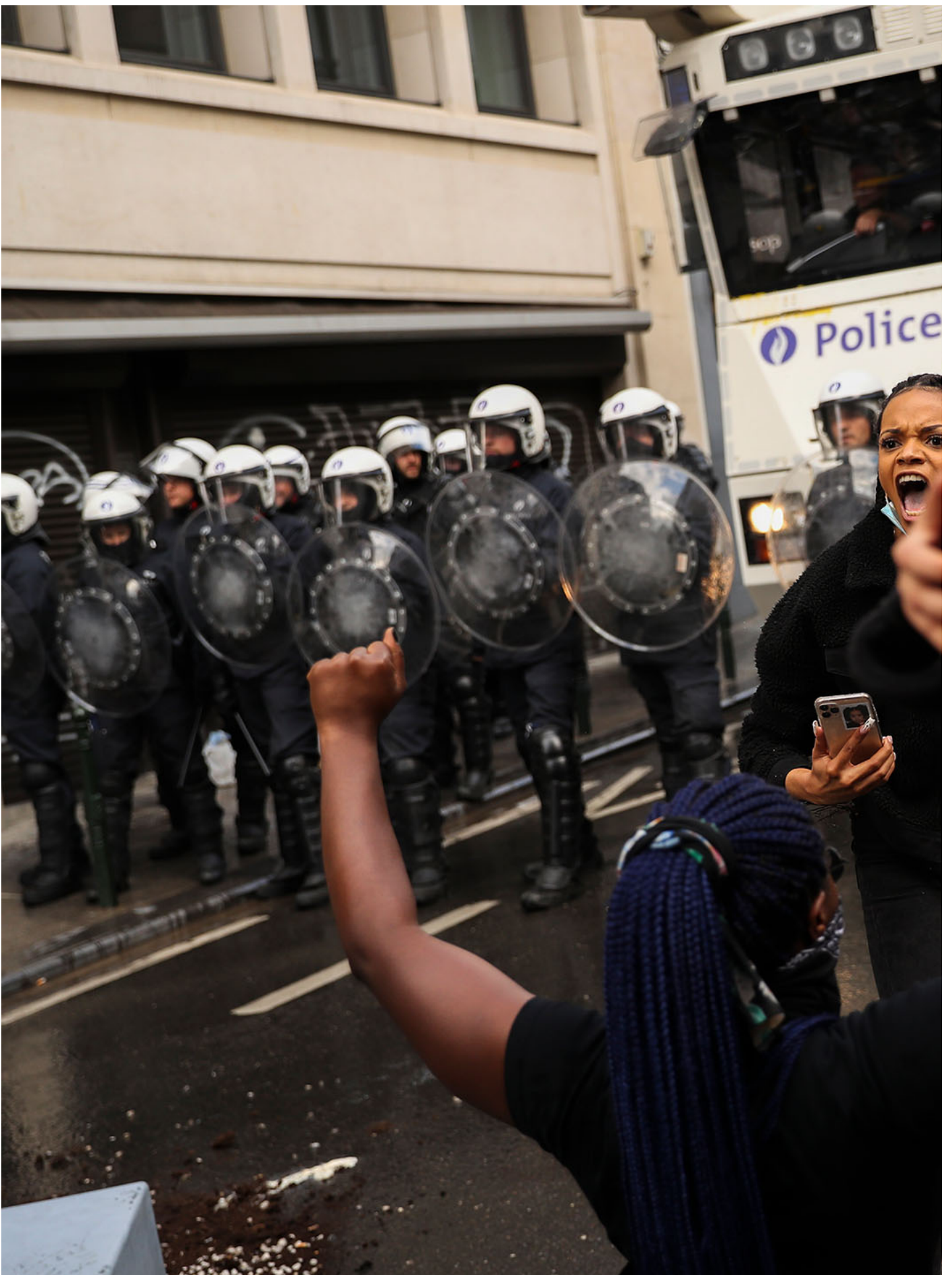
2020年6月7日，比利时布鲁塞尔，“Black Lives Matter”运动期间，警察与示威者爆发冲突，摄：Francisco Seco/AP/达志影像