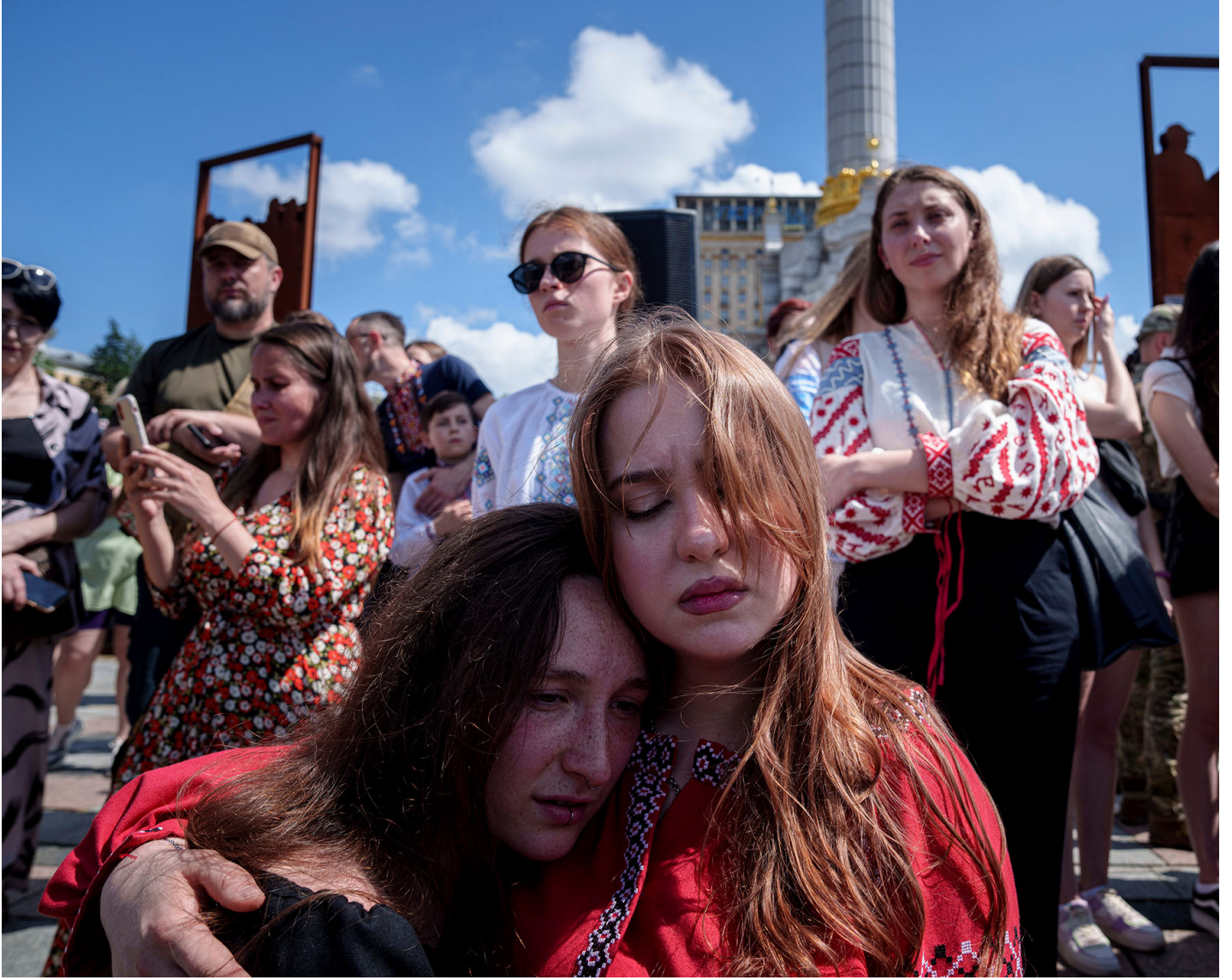
2024年6月2日，烏克蘭基輔，獨立廣場舉行的追悼會上，群眾們互相擁抱。

2024年8月7日，烏克蘭對俄羅斯庫爾斯克地區（Kursk Oblast）發動 出人意料的進攻 ，到現在已有三週，隨着前線逐步從運動戰轉入相對靜態的階段，戰爭迷霧也逐漸消散，外界對整個行動的觀察有了更多的信息與把握。另一方面，由於烏克蘭將大量部隊與裝備轉向這一攻勢，頓巴斯前線的狀況加速惡化。俄軍前鋒已經抵達重要的後勤與交通樞紐波洛夫斯克（Pokrovsk）。一旦該城陷落，烏克蘭在頓巴斯地區最後的主要人口中心克拉瑪托爾斯克綜合體（kramatorsk agglomeration），就將暴露在俄軍的攻勢之下。