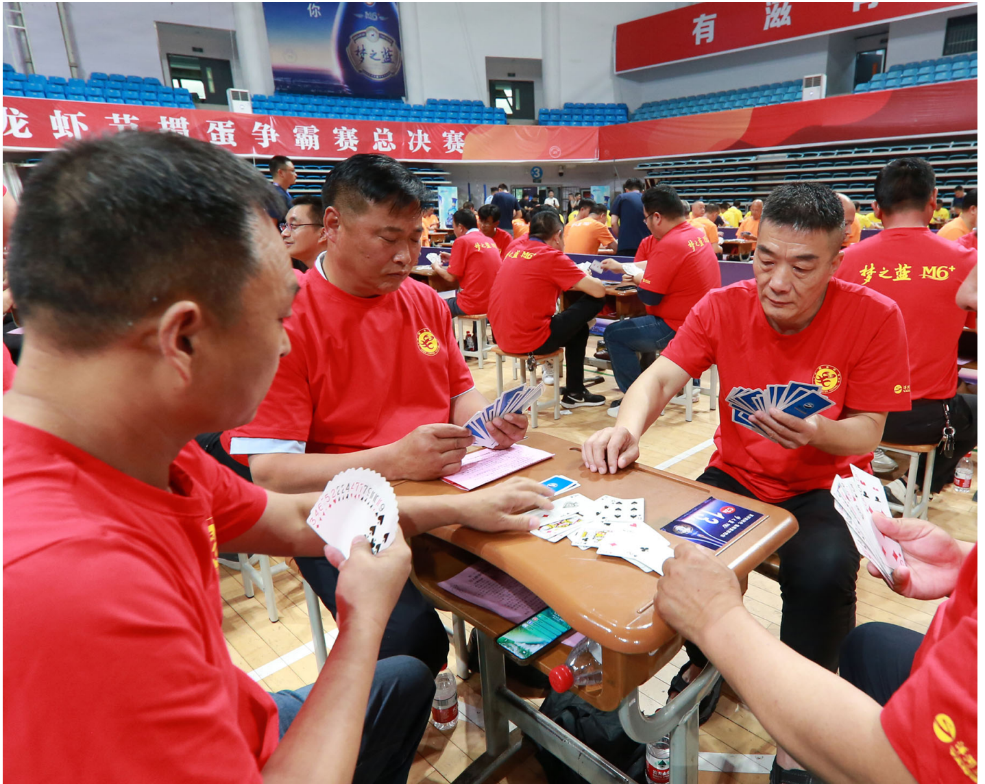
2023年6月18日，中国江苏省淮安，体育场内举行“攒蛋”纸牌游戏比赛。

名为“攒蛋”的纸牌游戏在风靡中国公务员、国营企业和金融圈一段时间后，日前遭到官媒密集抨击。