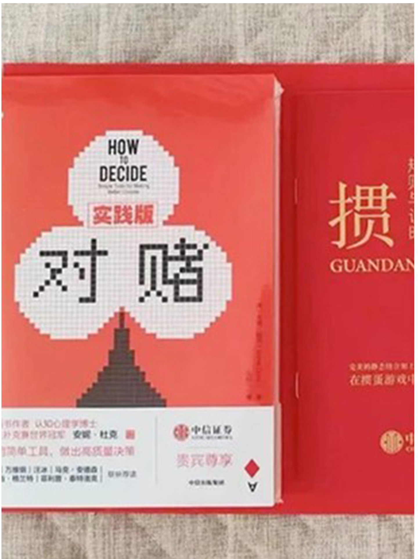
扑克牌游戏“贯蛋”。

针对《北青报》的评论，“贯蛋”发源地的媒体一开始还尝试反击：中共江苏省委机关报《新华日报》旗下的微信公众号“江东观潮”于8月8日发表题为《 贯蛋的‘打’与‘被打’ 》的文章。文章认为，如今的时代是个多元的时代，贯蛋不过是“不同人选择的不同休闲方式”；“只要不是原则性的、关乎底线的，不需要谁来判定对与错”。虽然这篇文章很快在公共号上遭到删除，但《南方周末》、《红网》、《红星新闻》等媒体也相继发声，为贯蛋辩护。