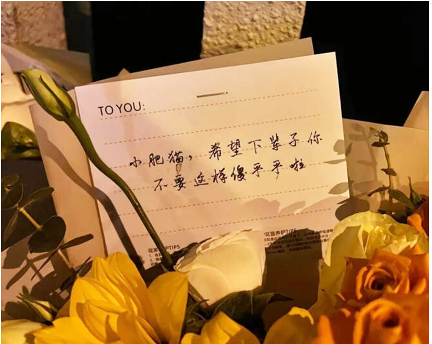
“胖猫”自杀后，不少市民到现场追悼。

端闻 podcast 的报导和制作都依赖端传媒会员的订阅付费支持。如果你喜欢我们的播客报导，请成为端传媒会员，支持我们持续产出，也让更多人透过音频获取深度报导和多元观点。