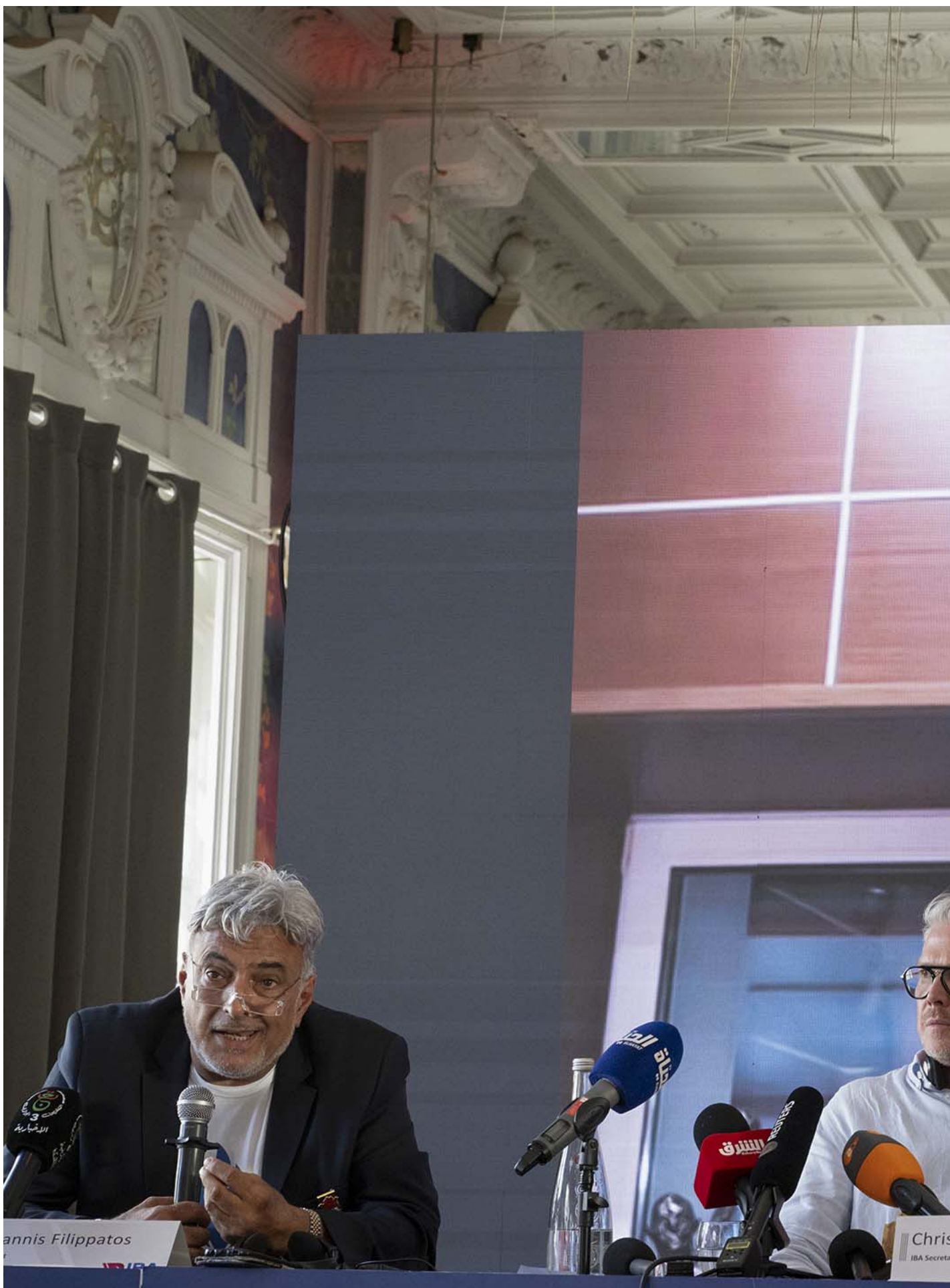
2024年8月5日，國際拳擊總會（IBA）在巴黎召開記者會，IBA主席 Umar Kremlev 透過視訊遠端參加該記者會。

被國際奧委會點名的國際拳協秘書長，也正是導致後者被從由國際奧委會所認可的國際體育聯合會中除名的核心原因。他名叫烏瑪爾·克列姆廖夫（Umar Kremlev），俄羅斯人，被認為與克里姆林宮關係密切。從2020年當選為國際拳協秘書長起，國際奧委會一直反對他的任職資格。