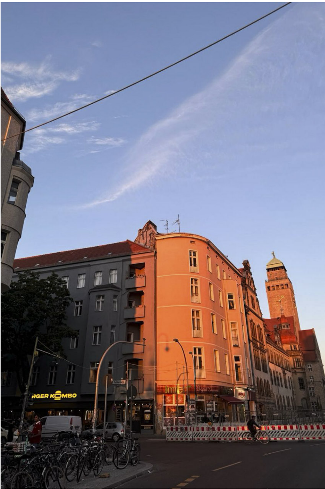
去到德國後，子雲較常在 Threads 紀錄生活見聞。