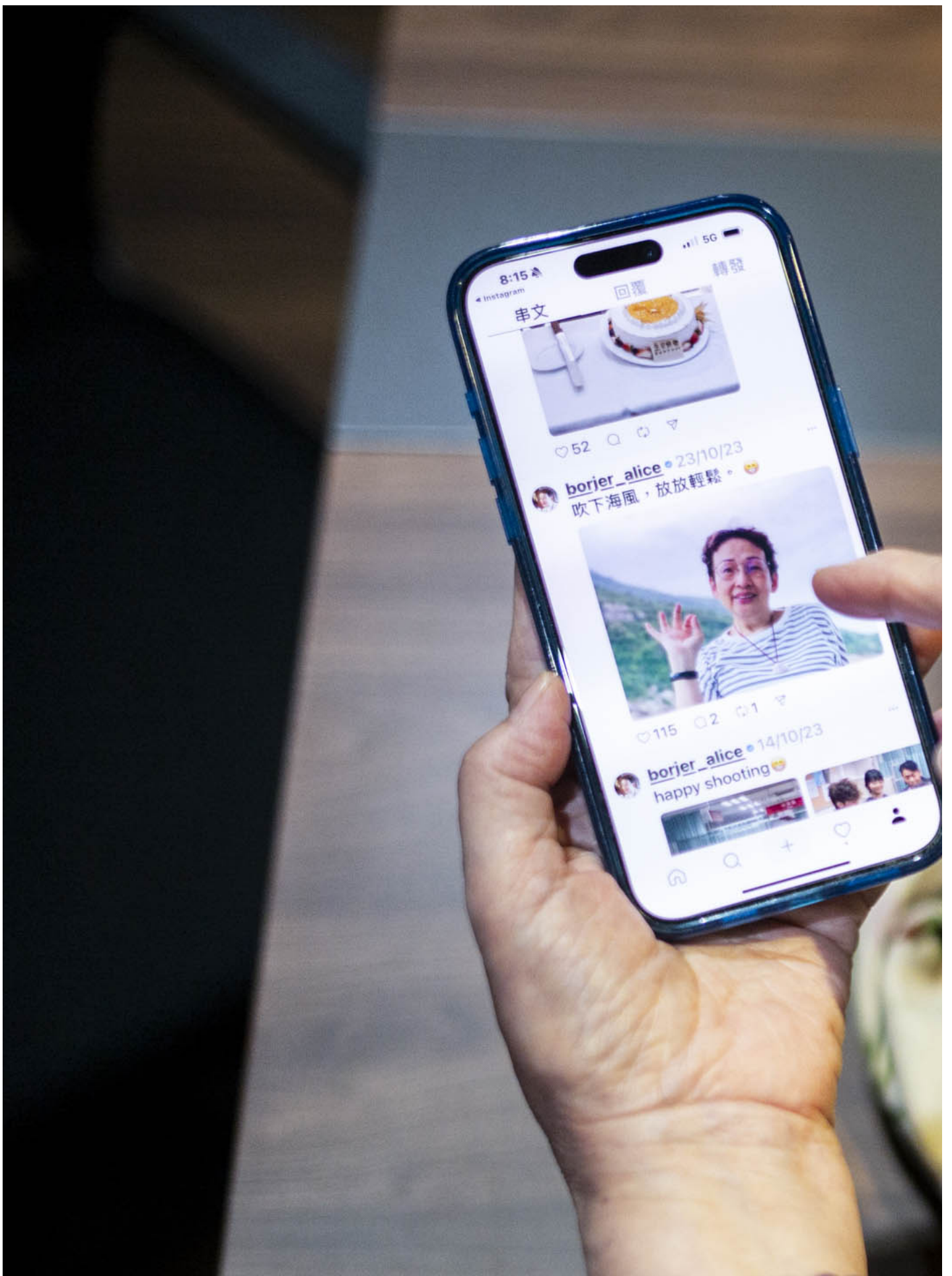
現時波姐的社交媒體一半是她自己經營，每當她拍下好看的照片、有趣事發生便會發帖。