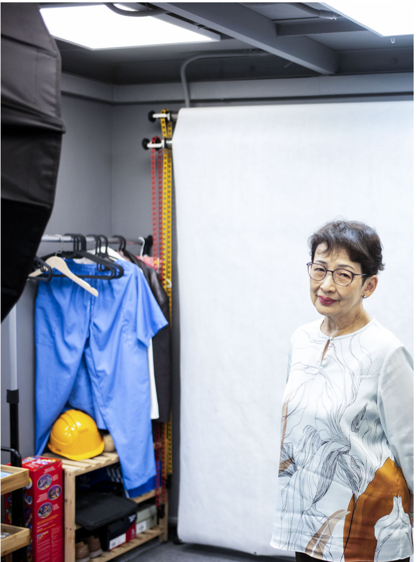
波姐迷上了社交媒體，手指像時針，一掃便滑走了時間。「我就是好奇。雖然已經80歲，但是我有20歲的心境。」

一個進入耄耋之年的演員，為什麼會用 Threads？63歲那年，波姐到運輸署續領車牌，職員告訴她最多只能續領七年。「那時我多失落！」波姐垂下眼瞼，「那我可以做什麼呢？一個老年人還可以做什麼？」此時，她的兒子 David 教她玩 Facebook，上面的每個讚好、留言都教波姐興奮，她意識到：「現在已經不流行考牌，現在流行玩社交媒體。」