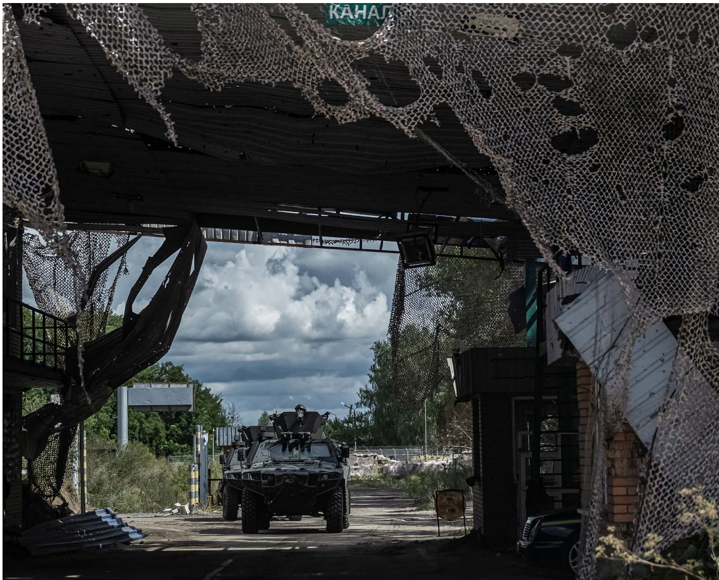
2024年8月13日，乌克兰苏梅地区，乌克兰军人乘军车经过俄罗斯边境的过境点。

俄乌战争进入第三年，前两年“有来有往”的攻防已经日渐成为旷日持久的堑壕战。但随着乌克兰军队在2024年8月初越境进攻俄罗斯库尔斯克州并夺取部分俄国领土，俄乌战局出现了一个新的转折点和巨大变数。