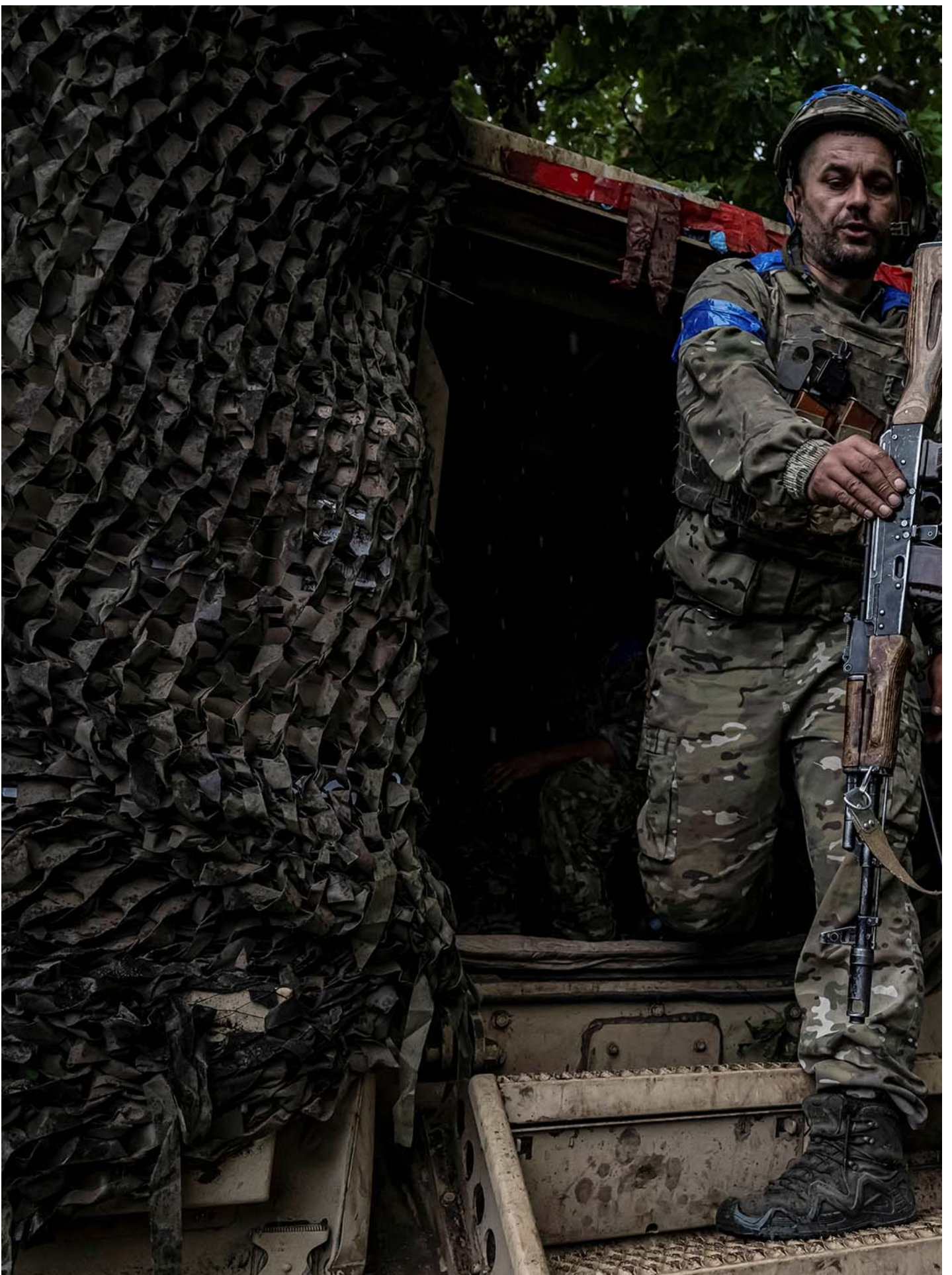
2024年8月13日，乌克兰苏梅地区俄罗斯边境附近，乌克兰军人从一辆装甲运兵车中走出来。

7月，乌克兰外长 库列巴访问中国 ，在广州会见和中国外长王毅。这是全面入侵后乌克兰访问中国的最高级官员。外界分析认为，这是乌克兰希望进行和谈的信号，到访中国则是希望中国从中斡旋。作为佐证，在会见库列巴后，王毅在紧接着其后举行的 东协 (ASEAN) 峰会上会见了俄罗斯外长拉夫罗夫 ，两人在会晤中谈到了乌克兰局势。